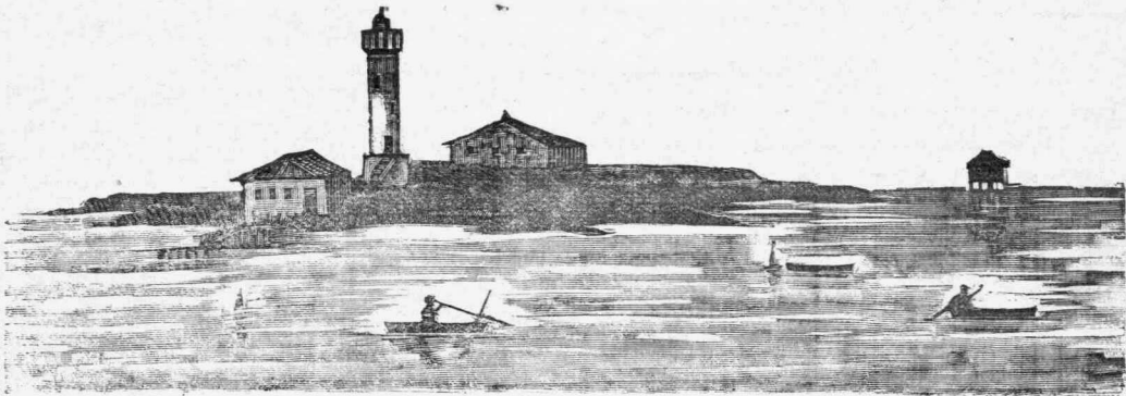
Ο ΦΑΡΟΣ ΤΟΥ ΑΓΙΟΥ ΣΩΖΟΝΤΟΣ (Μεσολόγγιον)

Εἰς μικρὰν ἀπόστασιν ἀπὸ τῆς ἡρωικῆς ταύτης ἀκτῆς εὐρίσκεται ἕτερον νησίον, κατάφυτον ἐκ διαφόρων δενδρυλλίων καὶ γραφικώτατον, τὸ