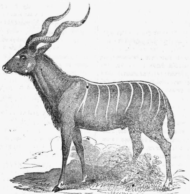
Ο ΑΝΘΟΛΟΣ ΣΤΡΕΨΙΚΕΡΩΣ.

ΕΙΣ τὰς κεντρικὰς καὶ νοτίους χώρας τῆς Ἀφρικῆς κατοικοῦσι πάμπολλα εἶδη ζῶων, καλούμενα ὑπὸ τῶν φυσικοῖστορικῶν μὲ τὸ γενικὸν ὄνομα Ἀντιλόπη, κατὰ διαφορὰν ἕκ τῆς Ἑλληνικῆς λέξεως Ἀνθόλοψ, — διδομένης ὑπὸ τοῦ Εὐσταθίου εἰς ἓν εἶδος τῶν ζῶων τούτων, καὶ ὑποδηλούσης τῶν ὀμμάτων τὴν λαμπρότητα. Ὁ Ἀνθόλοψ Στρεψικερως, τὸν ὁποῖον εἰκονίζει ἡ προτεταγμένη εἰκονογραφία, εἶναι ζῶον μεγαλοπρεπές, ὀκτὼ ποδῶν ἔχον μῆκος, τεσσάρων δὲ ὕψος κατὰ τοὺς ὤμους, ὥστε σχεδὸν εἶναι τοῦ ἵππου ἰσομεγέθους. Καὶ οἱ ἄρρνες καὶ αἱ θήλειαι ἔχουσι κέρατα, σπειροειδῶς συνεστραμμένα, καὶ ἰσχυρότατα. Τοῦ ἄρρνος εἶναι μάλιστα μεγαλοπρεπῆ, ὡς τέσσαρας πόδας ἔκτεινόμενα. Ὁ τράχηλος εἶναι παχὺς καὶ δυνατός· ἡ κεφαλὴ μεγάλη, τελειόνοσα εἰς πλατὺ ῥύγχος· τὰ μέλη γενικῶς παχέα καὶ εὐρωστα, καὶ ὄλον τὸ ἐξωτερικὸν φαινόμενον βοῶς μᾶλλον παρ' ἀνθόλοπος ὁμοῖον. Τὸ γενικὸν χρῶμα εἶναι μελαγχροινωπὸν φαρὸν, μὲ λευκὴν τινα στενὴν σειρὰν διαπερνῶσαν τὴν ῥάχιν, καὶ ὀκτὼ ἢ δέκα ὁμοίας σειρὰς ἕκ τῶν νῶτων κατερχομένας καὶ πλαγίως τὰ πλευρὰ διαβαίνουσας. Ἐπὶ τοῦ τραχήλου ὑπάρχει μικρὰ τις ἀραιὰ χαιτὴ μελάγχροινος, καὶ ἡ σιαγὼν, ὁ λάρυγξ, καὶ τὸ στῆθος ἔχουν ὁμοίας μακρὰς τρίχας, ἐν εἶδει γενειάδος. Αἱ παρειαὶ εἶναι σημειωμέναι μὲ δύο ἢ τρία λευκὰ στρογγύλα στίγματα· τὰ ὅσα εἶναι μεγάλα, ἢ δὲ οὐρὰ μετρίου μήκους, καὶ μὲ κοντὰς τρίχας ἐσκαπασμένην.