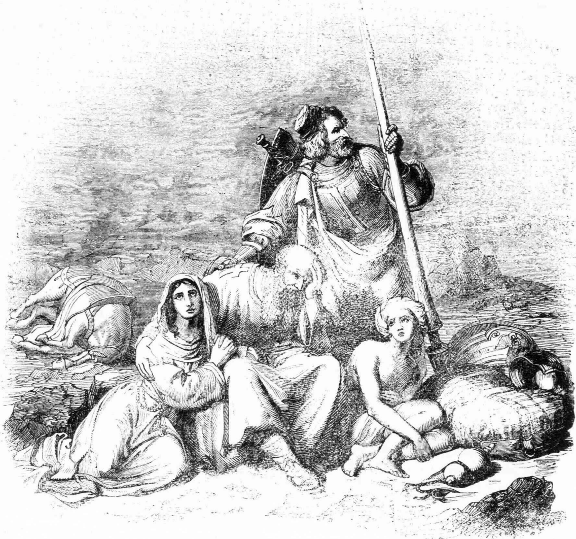
Προσκυνηται εις την Έρημον.

εις συμβίβασιν των σημερινων φαινομενων με τας αρχαιας περιγραφας. Ο Chateaubriand, οστις περιηλθε την Ελλάδα και Παλαιστινην το 1806 και 1807, εκφωνει ως επομενωσ.—“Την Ιουδαιαν περιερχόμενος τις, ἀηδιάζει κατά πρώτον· ἀλλ’ ὁπόταν, μεταβαίνων ἀπὸ μοναξίας εἰς μοναξίαν, βλέπη ἐνώπιον αὐτοῦ ἀπερίριστον διάστημα, ἐξαλείφεται βαθυηδὸν ἢ ἀηδία, καὶ ἡ ψυχὴ αἰσθάνεται μυστικὴν τινα εὐλάβειαν, ἥτις ζωογονεῖ καὶ ἀνυψοῖ τὸ πνεῦμα. Παράδοξα πολυλαχοῦ φαινόμενα διακηρύττουσι γῆν ἀπὸ θαύματα βρυσουσαν· ὁ καυστηρὸς ἥλιος, ὁ ὑψιπέτης ἀετὸς, ἡ ἀκαρπος συκῆ—ὅλη ἡ ποίησις, ὅλαι αἱ εἰκόνες τῆς Γραφῆς, ὑπάρχουσιν ἐνταῦθα. Πᾶν ὄνομα μυστήριόν τι μνημονεύει· πᾶν σπήλαιον τὸ μέλλον διακηρύττει· πᾶς λοφος ἀντηχεῖ προφήτου τόνους. Αὐτὸς ὁ Θεὸς ἐλάλησεν εἰς τὰς χώρας ταύτας· διερρηγμέναι πέτραι, ἐξηραμμενοὶ ποταμοί, ἡμιανεωγμένοι τάφοι, τὸ τερά-