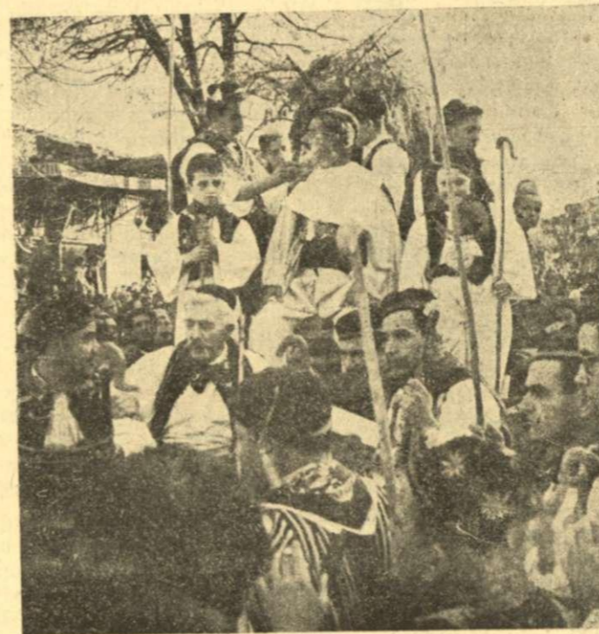
Τὸ ξύρισμα του γαμπρού