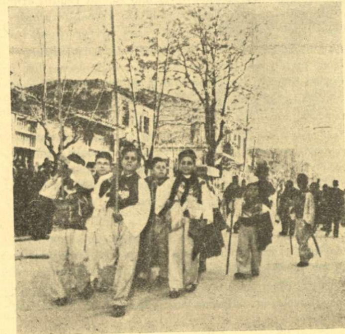
Πῶς μεταφέρεται ἡ παράδοσι ἀπὸ γενεὰ σὲ γενεὰ