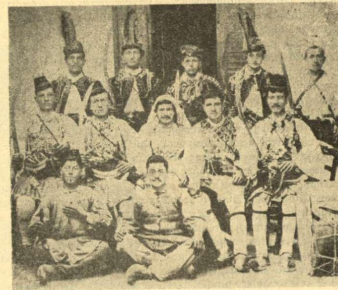
Ἡ Βλάχικος Γάμος τοῦ 1905