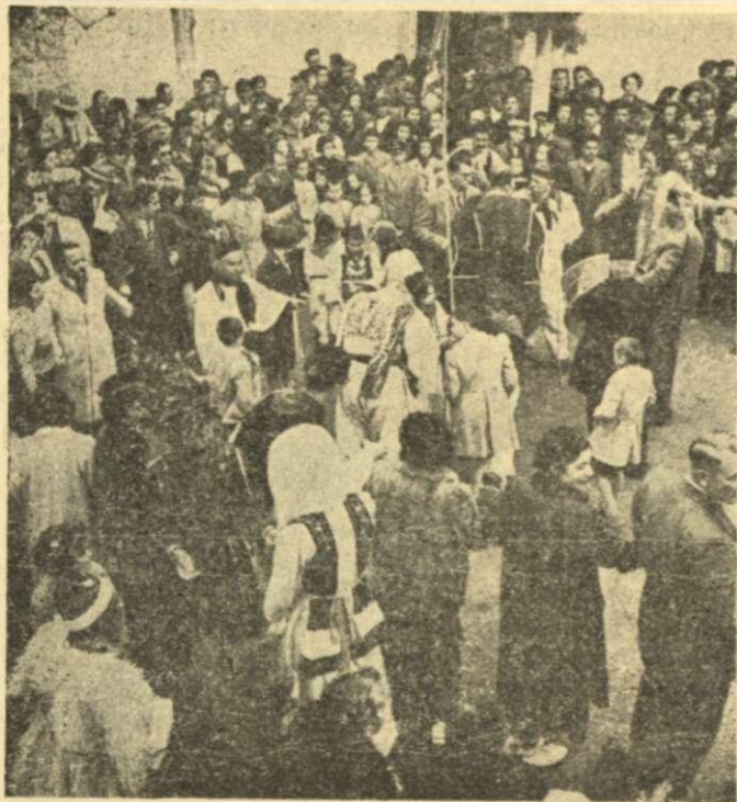
*Χορός μετά τὸν άρραβώνα.

— Κρίνε μαθές γεροσυμπέθερ' (ε) του εθές του παλληκάρ' ;