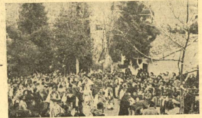
Ο μεγάλος χορός πρό του γάμου στην Άγία Τριάδα

Αρχίζει άμέσως ή πίπιζα και τὸ νταούλι ένα χαρούμενο τραγούδι του γάμου και ο άγγελιοφόρος τρέχει να αναγγείλει στον γαμπρό τὸ τέλειωμα του προξενιου. Εὐθὺς άμέσως ξεκινάει όλη ή συντροφιά του γαμπρού κι' ερχεται στην καλύβα τής νύφης. Μόλις φτάσει πέφτουν τρεις κουμπουριές και στήνουν χορό και σε λίγο ο πατέρας τής νύφης τήν βγάξει από τήν καλύβα, τότε πέφτουν άλλες τρεις κουμπουριές και ο γαμπρός φιλεϊ τήν νύφη στο μέτωπο και τήν