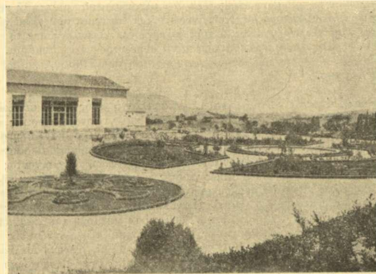
Το πάρκο του «Συλλόγου Φιλοπροόδων»