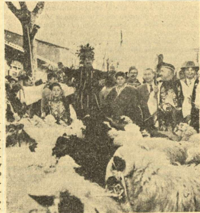
Ὁ «θεατρίνος» ἢ «γελοῖος» μὲ τὰ πρόβατα τοῦ προικιοῦ

ὀμορφότερο παλληκάρι, τοῦ δένουν τὰ χέρια μὲ κόκκινη κορδέλλα, τοῦ βάζουν λαμπάδες γύρω-γύρω, τὶς ἀνάβουν καὶ ἀρχίζουν γύρω του νὰ χορεύουν, ἀργά, βαρεῖα πένθιμα, γιατί τὸ παλληκάρι εἶναι εἰκονικὰ πεθαμένο. Σὲ κάθε γύρο σκύβουν στὸν νεκρὸ καὶ χονγιάζουν, κλαῖνε. Ἀφοῦ γυρίσουν κάμποσους γύρους, στὸ τέλος κάποιος χορευτῆς οἶχνει μιὰ κουμπουριά ὁ νεκρὸς ἀνασταίνεται καὶ τὸ γλέντι συνεχίζεται, μέχρις ἀργὰ τὴν νύχτα καὶ διαλύεται μετὰ τὰ μεσάνυχτα. Ἐτσι τελειώνει ἡ λαϊκὴ γορτῆ τοῦ «Βλάχικου Γάμου».