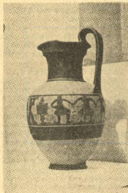
Τὸ προσφευθὲν ὑπὸ τῆς «Αἰξωνῆς» ἀγγεῖον εἰς τὸν δήμαρχον Θηβῶν, εἰς ἀνάμνησιν τῶν ἑορτῶν τοῦ 1953 με τὸ «Βλάχικο γάμο».

Πάνω ἀπὸ ἑκατὸν άτομα πῆραν μέρος στὴν τρίτη ἐκδρομὴ, στὶς 16 Φλεβάρη, με σκοπὸ τὴν παρακολούθηση καὶ συμμετοχὴ τῆς «Αἰξωνῆς» στὴν ἀναπαράσταση τοῦ «Βλάχικου Γάμου».