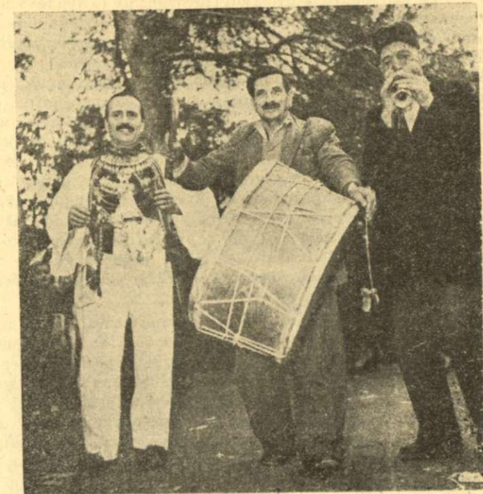
Ἐνας Βλάχος, ἡ πίπιζα καὶ τὸ τύμπανο.