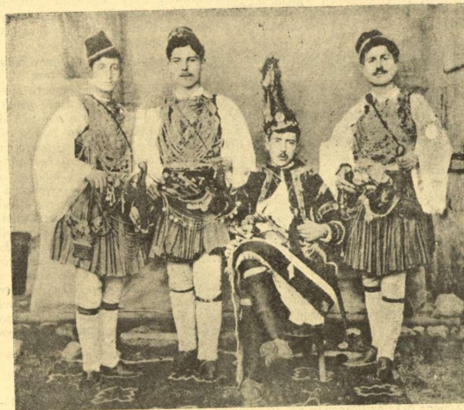
Ἡ Βλάχικος Γάμος τοῦ 1915