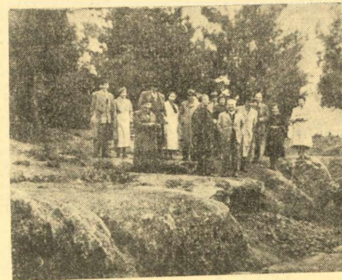
Ἐκδρομεῖς Αἰξωνεῖς παρὰ τὸν Ἰσμηνόν.