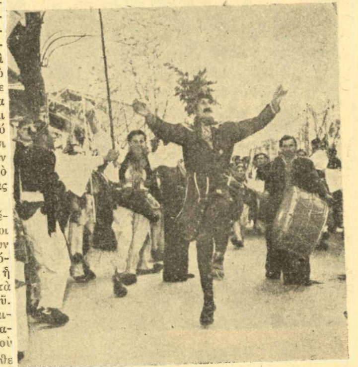
Ἡ γαμήλια πομπή, ὃ θεατρίνος. Χορὸς τῶν Βλάχων ἐν πορείᾳ

Στις 10 τὸ πρωῖ τῆς Δευτέρας ἐπιστρέφουν οἱ δύο καπεταναῖοι σὲ τις συντροφίαι τους, καὶ δίνουν διαταγὴ νὰ ξεκινήσουν γιὰ τὸν τόπο τῆς συγκεντρώσεως. Πρῶτα ἢ παρέα τῆς νύφης ξεκινᾷ χωριστὰ καὶ ἀκολουθεῖ ἢ παρέα τοῦ γαμπροῦ. Τὰ φλάμπουρα μπροστὰ μὲ τὰ παιδάκια, μετὰ ἢ πίπιζα καὶ τὸ νταούλι ἀκολουθεῖ ὃ θεατρίνος, ποὺ εἶναι πάντοτε ἐπικεφαλῆς κάθε πομπῆς. Χορεύει συνεχῶς, χοροπηδαεὶ μονάχος του, χωρὶς νὰ τὸν συνοδεύει κανεὶς, μὲ τὰ χέρια του πάντοτε σὲ κίνηση εἶναι σὰν νὰ τραβᾷ τὴν πομπή, ἐκεῖ ποὺ αὐτὸς θέλει. Οἱ βλάχοι ὥσπου νὰ φτάσουν στὸν τόπο τῆς συγκεντρώσεως, δύο τρεῖς φορές στὸν δρόμο χορεύουν μὲ τις γκλίτσες καὶ τὰ γιαταγάνια ψηλά καὶ μοιάζουν, ὅπως χαρακτηριστικὰ εἶπε ὃ Πικιώνης, σὰν στρατὸς τῶν ἀρχαίων ποὺ πορεύεται, μὲ τὰ δόρατα ψηλά, μὲ τοὺς ἤχους