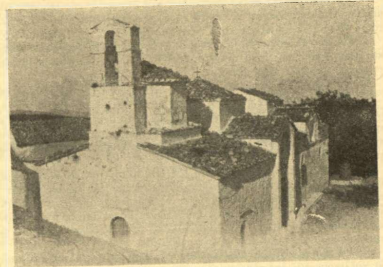
Εκκλησία Μονής Αγ. Σωτήρος

Από το 1830 αρχίζει η προσπάθεια των Θηβαίων για την οικονομική τους ανόρθωση και την αποκατάσταση των έρειπίων που τους κληροδότησε η Τουρκοκρατία και η επαναστατική περίοδος 1821-1829.