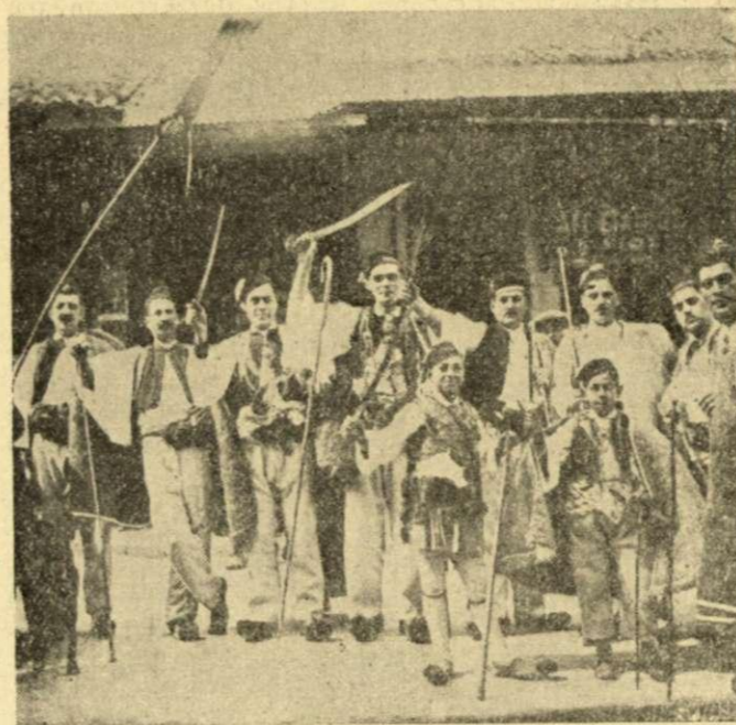
Ὁ Βλάχικος Γάμος τοῦ 1925