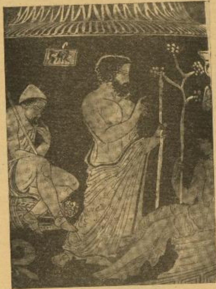
Ὁ Μελάμποδος (μεγέθυνση ἀπὸ τὸν ἀμφορέα τῆς Νεαπόλεως)

ἐξευρημένα ὅσον τε πηχυὰ ἀγάλματα νευρόσπαστα, τὰ περιφορέουσι κατὰ κόμας γυναῖκες 17 νεῦον τὸ αἰδοῖον, οὐ πολλῶν τεω ἔλασσον ἐδὸν τοῦ ἄλλου σώματος· προγέεται δὲ αὐλός, αἱ δὲ ἔπονται ἀείδουσαι τὸν Διόνυσον. Διότι δὲ μέζον τε ἔχει τὸ αἰδοῖον καὶ κινεῖ μόνον τοῦ σώματος, ἐστὶ λόγος περὶ αὐτοῦ ἱερὸς λεγόμενος. Ἦδη ὦν δοκεῖ μοι Μελάμπους ὁ Ἀμυθένωρος τῆς θυσίης ταύτης οὐκ εἶναι ἀδαῆς ἀλλ' ἔμπειρος». Ἡροδ. II. 49 (H. Kallenberg).