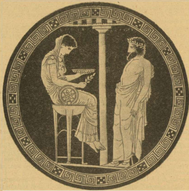
Εἰκὼν 2.—Ἡ Θέμις—Πυθία, δίδουσα χρῆσμον εἰς τὸν Αἰγέα. (Παράστασις ἐπὶ πηλίνῃς φιάλῃς τοῦ 5ου π. Χρ. αἰῶνος).

ρικὸν τοῦ πυθμένου ὡς κάτοπτρον καὶ περιεῖχεν, ἀσφαλῶς, ὕδωρ. Ἴδου ἀφ' ἑαυτῆς καὶ ἀβιάστως προκύπτουσα ἢ λύσις τοῦ αἰνίγματος: Τὸ ὕδωρ ἦτο τὸ μαντικὸν εἶδος διὰ τοῦ ὁποίου ἐχρησμοδοτεῖ ἡ Πυθία: τοῦτο δὲ ἐλαμβάνετο τελετουργικῶς ἐκ τῆς Κασσοτίδος πηγῆς καὶ δι' αὐτοῦ ἐπληροῦτο ἡ μαντικὴ φιάλη.