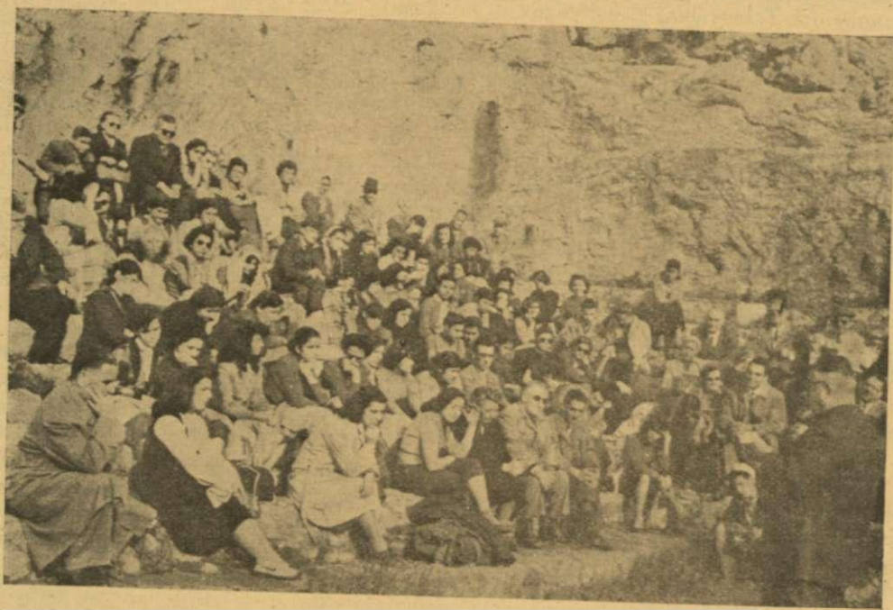
Ἐκδρομεῖς τῆς «Ἐπιστημονικῆς Φυσιολ. Ἐνώσεως» καὶ τῆς Αἰξωνῆς» στὸ ἀρχαῖο Τελεστήριό