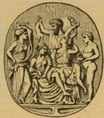
Ὁ ἐξαγνισμὸς τῶν Προιτίδων ἀπὸ τὸν Μελάμποδα (ἀπὸ σφραγιδολίθου Ἑλληνικῆς τέχνης).