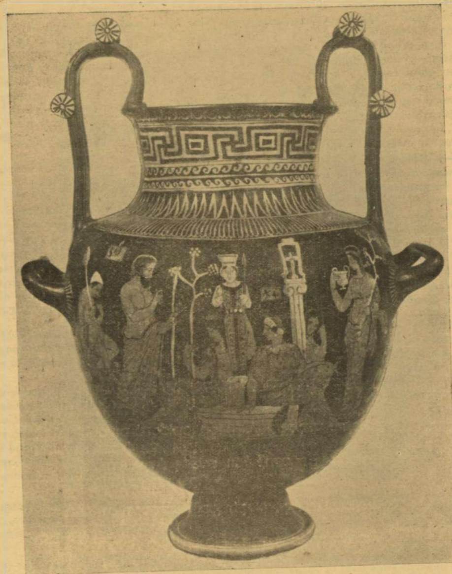
Ἡ ἴσση τῶν Προϊτίδων ἀπὸ τὸν Μελάμποδα στὸ ἱερὸ τῆς Ἀρτέμιδος Ἡμέρας. (Ἀπὸ φωτογραφία ἀμφορέως τοῦ Μουσείου τῆς Νεαπόλεως) Πρώτη δημοσίευση.

τὴν αἰτία πού λέει ὁ Διευχίδης 8 ὅτι τάχα μαύρισαν τὰ πόδια του, δταν ἦταν νήπιο ἀκόμα, ἐπειδὴ ἡ μητέρα του Δορίπη τὰ ἄφησε ἀκάλυπτα στὸν ἥλιο!