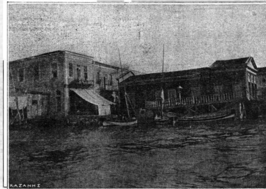
ΠΑΡΑΛΙΑΚΑ ΚΑΦΕΝΕΙΑ ΚΥΖΩΝΙΩΝ

μονικαῖς νὰ γεύηται ἡδέων ἔδεσμάτων καὶ νὰ δυσφραίνηται τῶν πλεόν εὐωδῶν ὀσμῶν καὶ περ παντελοῦς ἐπικρατούσης πέριξ αὐτοῦ ἐπιθυμίας καὶ μηδενὸς ὑπάρχοντος ἔδεσματος ἢ εὐώδους τινος σώματος; Καὶ τοσοῦτω μᾶλλον τοῦτο εἶ- ναι παράδοξον καθ' ὅσον ἡ ψευδαισθησις εἶ- ναι φαινόμενον καθαρῶς ψυχικὸν καὶ παντά- πασι τῶν αἰσθήσεων ἀνεξήρητον οὕτως ὥστε ἄτομα καὶ περ κωφά, καὶ περ τυφλά καὶ ἐστερημένα τῆς γεύσεως καὶ τῆς δυσφρήσεως, ἐν τούτοις δύναται νὰ ὑφίστανται ψευ- δαισθήσεις καὶ τῶν τεσσάρων τούτων αἰ- σθήσεων. Ὅποσαι ἰδέαι δὲν ἐξηνέχθησαν καὶ