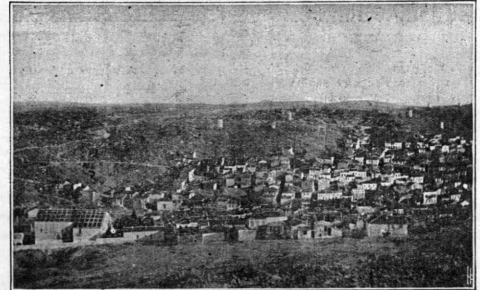
ΑΝΑΤΟΛΙΚΗ ΣΥΝΟΙΚΙΑ ΚΥΖΟΝΙΩΝ

ὅτι τὰ παιδιά ἀνέκτησαν τὰ δροσερὰ τῆς ὑγείας χρώματα. Ἐπομένον ὅτι τὰ παιδιά ἐξυγιόσθησαν καὶ ἐμετρήθησαν κατὰ τὴν ἀναχώρησιν. Αἱ αὐταὶ διατυπώσεις γίνονται καὶ κατὰ τὴν ἐπιστροφὴν. Ἴδου τὸ ἀποτέλεσμα τῆς διπλῆς ταύ-