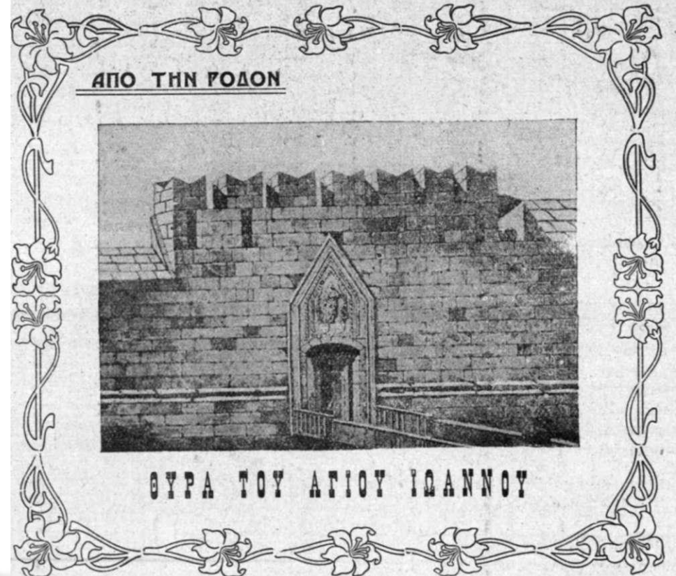
ΑΠΟ ΤΗΝ ΡΟΔΟΝ