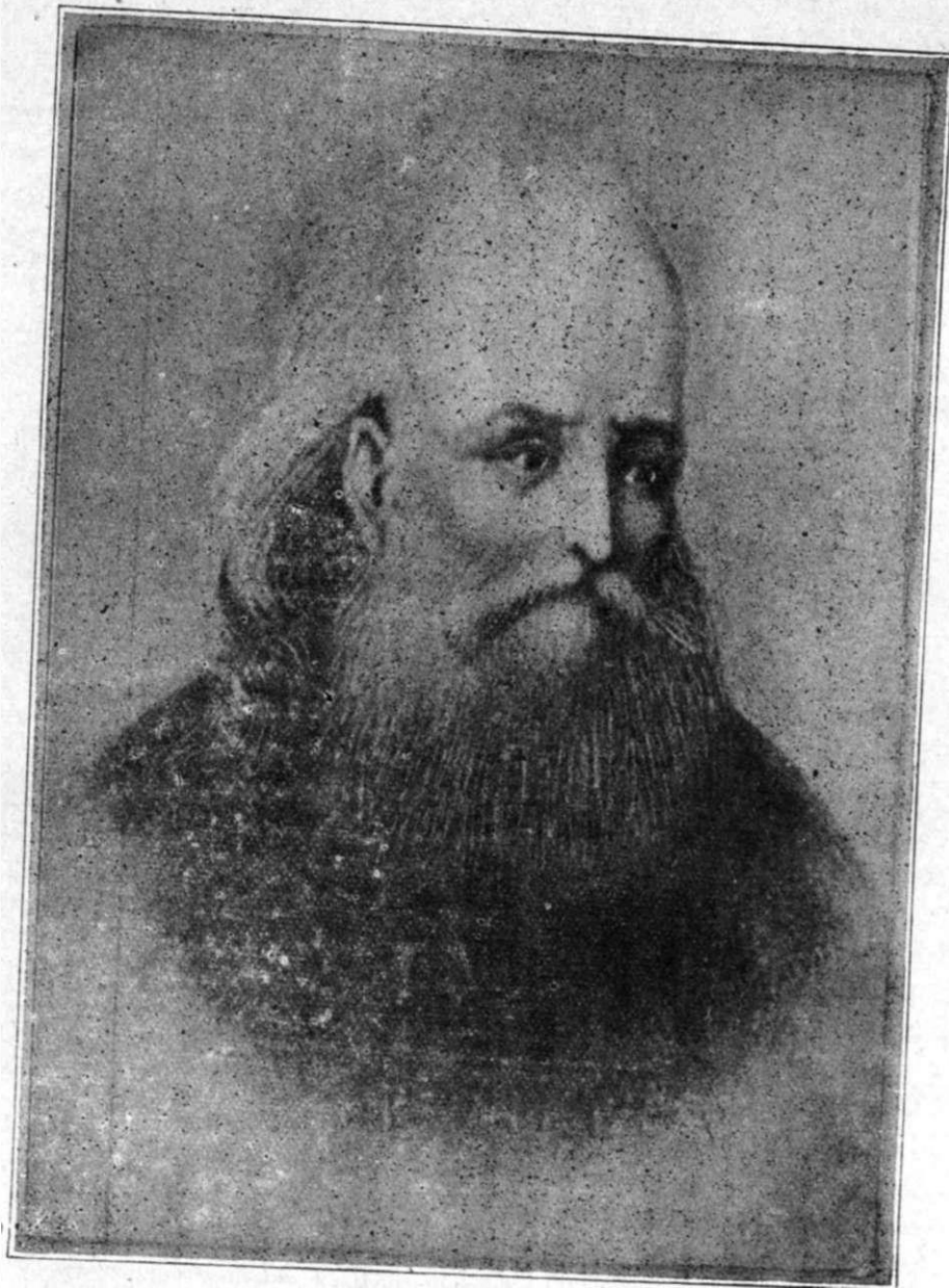
Ο ΘΕΟΦΙΛΟΣ ΚΑΪΡΗΣ ΤΩΝ ΠΑΠΠΩΝ ΚΑΙ ΠΑΤΕΡΩΝ ΗΜΩΝ ΤΩΝ ΚΥΔΩΝΙΑΤΩΝ

Ἡ ἐπὶ τὸν ἄνω τίτλον βαθένους μελέτη τοῦ ἐπιλέκτου ἡμῶν Συνεργάτου κ. Αποστολάκη τυχάνει ἐξαιρετικῶν ἐνδιαφερόντων. Ὁ κ. Αποστολάκης εἰς τὴν περὶ Θεοφίλου Καΐρη, τοῦ σοφοῦ ὄσον καὶ ἀκαταλήπτου τοῦτου ἀνδρὸς μελέτην, δὲν ἀκολουθεῖ τὰς πεπαιγμένους κρίσεις, ἀλλὰ διαχέει φῶς εἰς σκοτεινὰ σημεῖα τοῦ ψυχικοῦ τοῦ Καΐρη ὀρίοντος καὶ ἀποκαλέπει καὶ ὡς εὐφυῆς ἰατρός καὶ ὡς ἀκάματος ἱστοριοδίφης ὅποια ὑπῆρξαν τὰ πραγματικὰ αἰτία τῆς μεταστροφῆς τοῦ Χριστιανικοῦ τοῦ Καΐρη πνεύματος, ἥτις τὴν γενικὴν κατάκειον ἐξήγειρεν. Ὁμολογουμένως ἡ ἐν λόγῳ μελέτη σπου-