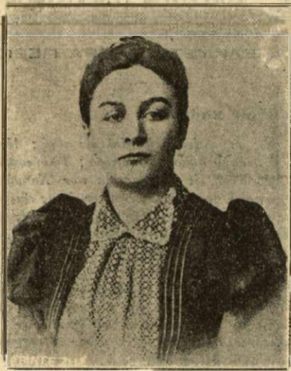
Η ΠΡΙΓΚΗΠΙΣΣΑ ΜΑΡΙΑ

Κόρη του πρίγκηπος Ρολάνδου Βοναπάρτου 'Η μηγατή του πρίγκηπος Γεωργίου