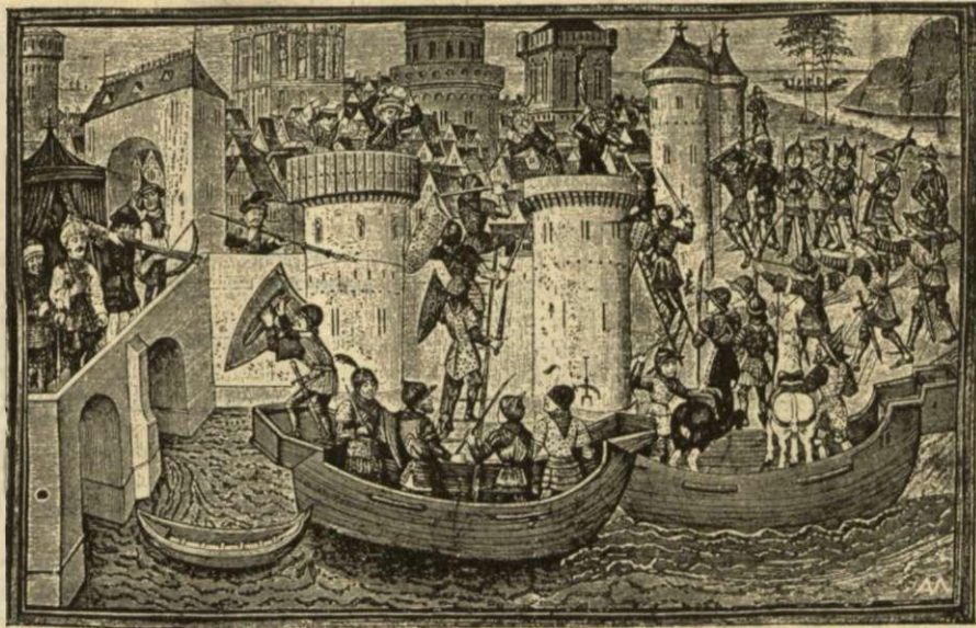
Σκηνή εκ της άλωσης της Κωνσταντινουπόλεως εν τῷ βελγικῷ χειρογράφῳ της Bibliothéque de l' Arsenal των Παρισίων.

('Εκ της προκηρύξεως διεθνούς διαγωνισμού της προς ίδρυσιν άνδριάντος του Παλαιολόγου 'Επιτροπής.