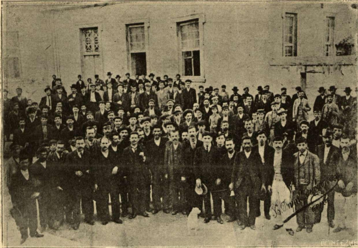
Οι άπεργοί εργάται εις την αθήν του Παρθεναγωγείου Πειραιώς, τόπον των συνηθούσεών των.

Rouget de Lisle, γνωστός ως στιχουργός και ικανός μουσικός. Ήγέσαντο παρ' αυτού εάν ήδύνατο ν' ανταποκριθῆ εις τὸν πόθον τούτων τῶν συμπολιτῶν του. Ἀπεποιήθη, ἰσχυρίζομενος ὅτι μέχρι τῆς ἐποχῆς ἐκείνης δὲν εἶχε συνθέσει ἢ μικροὺς στίχους συναναστρωφῆς.