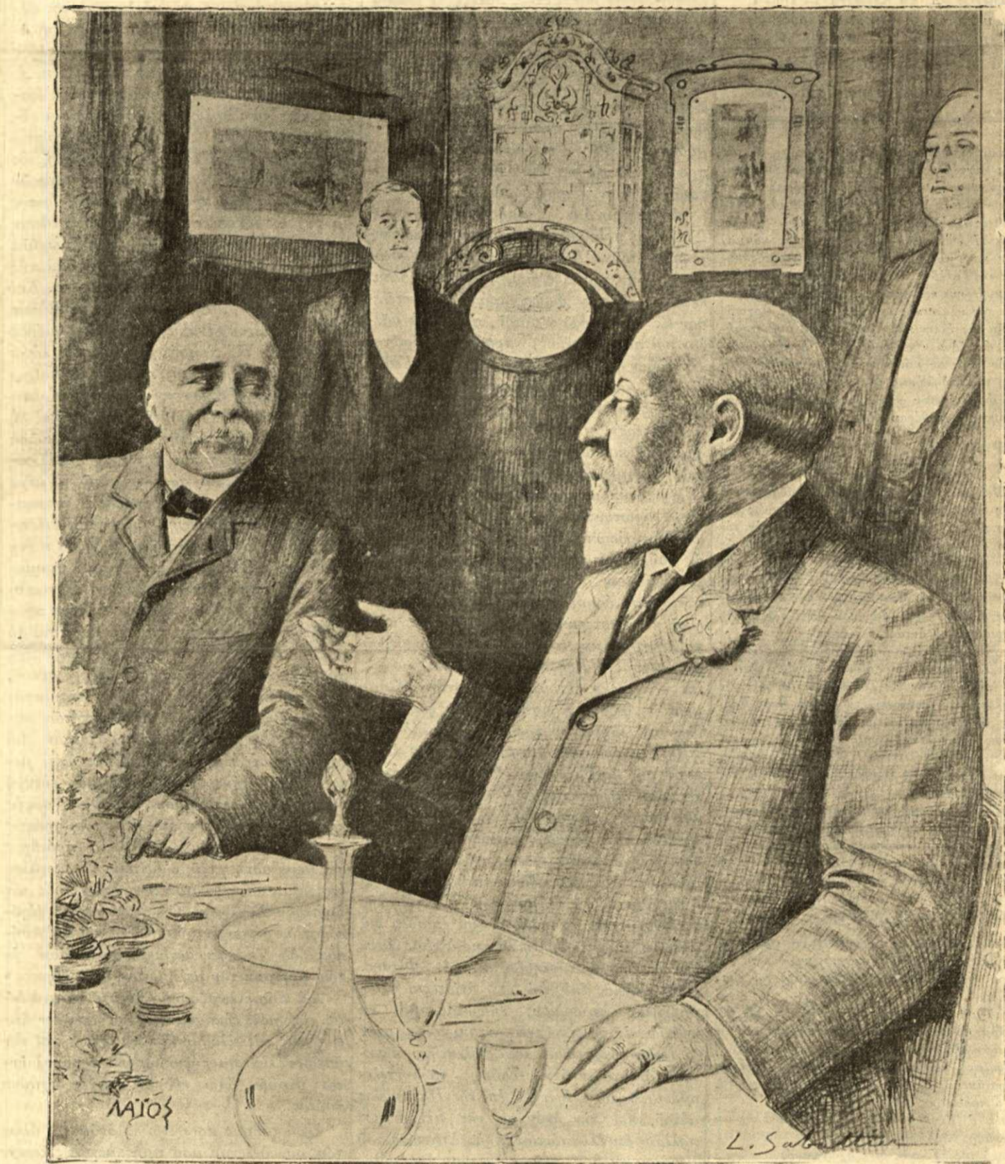
Ο ΕΔΟΥΑΡΔΟΣ ΣΥΝΤΡΩΓΩΝ ΜΕ ΤΟΝ ΚΛΕΜΑΝΣΩ ΕΙΣ ΜΑΡΙΕΜΒΑΔ

Εἰς πολλὰ προηγούμενα «Σταχυολόγημα» εἶχομεν ἀναγγεῖλει τὸ ταξίδιον ἀριθμοῦ Ἀμερικανίδων δεσποινίδων εις Εὐρώπην χάριν διδασκαλίας. Τὸ ταξίδιον αὐτὸ συνετελέσθη και αἱ ἀμερικανίδες ἐπίστρεψαν εις τὰς πατρίδας των. Ἐξέρετε κυρίαί μου, πῶς χαρακτηρίζουν τὰς εὐρωπαϊκὰς συναδέλφους των;