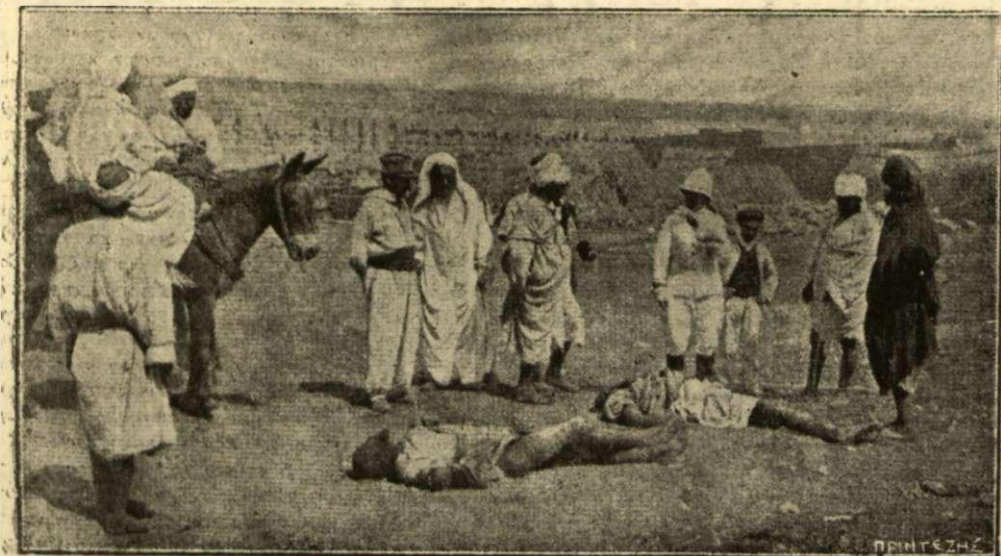
Δύο νεκροὶ μαρκοῖνοὶ ἐπὶ τοῦ ἐδάφους φονευθέντες εἰς μίαν ἀνίχθουιν. Οἱ πρόκριτοι τῆς Καζαμπλάνκας βεβαιοῦντες τήν ταυτότητά των.

Οἱ Ἰβηρίται— τοὺς ἐνόησαν καλὰ πλέον τοὺς Ρῶσσοις ἐκεῖ ἐπάνω— ἀνθίστανται, μὲ δικαίωμα τὸ ὁποῖον ἔχουν και ἡ Ρωσσία κρατεῖ τὰ εἰσο- δήματα τῆς Βεσσαραβίας διὰ νά ἐ-