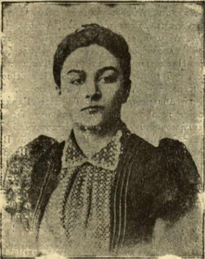
Η μητρού του πρίγκηπος ΜΑΡΙΑ ΒΟΝΑΠΑΡΤΟΥ