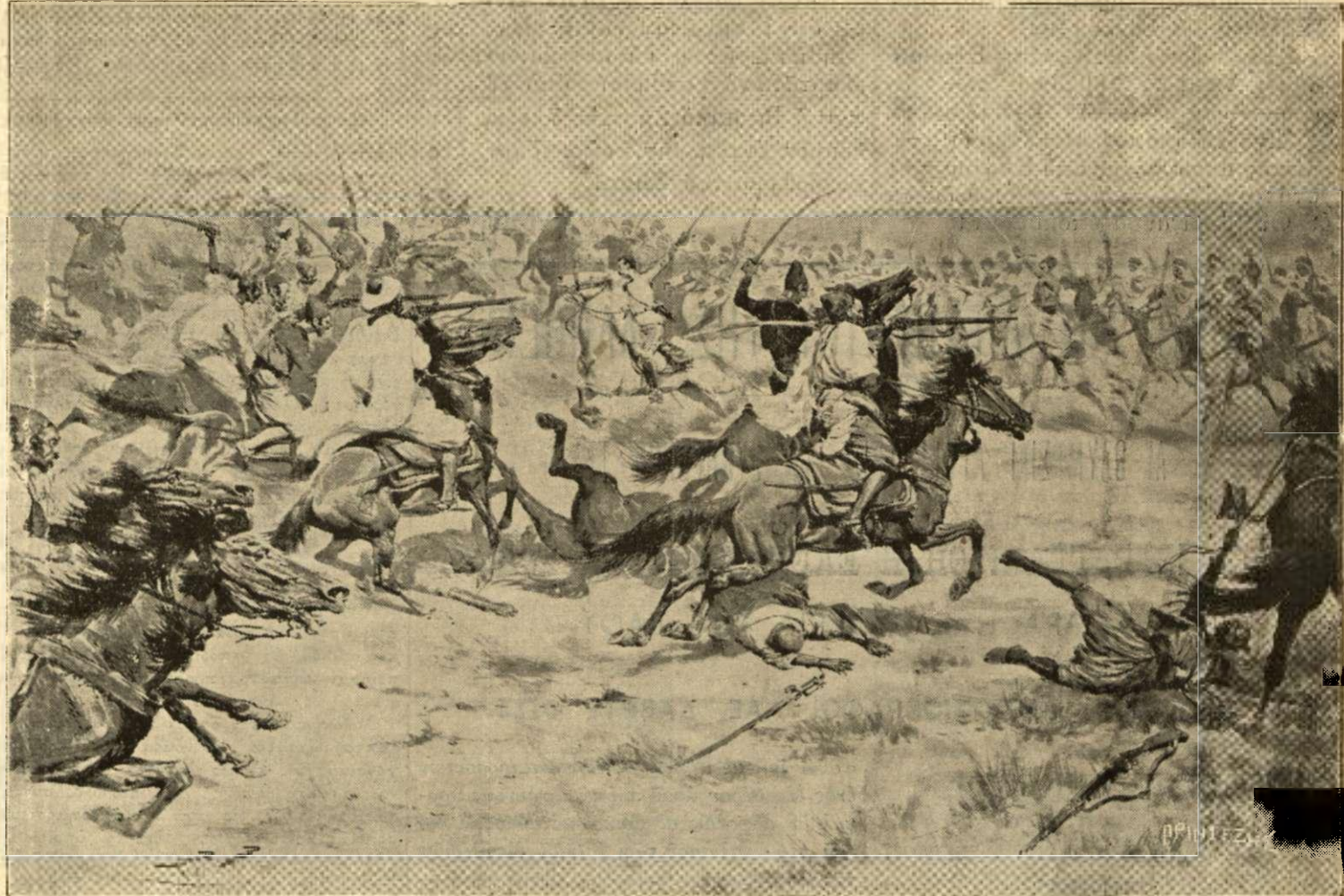
Ἡ ἐπέλασις τῶν Γάλλων σαχηδῶν κατὰ τῶν Μαρκοινῶν ἔξωθεν τῆς Καζαμπλάνκας. Ὁ ἴληρος Κὼ ἐπὶ κεφαλῆς

και δύο ἄλλοι; που ἤξερεν ὁ Σαντάς ἀπὸ τὰ μεταλλεῖα.