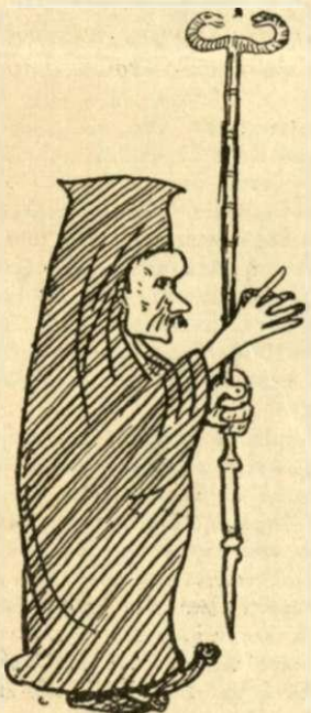
Ἡ τελευταία εἰδολογία τοῦ Πατριάρχου τῶν Οἰκονομολόγων.

Ἰδοὺ λοιπὸν ἡ αἰτία δι’ ἣν τὰ ὄναρια ἀφ’ ἐνός, καὶ τὰ σιβαρὰ νῶτα τῶν Μελεταίων ἀγχοφόρων ἀφ’ ἑτέρου ἐχρησίμευον ὡς μέσα μεταγωγικὰ τῶν φιλομούστων κυριῶν καὶ κυριῶν.