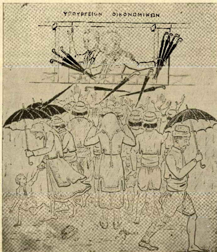
Πῶς ὁ κ. Σιμοπούλος ἐστέγασε τοὺς πρόσφυγας!