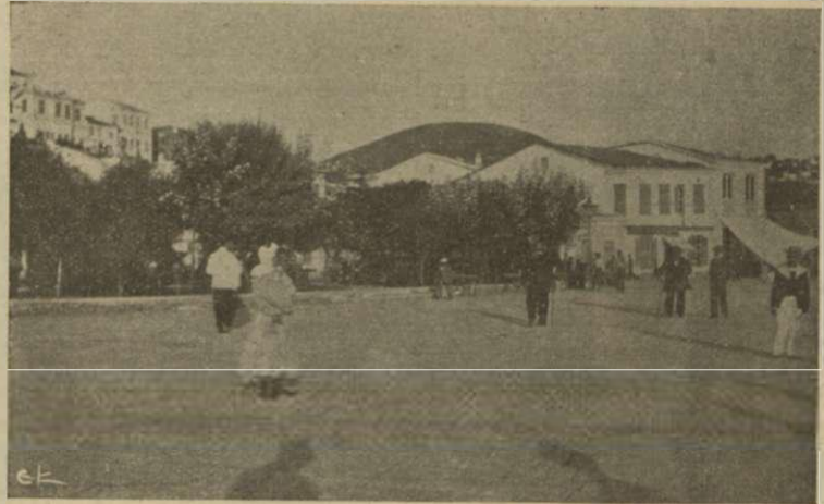
Ἡ πλατεία τῆς πρωτεύουσος τῆς Σάμου (Βαθύ).