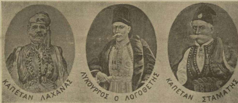
ΟΙ ΗΡΩΕΣ ΤΗΣ ΣΑΜΙΑΚΗΣ ΕΠΑΝΑΣΤΑΣΕΩΣ ΤΟΥ 1821

— Η ΕΠΙΣΤΟΛΗ ΤΟΥ, ΥΜΝΟΣ ΠΡΟΣ ΤΗΝ ΠΑΤΡΙΔΑ. — Ο ΙΔΕΩΔΗΣ ΕΛΛΗΝ ΠΟΛΙΤΗΣ