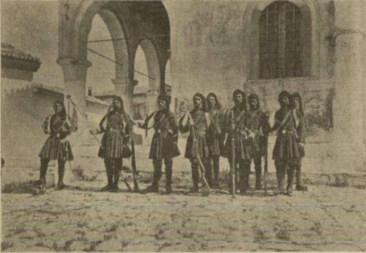
Τμήμα Σαμίων χωροφυλάκων με τὴν σημαίαν καὶ τὸν σουλτανικὴν ἠχοῦν τοῦ ναοῦ τῶν Ἁγίων Θεοδώρων ἐν Βαθείᾳ.