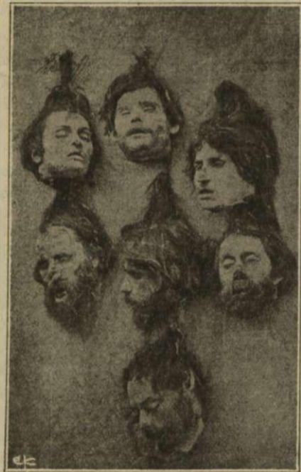
Αἱ κεφαλαὶ τῶν ἐπιὰ φονευθέντων ληστῶν ἐν αἷς καὶ τοῦ ἀρχιληστοῦ Χρήστου Ἀρβανιάκη, ἐκτεθειμέναι εἰς τὸ Πολύγωνον τὸ Πάσχα τοῦ 1870 (δύο ἡμέρας μετὰ τὴν τραγωδίαν τοῦ Δήλεσι.

Ἐκτοτε τὰ ἔχνη τῆς συμμορίας εἶχον ἀπολεσθῆ πρὸ ὅλλας τὰς ἐρέυνας τῶν ἀρχῶν ὅτε τὴν 30ην Μαρτίου ἡ ἰδία συμμο-