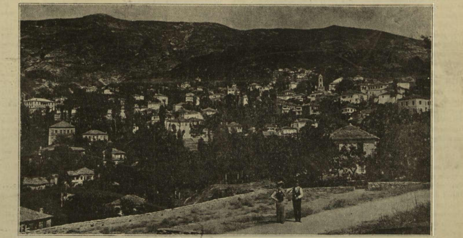
Η ΜΑΓΕΥΤΙΚΗ ΠΟΡΤΑΡΙΑ ΤΟΥ ΠΗΛΙΟΥ