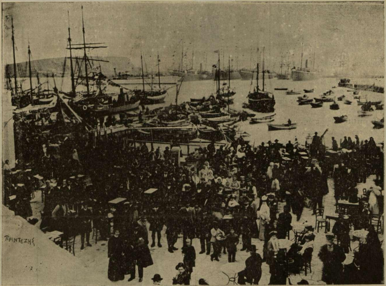
Ο ΛΙΜΝΗ ΚΑΙ Η ΑΠΟΒΑΘΡΑ ΕΙΣ ΤΗΝ ΤΗΝΟΝ Ὁμίλος προσκυνητῶν τὴν παραμονὴν τῆς 25ης Μαρτίου

Ὅταν βλέπομεν τὸν Μικρασιάτην δακρύνοντα ἐπὶ τῷ ἀκούσματι τοῦ πολυχρονισμοῦ τῆς Ἑλλ. Δυναστείας, καὶ τὸν Μακεδόνα καὶ Ἡπειρώτην σκιρτῶντα ἐπὶ τῇ θείᾳ ὀλιγίστῳ Ἑλλήνων στρατιωτῶν, καὶ τὸν Θράκα καὶ τὸν Χίον καὶ τὸν Θάσιον καὶ τὸν Λέσβιον καὶ τὸν Μιτυληναῖον φρίσσοντας ἐπὶ τῇ θείᾳ τοῦ καταπλέοντος ἀτμομυοδρομονοῦ ἡμίολιας, δύναται πᾶς τις νὰ φαντασθῇ ὅποια θύελλα ἀγίου ἐνθουσιασμοῦ θέλει