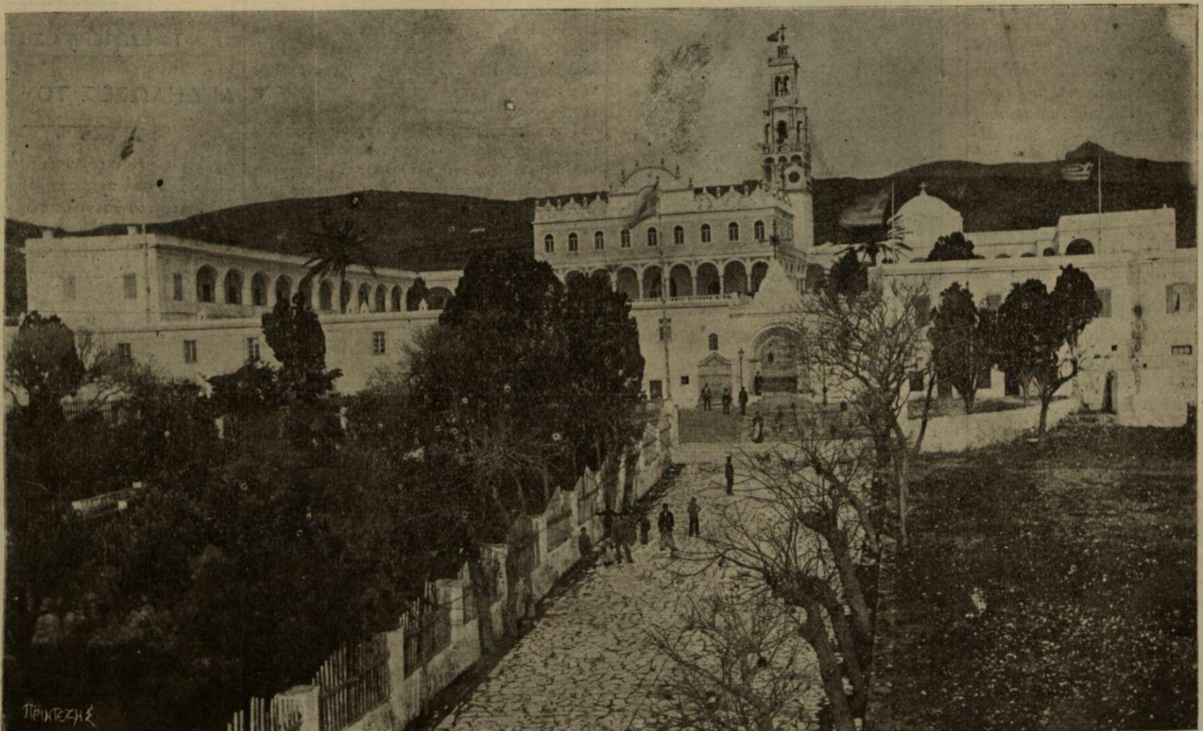
Ο ΠΕΡΙΚΑΛΛΗΣ ΝΑΟΣ ΤΗΣ ΕΥΑΓΓΕΛΙΣΤΡΙΑΣ

Ἡ ΠΑΝΕΛΛΗΝΙΟΣ ΕΘΝΙΚΟΘΡΗΣΚΕΥΤΙΚΗ ΠΑΝΗΓΥΡΙΣ