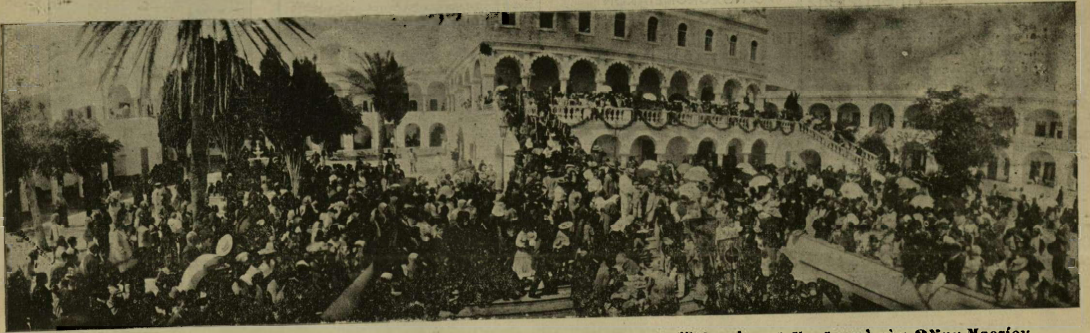
Φωτογραφία ληφθεῖσα κατὰ τὴν περιφορὰν τῆς Ἁγίας Εἰκόνης τὴν στιγμὴν τῆς ἐξόδου ἐκ τοῦ Ναοῦ κατὰ τὴν 25ην Μαρτίου