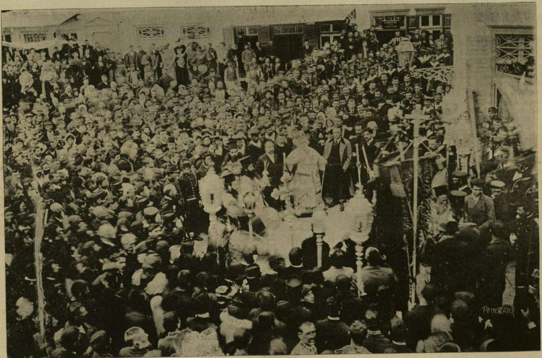
Ἡ ΜΕΓΑΛΗ ΔΕΗΣΙΣ ΕΙΣ ΤΗΝ ΠΑΡΑΛΙΑΝ ΚΑΤΑ ΤΗΝ ΠΕΡΙΦΟΡΑΝ ΤΗΣ ΑΓΙΑΣ ΕΙΚΟΝΟΣ ΤΗΝ 25ην ΜΑΡΤΙΟΥ