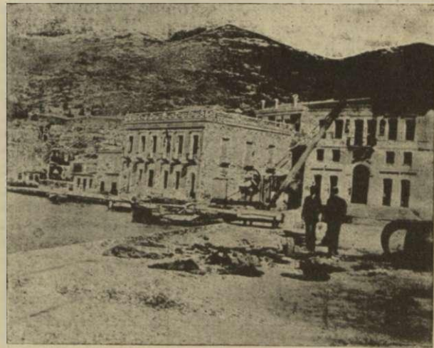
Ὁ λιμενοβραχίον ἐπὶ τοῦ ὁποίου ἐγένετο ἡ πρώτη μετὰ τοῦ ἀποβιβασθέντος τουρκικοῦ στρατοῦ συμπλοκὴ τῶν ἐνόπλιων Σαμίων, ἔδωκε φρονεῦσθαι ἐπὶ τοὺς 100 Τούρκους. Αὐτοὶ τουρκικὰ πτώματα ἀναδίδουν ἀκόμη τὴν βρῶμαν των εἰς τὸ πλακόστρωτον ἐν μέσῳ σωροῦ ἀκαθάρατων ρακῶν.