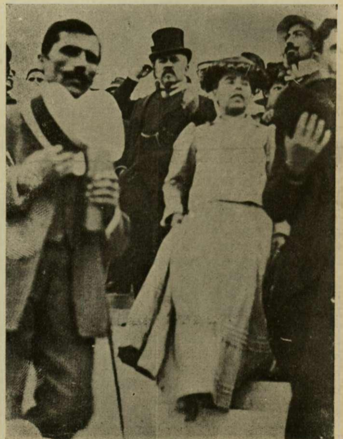
Ὁ Ὑπουργὸς τῶν Ἐσωτερ. καὶ Οἰκονομ. κ. Καλογερόπουλος ἐξωθεν τοῦ ναοῦ μετὰ τὸ μνημόσυνον.