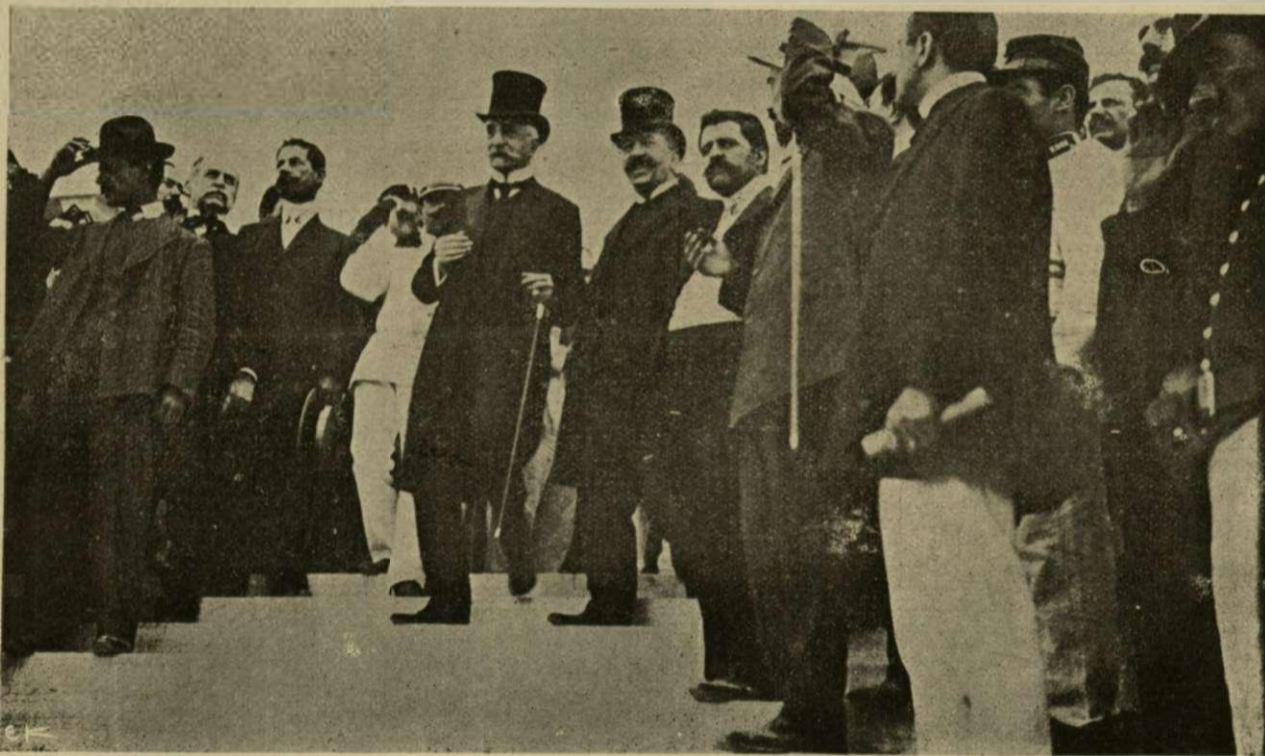
Ὁ πρωθυπουργὸς κ. Θεοτόκης κατερχόμενος τὴν κλίμακα τοῦ Ναοῦ μετὰ τὸ μνημόσυνον.

σοετόν, οὐ παρατίθωμεν ὀλίγας στροφάς. Ἐξώθεν τοῦ Ναοῦ αἱ ὀρασιώτεροι ἐλπίδες τοῦ ἔθνους, οἱ μνηστὰι μετὰ τὰς σημαίας των καὶ αἱ μουσικαί.