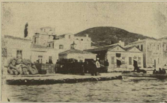
Τούρκοι στρατιῶται φρονεῖσθαι εἰς τὴν ἀποβάσαν ἡμποδίζον τὴν ἀναχώρησιν τῶν Σαμίων. Ὁ λευκόστολος ἀξιωματ. εἶνε ὁ νέος ἀρχηγὸς τῆς χωροφυλακῆς Καπνουλῆς, οἱ δὲ ἐπὶ τῆς λέμβου νέοι Σάμιοι χωροφύλακες.