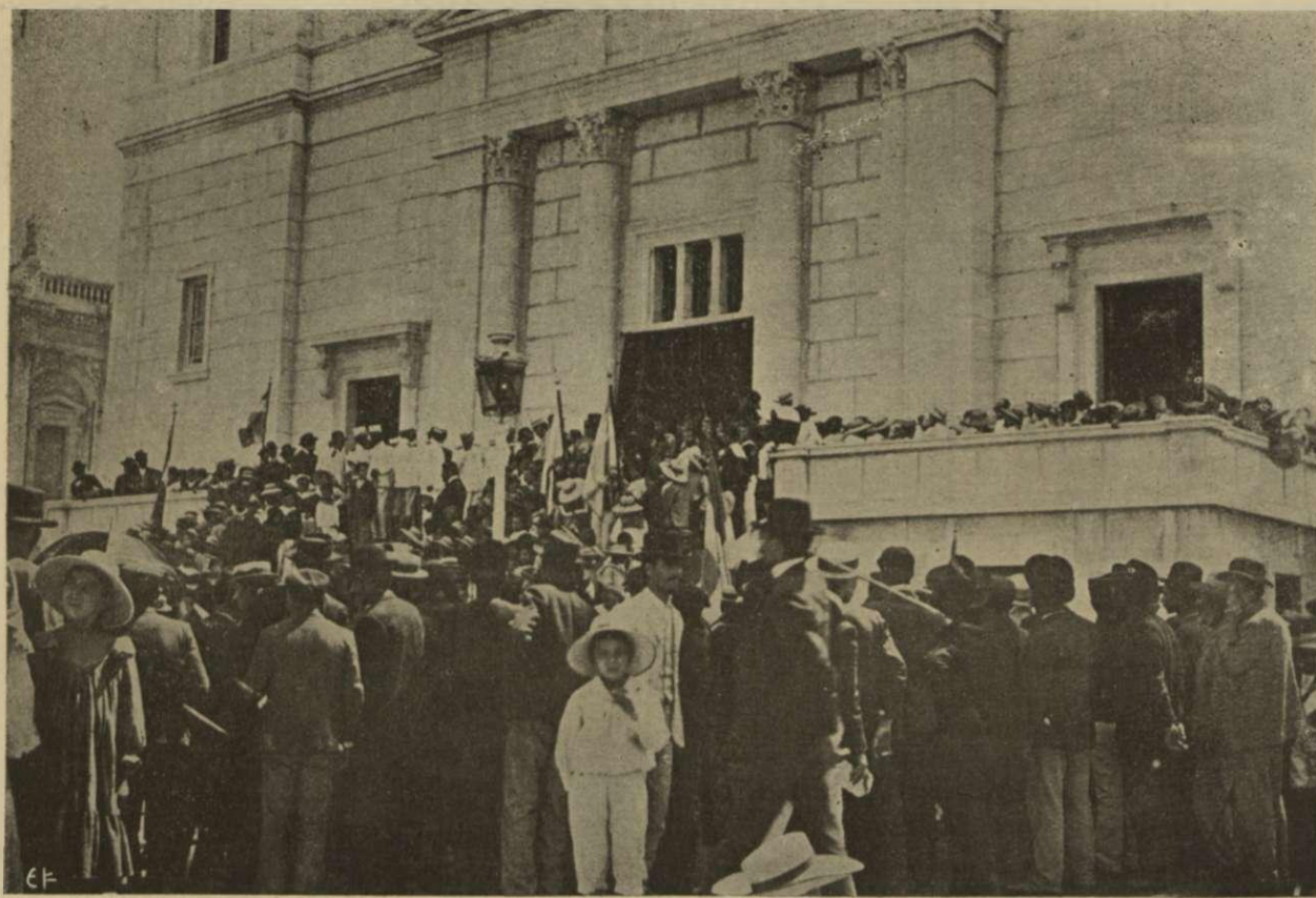
Οι μαθηταί των Σχολείων έξωθεν του Ναού του Αγίου Κωνσταντίνου ὀλίγον μετὰ τὸ μνημόσυνον.

Κι' ἡ χάρι πάλι τοῦ Θεοῦ Θὰ μὲ φωτίσῃ τότες Λαμπρόφωτον σὰν τὲς παλιῆς Κι' ἀξέχαστες ἡμέρες.