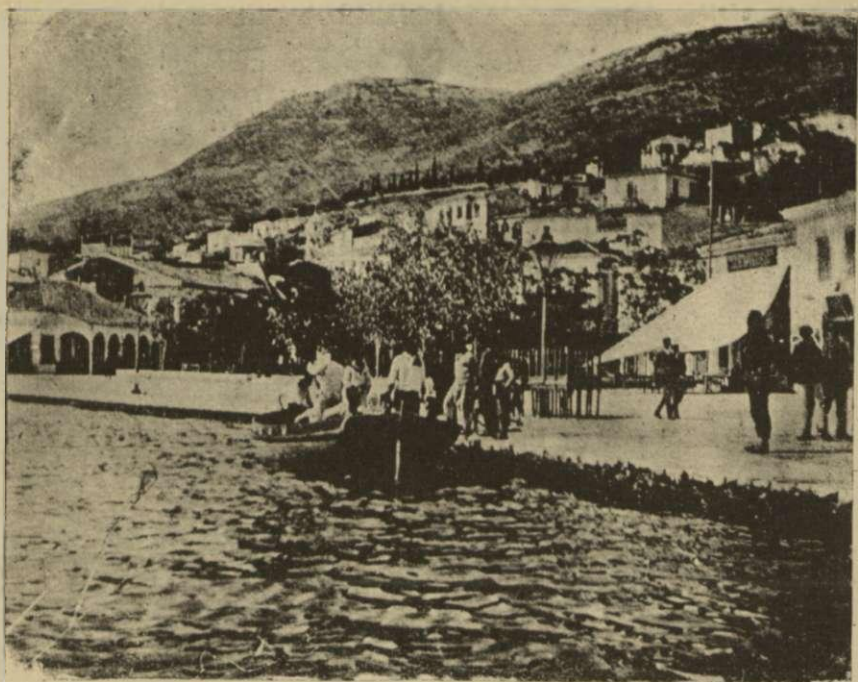
Ἡ τουρκοκρατία ἐν Σάμῳ. Νυκτὶ τοῦ «Ἀβδούλ Χαμίτ» τοποθετοῦν τὴν τουρκικὴν σημαίαν ἐπὶ τοῦ Σαμιακοῦ ἐδάφους παρὰ τὸ ἡγεμονικὸν μέγαρον.