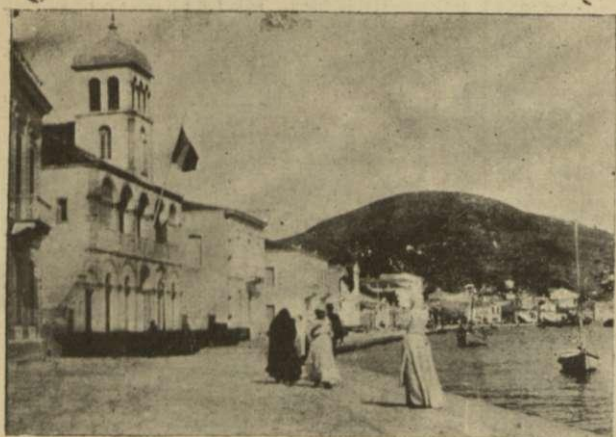
Τὸ κτίριον μετὰ τὴν σημαίαν εἶνε ἡ Γαλλικὴ Μονὴ εἰς τὸ ὁποῖον κατέφυγον 600 γυναῖκες αἰσ τὴν ἡμέραν τῶν συμπλοκῶν. Οἱ δὲ διαβάται τῆς ἐρημικῆς ὁδοῦ οἱ πρῶτοι Σάμιοι οἱ ὅποιοι διενθύνονται εἰς τὸ ἡγεμονικὸν μέγαρον μετὰ τὰς περὶ ἀσφαλείας προκηρῦξεις τοῦ Κοπάση.