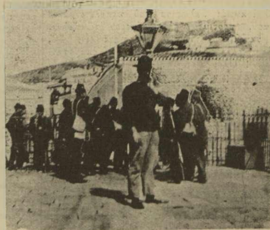
Τούρκοι στρατιῶται ἀπάγοντες εἰς τὰς φυλακὰς συλληφθέντας Σαμίους.