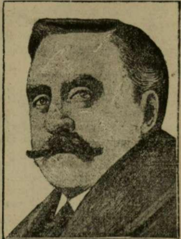
Ο ΜΗΧΑΝΙΚΟΣ ΟΥΑ-Ι-Τ Ὁ φονευθεὶς ὑπὸ τοῦ Θάου ἐραστής