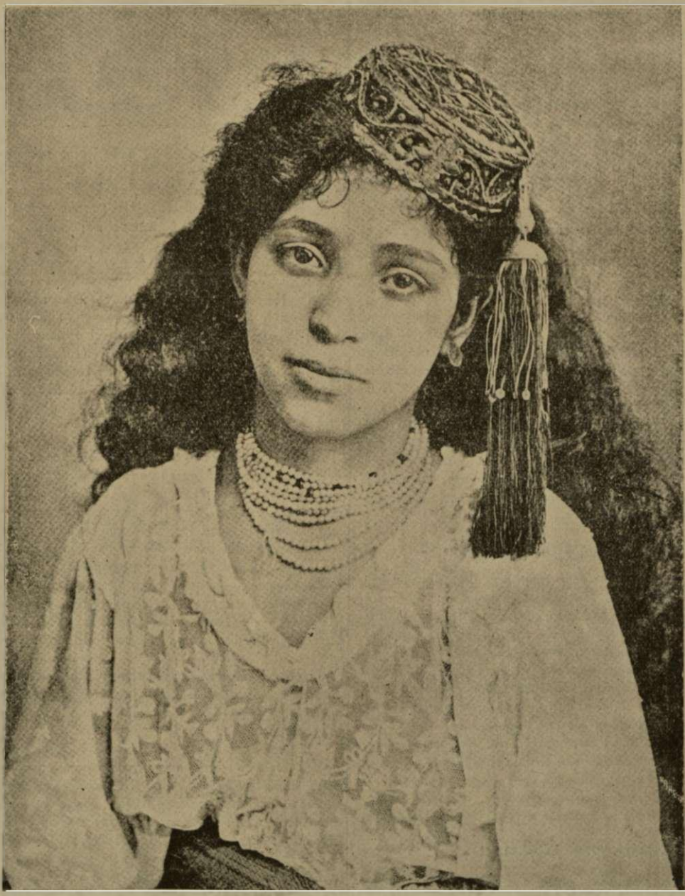
ΩΡΑΙΑ ΚΟΡΗ ΤΗΣ ΤΑΓΓΕΡΗΣ (παράλιον πόλεως του Μαρόκου).

(Έκ του Έθνικου Γεωγραφικου Δελτίου τής Άμερικης).