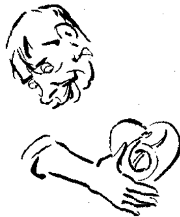
Ἐγὼ ἔχω μέσα στὴν καρδιά ὄχι τὸ πῦρ ἀλλὰ τὸν θάνατον. Μοῦ κάμνωσ ἡ ἀγάπη μου καὶ δὲν μεταξ' ἔγινε.