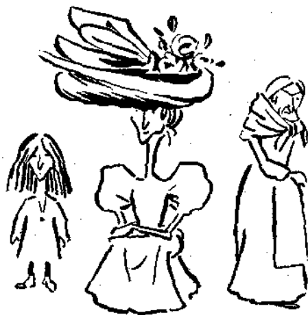
Μικρὴ μικρὴ σ' ἀγάπησα, μεγάλη δὲν σ' ἐπῆρα, ὅμως σ' ἀρθῆ ἕνας καιρὸς, καὶ θὰ σὲ πάρω χέρα.