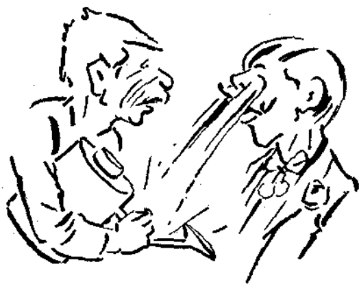
"Όλα τὰ μάτια εἶπε στεγνά καὶ τὰ δικά μου βροχή Περιβόλαρης τὰ ζητεῖ, τὰ δέντρα νὰ ποτίσῃ.