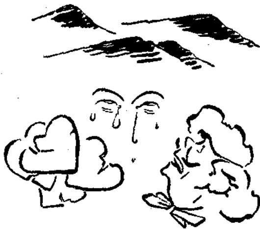
"Όταν ἀναστενάξω γὰρ, βουνῶν κορφὲς μαυρίζουν Σκληρὲς καρδιὲς χαρίζονται, μάτια γλαρὰ δακρυρίζουν.