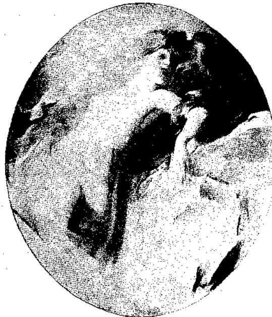
Ἀφύπνιστοις ὑπὸ Π. Μαθιοπούλου

Οἱ ἀσκηταὶ περνοῦσαν εὐχαρίστην ζωὴν. Πότε ἐκαλλιέργουν τὴν γῆν καὶ πότε ἐβυθίζοντο εἰς μελέτας εὐλαβεῖς. Μερικὲς ἀγριεὲς ρίζες καὶ μερικοὶ χουρμάδες ἤρχον διὰ τὴν τροφήν των. Διὰ νὰ ποτίσῃ τὸν μικρὸν του κήπον ποῦ ἦτο δόλωμαυρα ἀπὸ τὴν καλύβαν του ὁ Ἰλαρίων ἔφερε τὸ νερὸ ἀπὸ τὸ ρυάκι ποῦ ἐκείνουζεν ὀλίγον μακρύτερα ἀπὸ τὸ κελί του μέσα ἔς τὸ χλοεράτερον μέρος τῆς δάσεως. Λεπτότατα ὀλογάλανα λουλούδια ἐστόλιζαν τὴν ὄχθην τοῦ ρυακίου καὶ ἐπλημμυροῦσαν τὸν ἀέρα ἀπὸ εὐωδίας. Ἀπὸ τοὺς καλαμιῶνας τοῦ ρυακίου ἀνεδίδετο μία γλυκυτάτη μουσική. Ἐπειτα ὁ εὐθυμος θόρυβος τῶν στροβιλιζόμενων πιδάκων ποῦ ἀνελύοντο εἰς χονδρὰς σταγόνας ἐπάνω εἰς τὴν ὑγρὰν χλόην. Πῶ κατὰ τὰ κινούμενα μαργαριτάρια ἐπάνω ἔς τὰ πλατεὰ φύλλα τῶν νουφάρων ἔδελγον τὸ βλέμμα. Ἄλλοῦ πάλιν ὅπου ἡ κοίτη ἦτο βαθύτερα, τὸ νερὸ κάτω ἀπὸ τοὺς ἡμιγύρτους κλάδους τῶν δένδρων ἐλάμβανε μίαν μελανὴν διαφάνειαν ποῦ ὁμοίαζε μὲ βλέμμα ἀνθρώπινον. Ὁ Ἰλαρίων τότε ἡσθάνετο κάποιαν ταραχὴν ἐνώπιον τῆς οικειότητος αὐτοῦ τοῦ βλέμματος καὶ ἀπεμακρύνετο πολλὰς φορές χωρὶς νὰ ἔχη τὴν τὸλ-