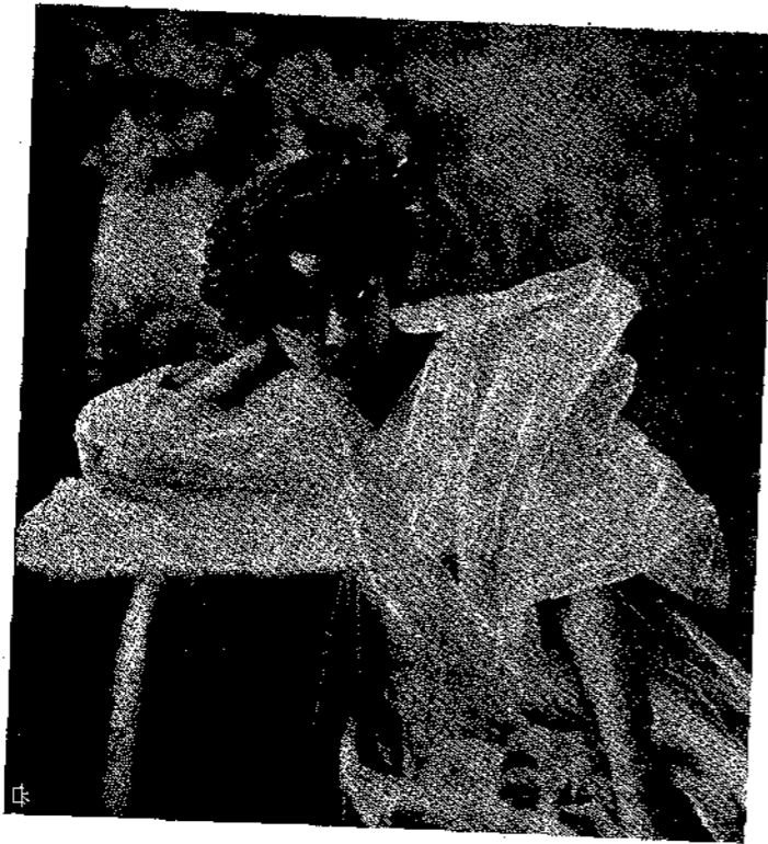
Η ΠΡΙΓΚΗΠΙΣΣΑ ΜΑΡΙΑ ΒΟΝΑΠΑΡΤΗ

στη εἰς τὸν Ἄλφα κλονισμὸς ἐσωτερικὸς ἐνσυνείδητος. Ἡ ἀπευθυνθεῖσα ἐκκλησία δὲν ἔγινε δεκτὴ. Δὲν τὴν ἔκαμεν ἰδικήν του. Τὸ ἐγὼ του δὲν προσανατολίζεται πρὸς νέαν ζωὴν.