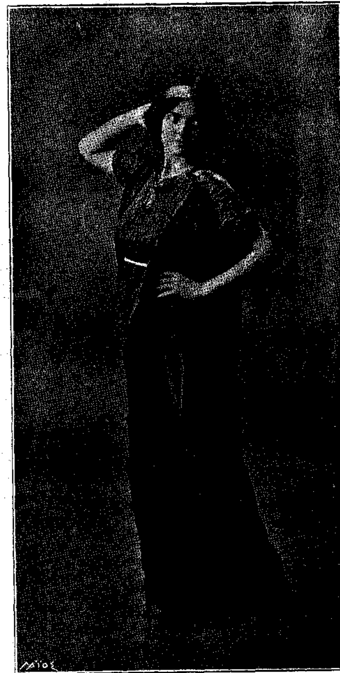
ΝΕΑ ΕΛΛΗΝΙΣ ΜΕ ΑΡΧΑΙΟΝ ΕΝΔΥΜΑ

Πρώτησα τὴν Ζουστίν καὶ αὐτὴ ἔκαμε τὶς ἴδιες μαιμουδιὲς γιὰ νὰ μοῦ πῆ πὼς ἔλεγαν πολλὰ κακὰ γιὰ τὴν Κολέττα, καὶ πὼς ἕνα μικρὸ κορί-