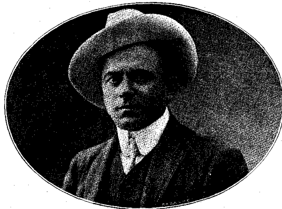
ΚΩΝΣΤΑΝΤΙΝΟΣ ΣΑΓΙΩΦ Ο ΑΠΟΣΘΑΝΩΝ ΚΩΜΙΚΟΣ