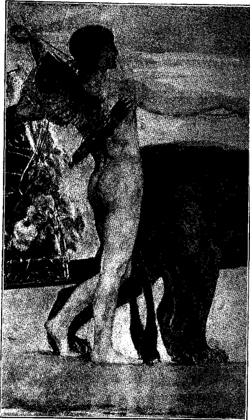
Η ΑΠΟΦΕΣΙΣ ΤΗΣ ΒΑΥΑΡΙΑΣ — ΑΠΟΣΠΑΣΜΑ