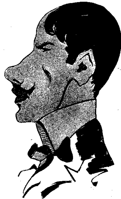
Ειδώλια — Γ. Ροιλῶ; υπό Θ. Θωμοπούλου