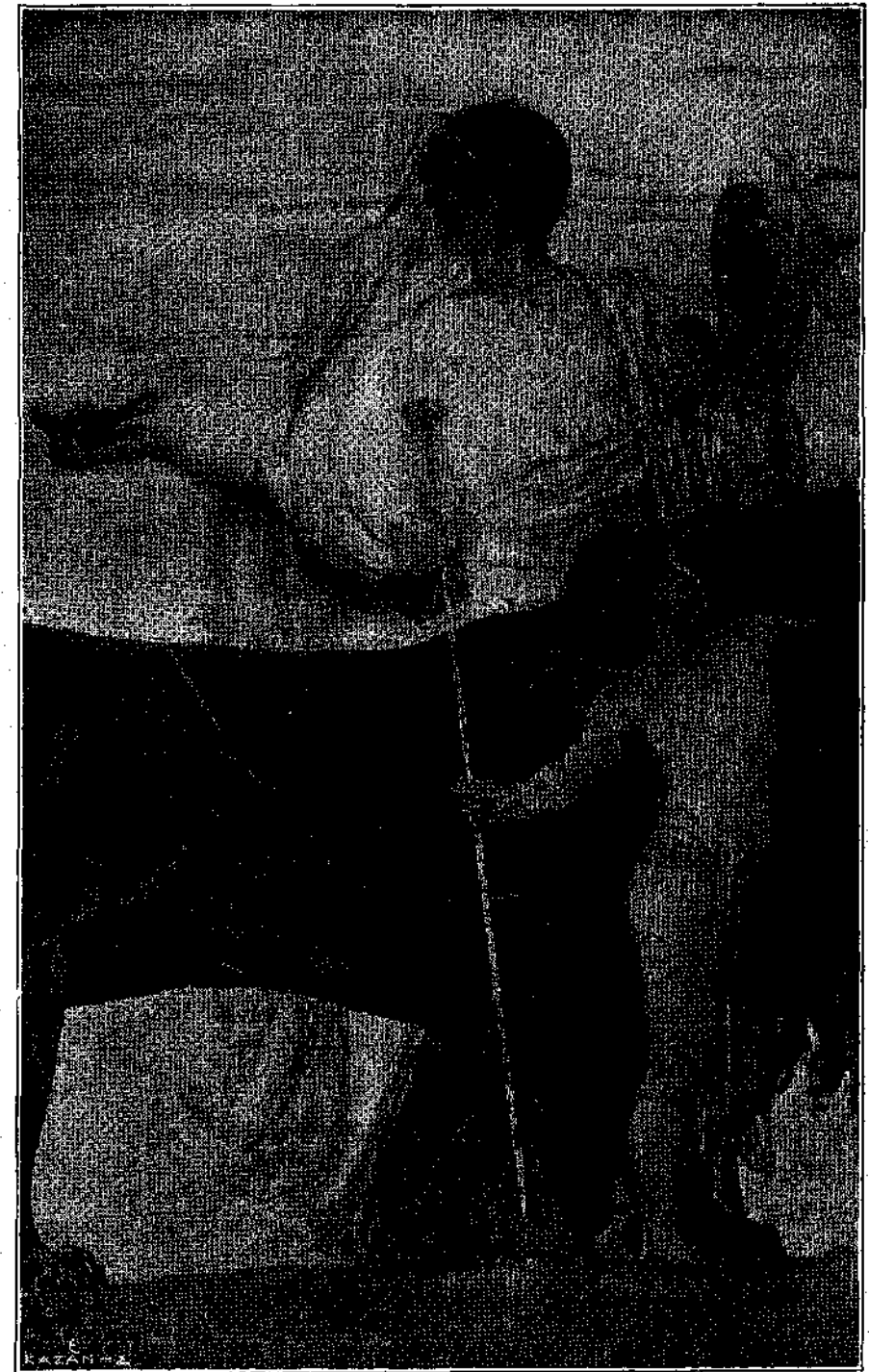
Η ΑΠΟΦΕΣΙΣ ΤΗΣ ΒΑΥΑΡΙΑΣ — ΑΠΟΣΠΑΣΜΑ