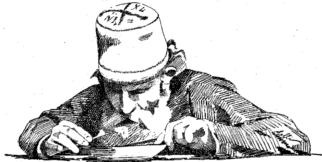
ΣΠΟΥΑΝ Θ. ΡΑΛΛΗ

και κεί τα ζωντανά λουλούδια, οί πεταλούδες, τρέχανε χαρωπές κινώντας τα μεγάλα φτερά τους, τα πολύχρωμα, πάνω άπ' τα άγρια λουλούδια, που σήκωναν την άνθισμένη τους κορυφή σαν κορίτσια στολισμένα.