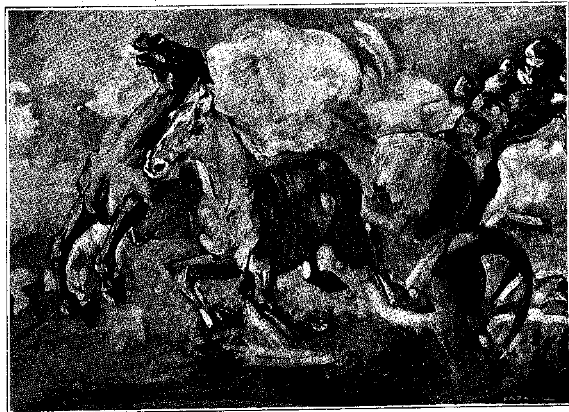
ΣΠΟΥΔΗ Γ. ΡΟΪΛΟΥ

Εἶμαστε μερικά κορίτσια που μās είχε μεγάλη