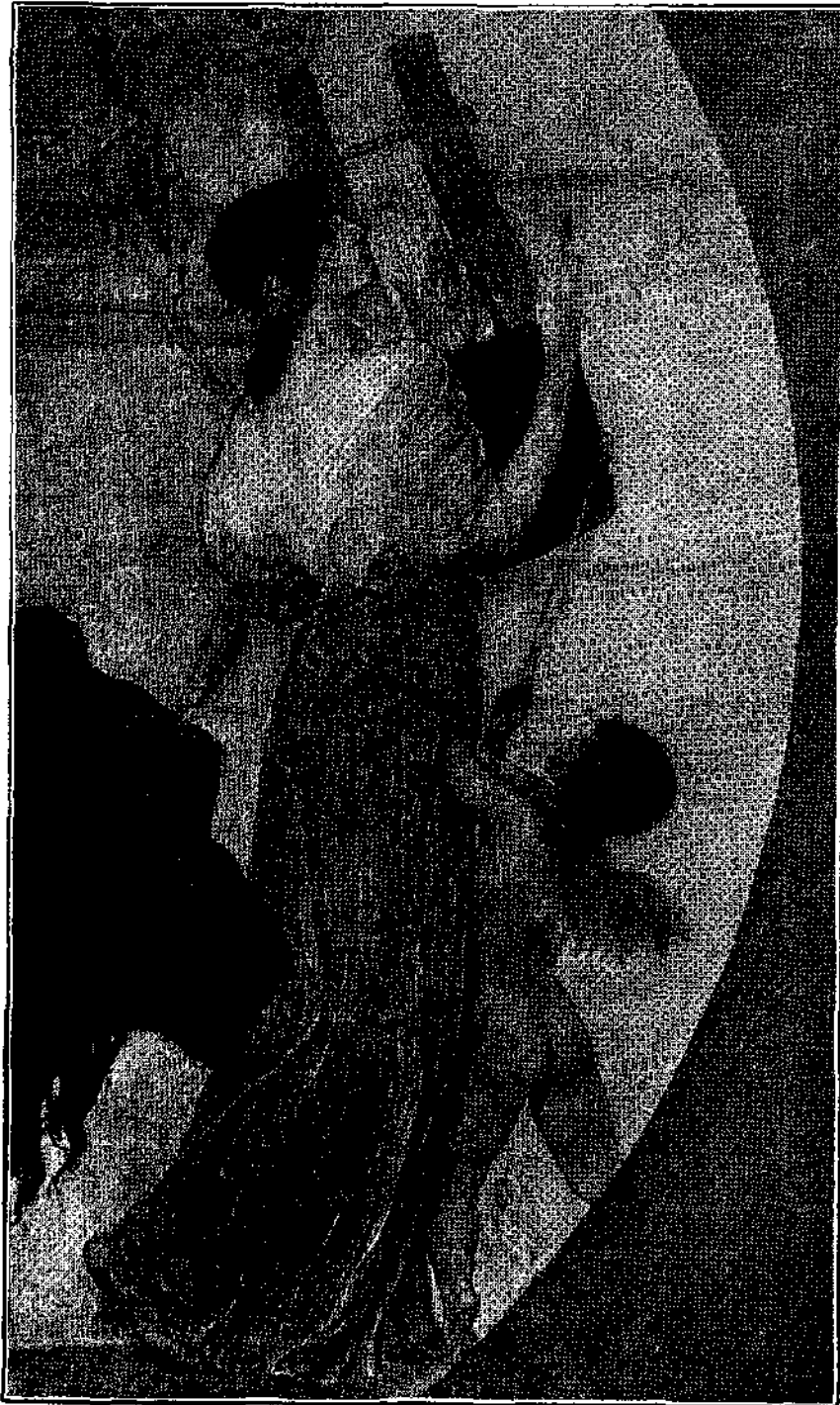
Η ΑΠΟΘΕΩΣΙΣ ΤΗΣ ΒΑΥΑΡΙΑΣ — ΑΠΟΣΠΑΣΜΑ