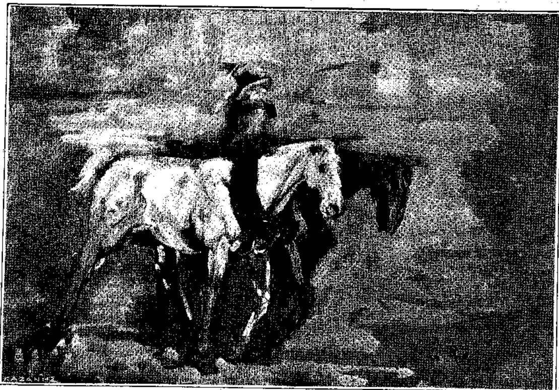
ΣΠΟΥΔΗ Γ. ΡΟΪΛΟΥ

ένα βιβλιαράκι που δίπλα στις λέξεις είχε ζωγραφιές. Έκνταξα συχνά μια φράουλα και την φανταζόμουν μεγάλη σαν τσουρέκι.