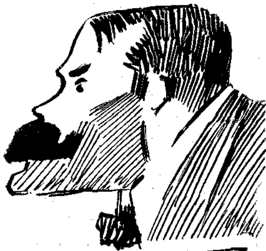
Ειδώλια — Π. Μαστόπουλος υπό Κ. Παρθένου