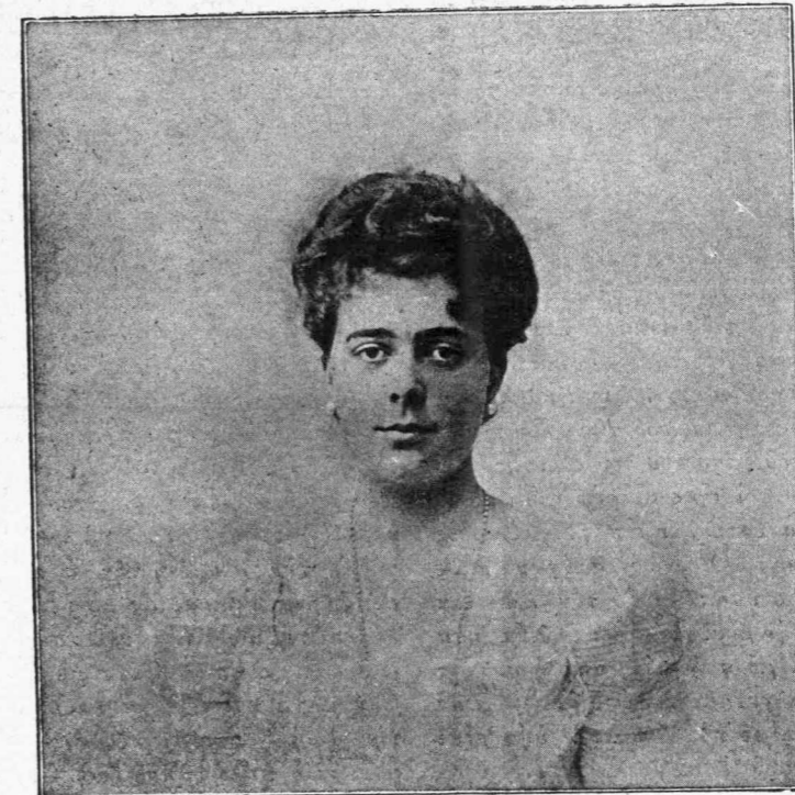
Η ΠΡΙΓΚΗΠΙΣΣΑ ΕΛΕΝΗ Πρόεδρος τῆς Βασιλικῆς Σχολῆς τῶν Ἐργοχείρων