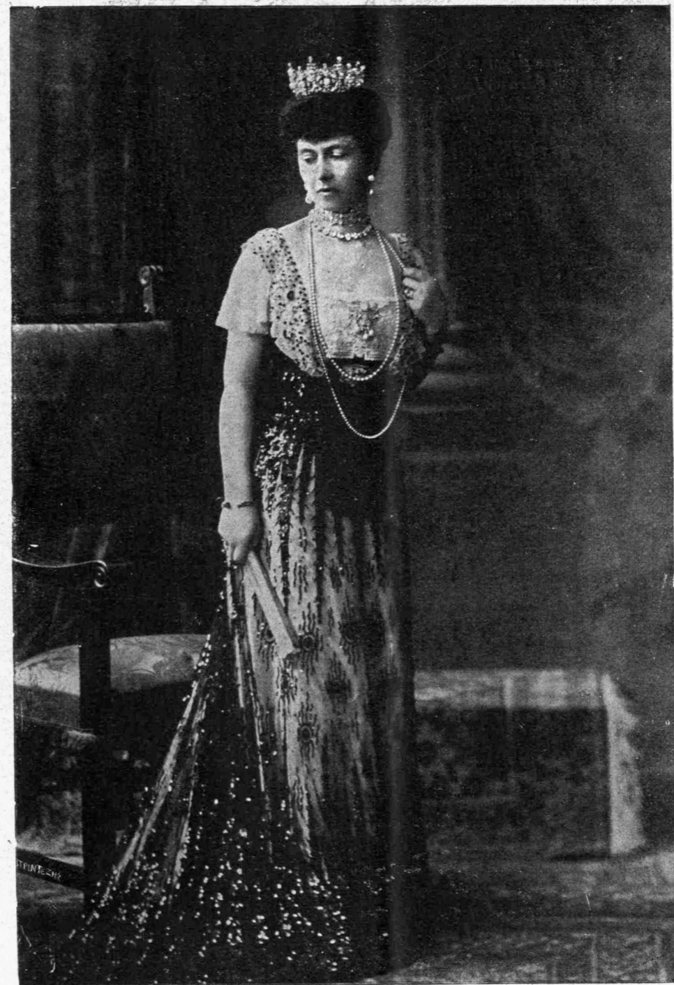
Η Α. Β. ΥΨΗΛΟΤΗΣ Η ΠΡΙΓΚΗΠΙΣΣΑ ΣΟΦΙΑ

Πρόεδρος τοῦ Οἰκονομικοῦ Συσσιτίου, τοῦ Νοσοκομείου τῶν Παίδων, Ἀντιπρόεδρος τῆς Ἐνώσεως τῶν Ἑλληνίδων καὶ Υ. Προστάτις πολλῶν ἑλλην. σωματείων