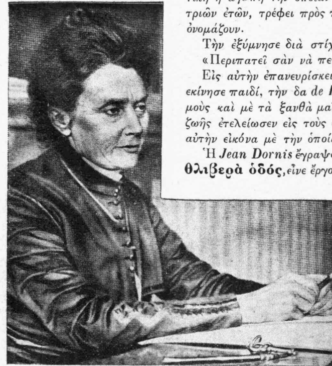
Ἡ ΠΡΩΤΗ ΝΟΡΒΗΓΙΣ ΒΟΥΛΕΥΤΗΣ

Λοιπὸν ἡ Γιλβέρτη ὑπανδρεύθη τὸν Βίκτορα Νταρσέν, φιλόδοξον, ἀψησχολημένον μὲ τὰς ἐργασίας του, ἐγωῖστὴν, εἰρῶνα καὶ ἀρκετὰ βιά-