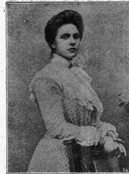
Η ΠΡΙΓΚΗΠΙΣΣΑ ΑΛΙΚΗ Πρόεδρος τῶν Σταθμῶν τῶν Α' Βοηθειῶν

Ἀλλὰ καὶ εἰς τὸ ἔξωτερικόν αἱ Ἑλληνίδες μας κυρίαὶ τοῦ κόσμου ἤρχισαν νὰ ἀναδεικνύονται εἰς δρᾶσιν ὠραίας ὑπὸ τὴν προεδρίαν τῆς κ. Βιργινίας Μπενάκη ἰδρύθη εἰς Ἀλεξάνδρειαν προστατευτικὴ ὑπὲρ τῶν Ἑλληνίδων εἰσαγγεῖα. Εἰς τὰ γραφεῖα τοῦ Διεθνoῦς Συνδέσμου τῆς France, διωργανώθη ἡμέρα τοῦ Ἑλλ. Τμήματος καθ' ἣν ὠμίλησεν ἡ Πρόεδρος κ. Ἀμαλία Δηλιγιάννη, σύζυγος τοῦ Πρεσβευτοῦ τῆς Ἑλλάδος κ. Ν. Δηληγιάννη, ἀπαντῶσα εἰς προσφώνησιν τῆς κ. Misme, ὠμίλησε δὲ ἐν ἐκτάσει περὶ τῆς