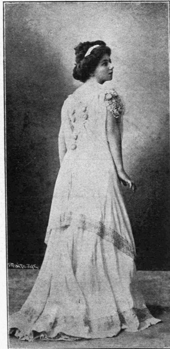
Δις ΜΑΡΙΚΑ ΚΟΤΟΠΟΥΛΗ