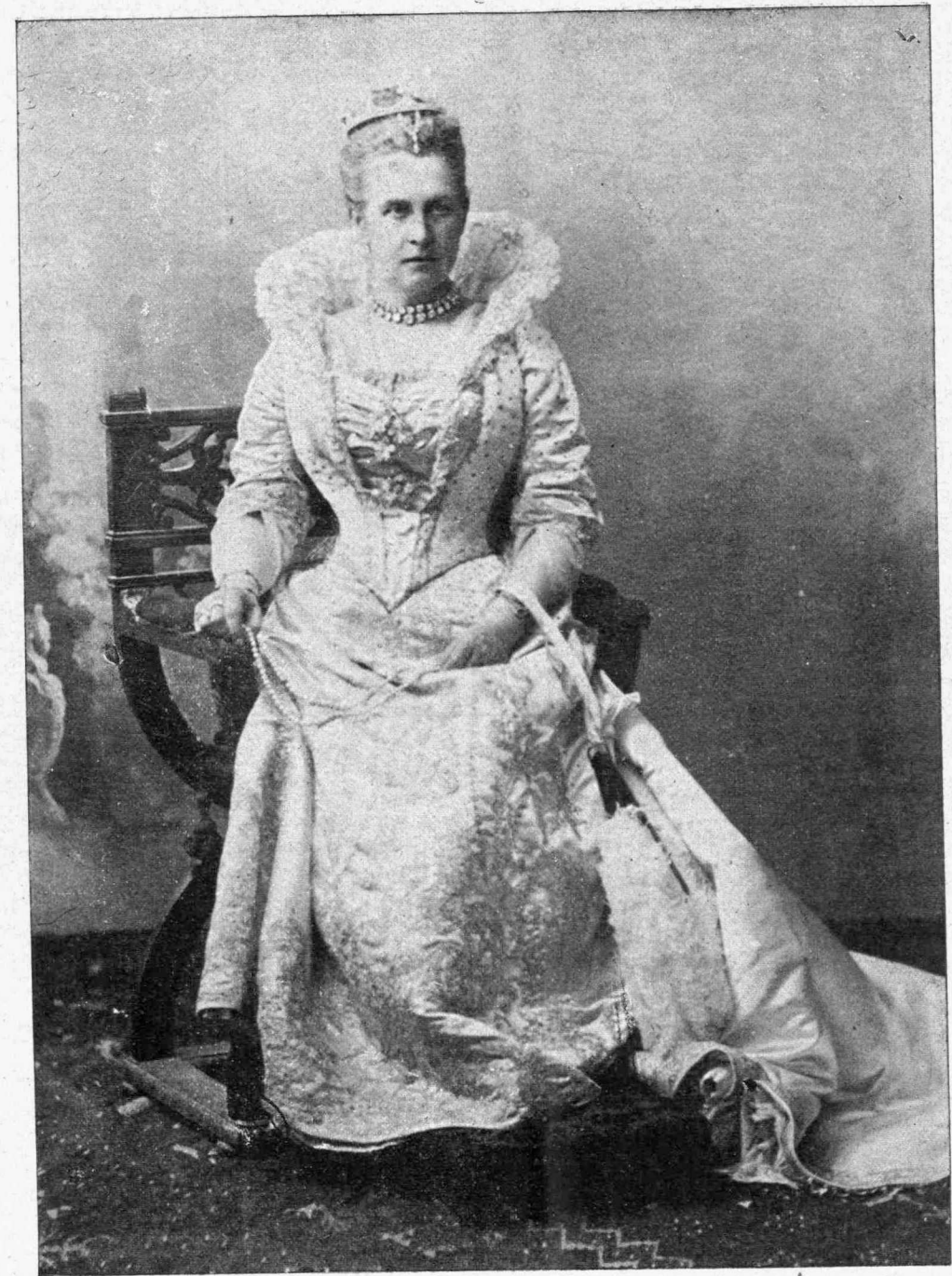
H. A. M. H. ΒΑΣΙΛΙΣΣΑ

Λείπουν καὶ ἄλλαι ἀκόμη εἴτε εἰς τὴν κυρίως φιλανθρωπίαν, εἴτε εἰς τὰς ἐπιστήμας, τὰς τέχνας καὶ τὰ γράμματα, τὰς ὁποίας θὰ γνωρίσωμεν εἰς τὰς ἀναγνωστρίας μας εἰς Β' πανηγυρικὸν τεῦχος, τὸ ὁποῖον προσεχῶς θὰ δημοσιευθῇ.