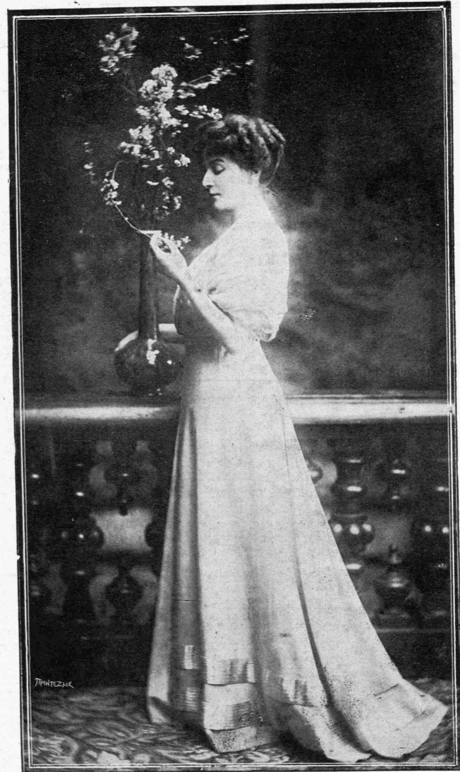
Η Α. Β. ΥΨΗΛΟΤΗΣ Η ΠΡΙΓΚΗΠΙΣΣΑ ΜΑΡΙΑ Πρόεδρος τοῦ Σχολείου τῶν Τυφλῶν καὶ ἐπίτιμος Προστάτις διαφόρων Ἑλληνικῶν σωματείων

Ἐσιώπησαν καὶ ἐγονάτισαν περὶ τὸ πάντοτε εὐτυχοῦντος παιδίου. Ἀπὸ τὸ ἀνοικτὸν κιβώτιον ἰσχυρὰ ἀρώματα ἐξεχύνοντο καὶ ἐπλήρουν τὴν ἀέραντον αἴθουσαν, ἐνῶ πυκνὸν νέφος ἀργυροῦν περιετύλιξεν ὅλα τὰ πράγματα καὶ τὰ κατέστησε δυσδιάκριτα. Ὅταν τὸ νέφος διελύθη οἱ τρεῖς Μάγοι μετὰ τοῦ πτηνοῦ εἶχαν ἐπαναλάβει τὰς ἐπὶ τῆς τοιχογραφίας θέσεις