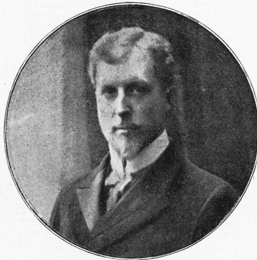
Ο ΝΕΟΣ ΒΑΣΙΛΕΥΣ ΤΟΥ ΒΕΛΓΙΟΥ ΑΛΒΕΡΤΟΣ

Πολλὰ μικρὰ λαμβάνουσι κακὸν δρόμον· ὄχι διότι κακῶς ἀνετρέφθησαν ἢ κακὸν εἶχαν παράδειγμα, ἀλλὰ διότι ἔστερήθησαν ἀπὸ τῆς μικρᾶς τῶν ἡλικίας πᾶσαν ἀκτίνα ἡθικοῦ ἡλίου. Τὸ παιδί ἔχει ἀνάγκην γέλωτος καὶ μειδιημάτων, ὡς τὸ ἄνθος ἔχει ἀνάγκην θερμότητος καὶ φωτός. Τὰ παιδιὰ δὲν βλέπουσι ποτὲ τὸ κα-