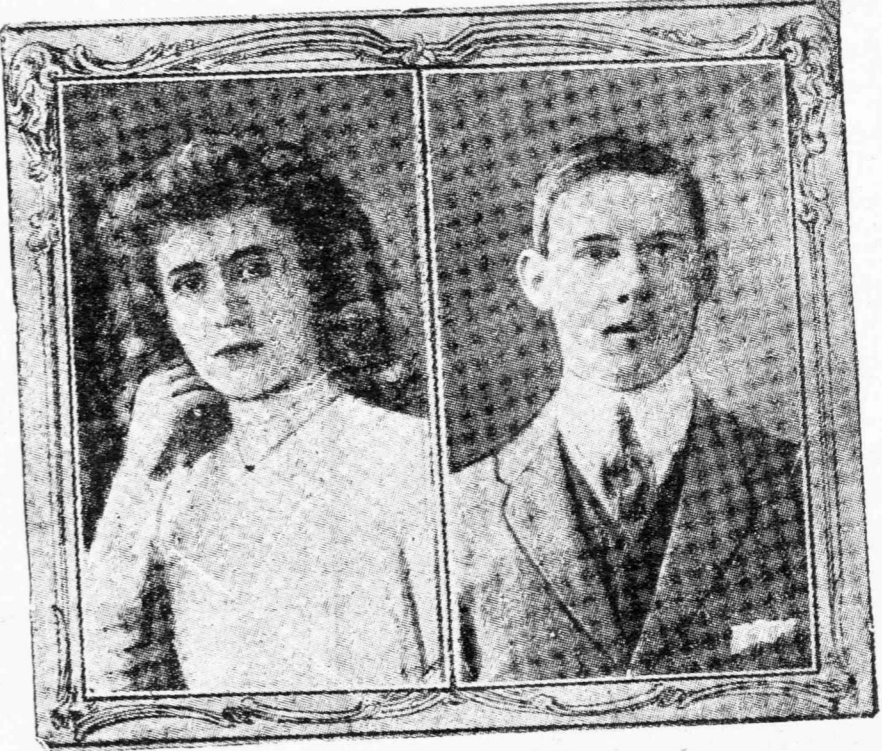
Ἡ πριγκίπισσα Ἀλεξάνδρα τῆς Ἀγγλίας

Ἀπὸ τὸ Πέργαμο ἐμαζεύθησαν καὶ τοὺς κυττάζουν μὲ ταρχῆν κι' ἐκπληξιν. Στέκονται ἀπέναντι αὐτῶν τῶν ὠχρῶν κόκκινα, σπαθισμένα πρόσωπα. Ἄδρανεῖς ἀπὸ ἀκολασίας κατακουρασμένες ματιές πέφτουν ἐμπρὸς εἰς τὰ ὄξεα αὐτὰ τὰ σπιθηροβόλα μάτια. Βλασφημίαι κατὰ τοῦ Θεοῦ ἐμπαικτικαὶ μένουσν μὲ ἀνοικτὸ τὸ στόμα ἀπέναντι εἰς αὐτοὺς τοὺς ὕμνουσ.