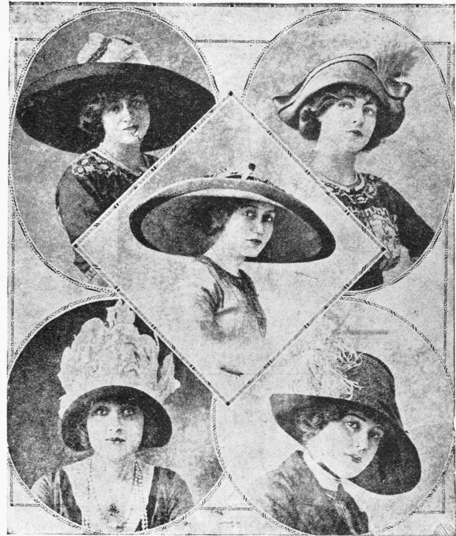
Ἡ ΤΕΛΕΥΤΑΙΑ ΜΟΔΑ ΤΩΝ ΚΑΠΕΛΩΝ