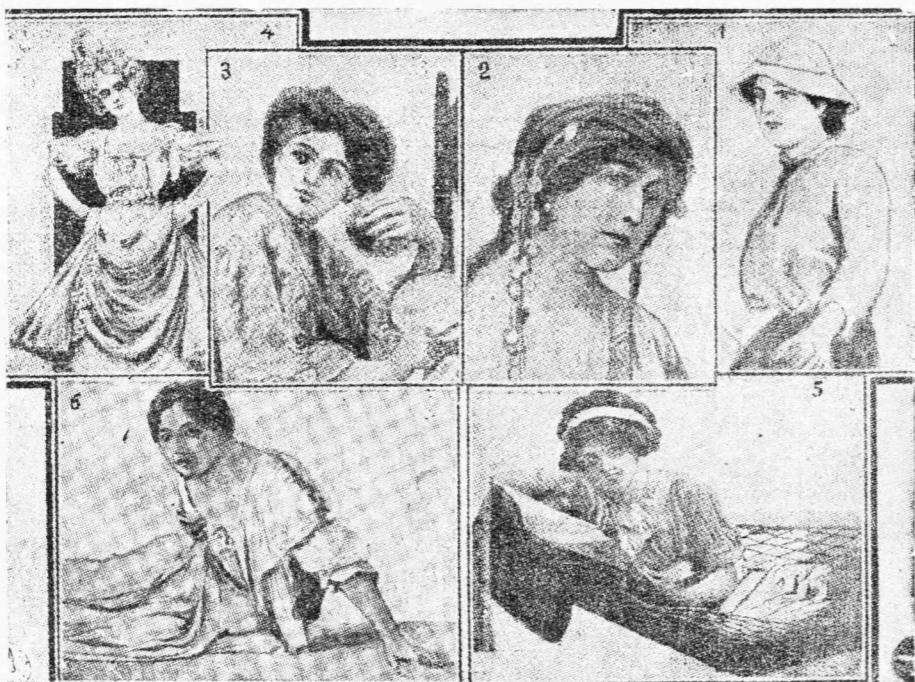
Ἐκατομμυριοῦχοι νύμφαι Ἀμερικανίδες.