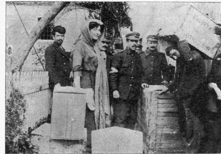
Ἡ ΠΡΙΓΚΗΠΙΣΣΑ ΜΑΡΙΑ ΜΕΤΑ ΤΩΝ ΝΟΣΟΚΟΜΩΝ ΤΗΣ

Καί ὅταν ἀκριβῶς διὰ νά ἡσυχάσω ἀπὸ τὴν πυρετώδη αὐτὴν ζωὴν, διὰ νά ξεκουρασθῶ ἀπὸ μίαν ὑπερκόπωσιν ἀνησυχητικὴν, ἀπε-