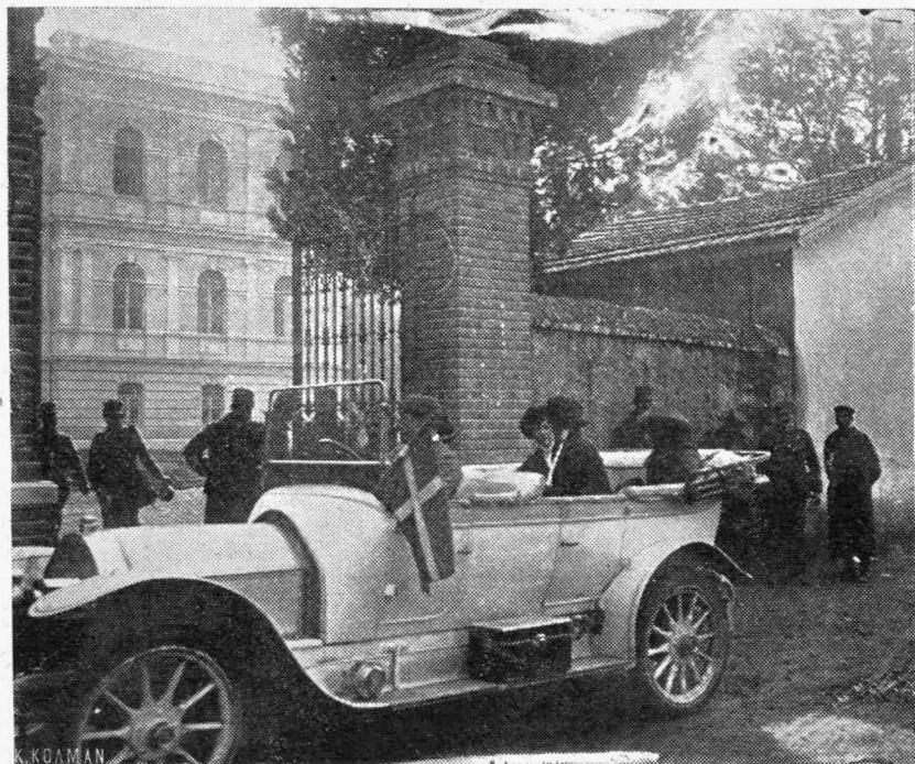
Η ΠΡΙΓΚΗΠΙΣΣΑ ΑΛΙΚΗ ΕΠΙΣΚΕΠΤΟΜΕΝΗ ΤΑ ΝΟΣΟΚΟΜΕΙΑ

Θέλω και τους φαντάζομαι, του Γιάννη τους γεννήτορας, υπερηφάνους και γενναίους, εις την ανήκεστον θλίψιν. Λέοντα δέν ἐγέννησε ποτέ τῶν λαγῶν, τὸ χαμπερές πλήθος!