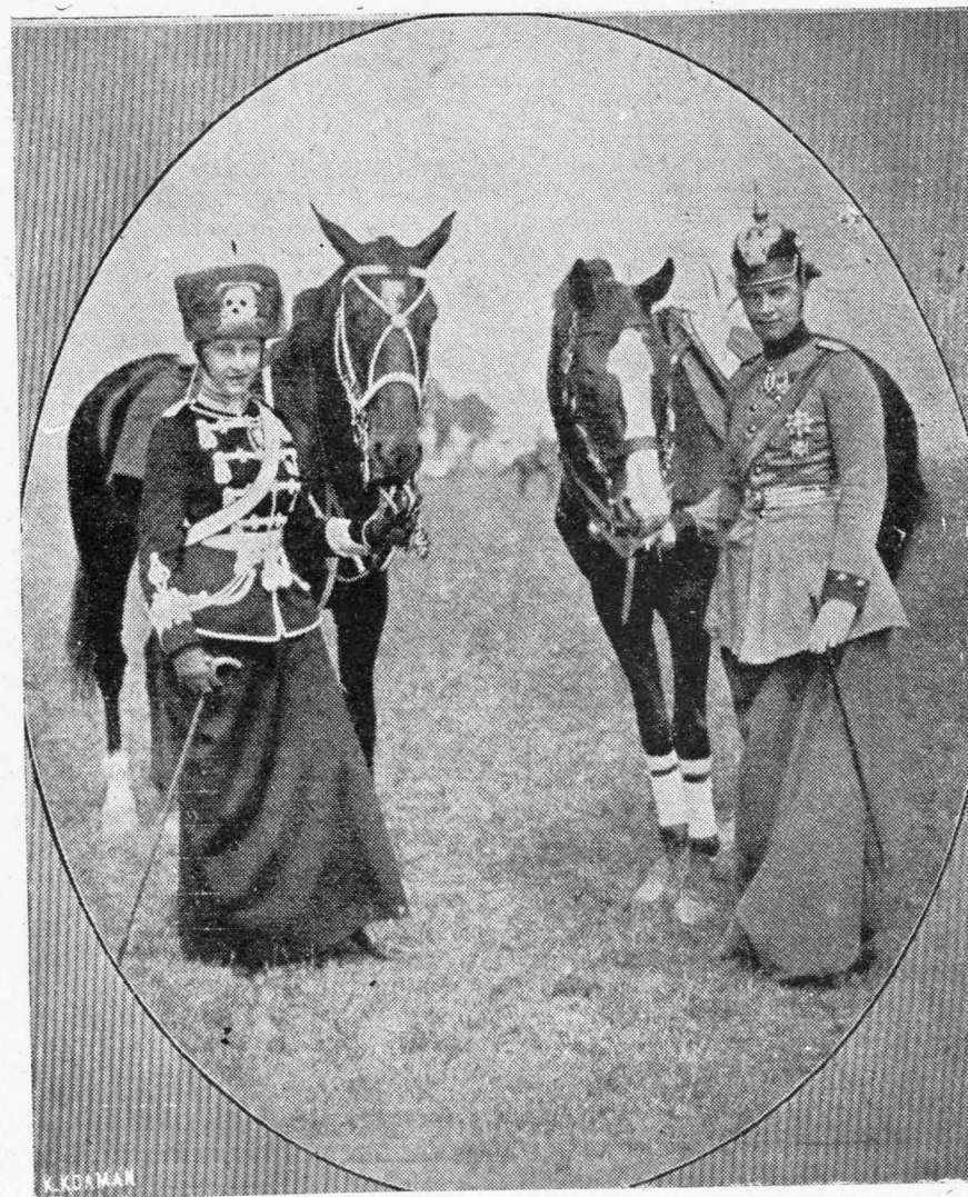
Η ΚΟΡΗ ΚΑΙ Η ΝΥΜΦΗ ΤΟΥ ΚΑΪ-ΖΕΡ

Δι' ἡμᾶς ἡ Σαρακοστὴ, ἡμέραι ἀγωνίας καὶ