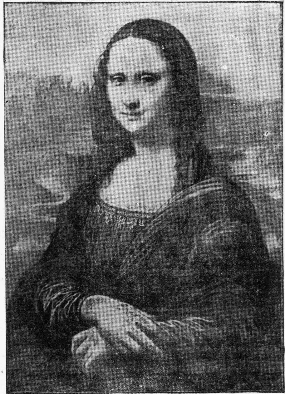
Ἡ ΕΠΑΝΕΥΡΕΘΕΙΣΑ ΤΖΙΟΚΟΝΤΑ

Τὰ Χανιά ἐώρταζον παλληκαρίσια ὅπως καὶ ἠγωνίζοντο οἱ λέοντες τῆς Κρήτης.