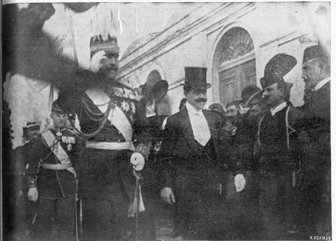
Ο ΒΑΣΙΛΕΥΣ ΜΕΤΑ ΤΟΥ ΔΙΑΔΟΧΟΥ ΚΑΙ ΤΩΝ ΕΠΙΣΗΜΩΝ ΚΑΤΑ ΤΗΝ ΥΨΩΣΙΝ ΤΗΣ ΣΗΜΑΙΑΣ