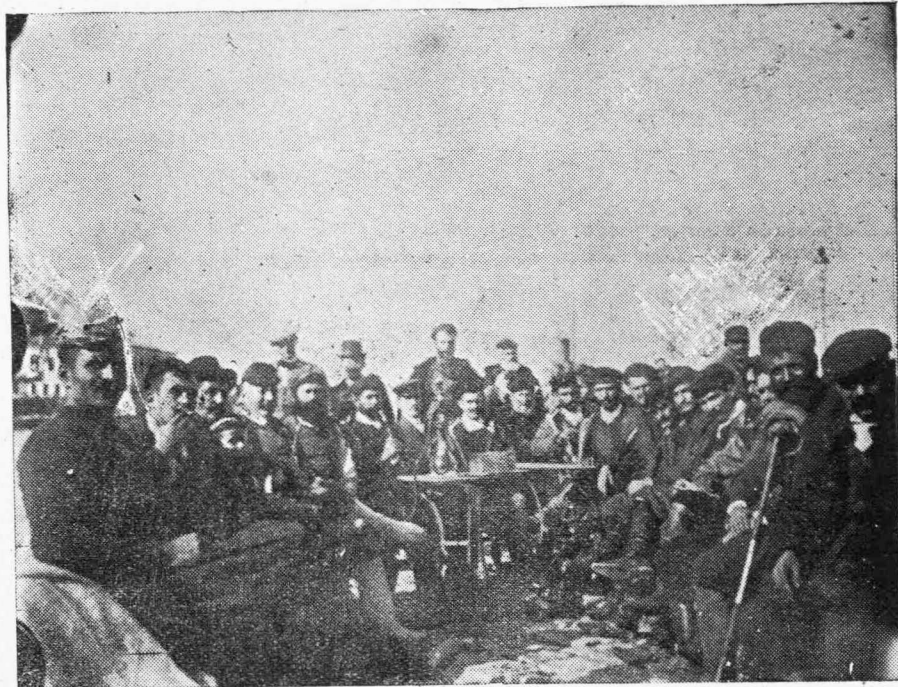
ΣΥΜΠΛΕΓΜΑ ΗΡΩΩΝ ΚΡΗΤΩΝ