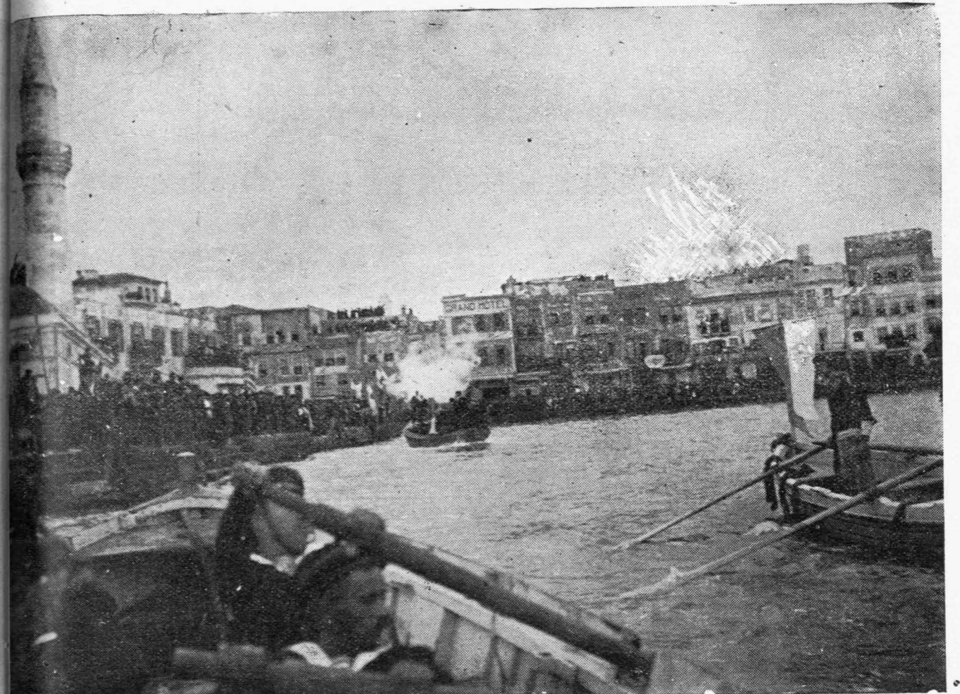
Η ΑΠΟΒΑΘΡΑ ΤΩΝ ΧΑΝΙΩΝ

τριημέρου θυέλλης, ἐπηρεπίσθη τὸ κατὰ δύναμιν. Μυροστολισμένη ἐπίσης εἶναι καὶ ἡ ἑπαλξίς τοῦ Φιοκά.