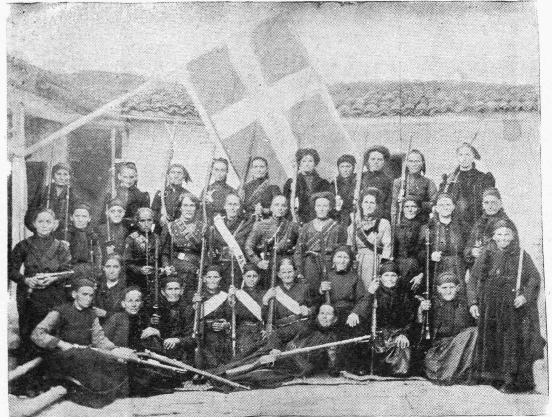
Ὁ ἱερός λόχος τῶν γυναικῶν τῆς Κορινθίας.