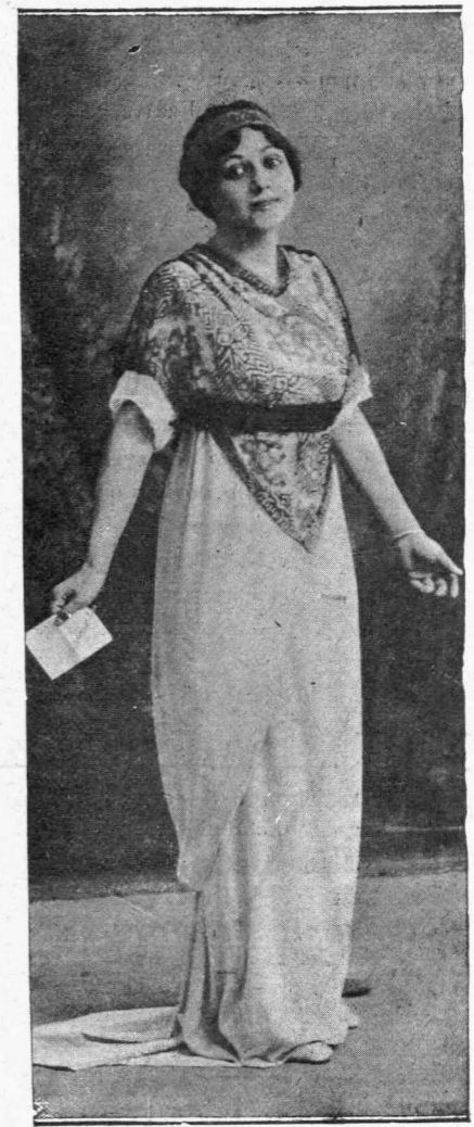
Εις Μαρίκα Κοτοπούλη

Η ευεργετική της Κυβέλης υπήρξεν άληθινός θρίαμβος. Τα τέσσαρα μονόπρακτα έπαρουσίασαν