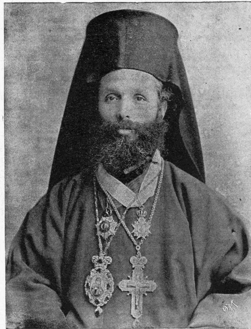
Ο ΣΕΒ. ΜΗΤΡΟΠΟΛΙΤΗΣ ΚΟΡΥΤΣΩΣ