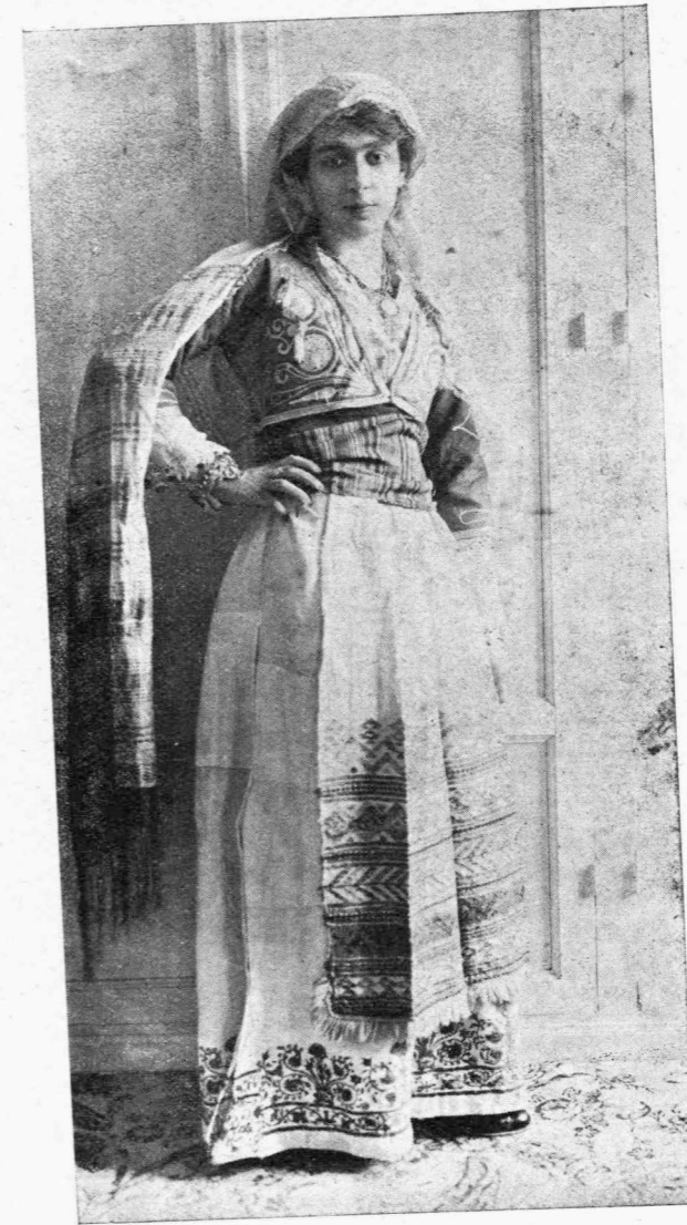
Ἡ Δις ΚΑΚΙΑ ΟΡΛΩΦ

Τὸ καλλιτεχνικὸν μὲς τμήμα μετὰ πρωτεύοντα τὴν κ. καὶ τὸν κ. Γεωργαντζῆ, ἤμποροῦν νὰ εἶναι ὑπερήφανοι διὰ τὸ ἐπιτευχθῆν ἀποτέ-