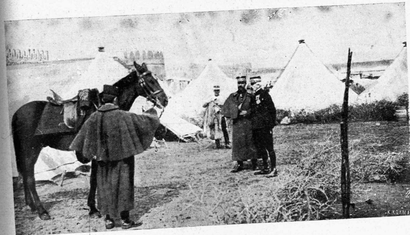
ΤΟ ΓΑΛΛΙΚΟΝ ΣΤΡΑΤΟΠΕΔΟΝ ΠΑΡΑ ΤΟ ΑΡΓΚΟΝ ΓΑΛΛΟΙ ΛΕΙΩΜΑΤΙΚΟΙ ΣΥΝΟΜΙΛΟΥΝ ΠΕΡΙ ΤΗΣ ΜΕΛΕΤΟΜΕΝΗΣ ΕΠΙΘΕΣΕΩΣ ΚΑΤΑ ΤΩΝ ΓΕΡΜΑΝΩΝ

Οὕτω λοιπὸν ὁ Καλομοίρης πρέπει νὰ ὀνομασθῇ ὁ Grieg τῆς Ἀνατολῆς. Ἔχει δὲ κάμει πλείστας ὅσας συνθέσεις καὶ ἄσματα. Ἐν ἀπὸ τὰ πλέον ὠραιότερα ἄσματά του εἶναι ἡ «Κατάρτα». Ἡ «Κατάρτα» εἶνε ἐν ἀριστοῦργημα, ἔχει ἐντελῶς τὸν Ἑλληνικὸν τύπον. εἶναι ἄσμα χαρακτηριστικώτατον, καὶ δραματικώτατον, ὅταν τὸ ἀκούητε σὰς συγκιεῖ, σὰς συνταράσσει, εἶναι δὲ κατὰ τὴν γνώμην μου, ὁ ἀδάμας τῶν συγχρόνων Ἑλληνικῶν ἀσμάτων. Ἐπίσης δὲ ὁ Καλομοίρης ἔχει συνθέσει συνθέσεις διὰ κλειδοκύμβαλον, δι' ὄρχηστραν, ἅπασαι δὲ αἱ συνθέσεις του ἔχουσι ἐντελῶς τὴν Ἑλληνικὴν χροιάν, μ' ἕνα λόγο εἰς τὰς συνθέσεις τοῦ Καλομοίρου ὀμιλεῖ καθαρὰ ἢ Ἑλληνικὴ ψυχὴ!