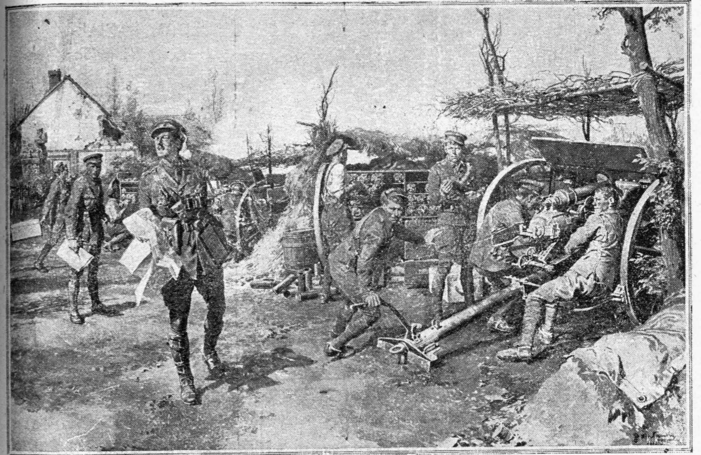
Εἰς τὰ Ἀγγλικά προχώματα ἔρχεται τηλεφωνικῶς διαταγὴ νὰ διευθυνθῇ τὸ πῦρ πρὸς ὀρισμένον σημεῖον. Ὁ ἀξιωματικὸς ἀφοῦ συμβουλευθῇ τὸν χάρτην τὴν ἐπαναλαμβάνει μεγαλοφῶνος εἰς τοὺς στρατιώτας.

Ἀλλὰ δὲν θὰ ἴσκει ὀλόκληρος ἡμέρα καὶ ὄχι τέταρτα διὰ νὰ ἐκτεθοῦν ὅλοι οἱ ἀγῶνες τῆς Ἐφημ. τῶν Κυριῶν πρὸς ἐπικράτησιν τῆς πρὸς τὴν γυναικὴ. δικαιοσύνης. Δι' αὐτὸ καὶ περιορίζομαι εἰς τὸ πρῶτον μόνον ἔτος τῆς δράσεως τῆς.