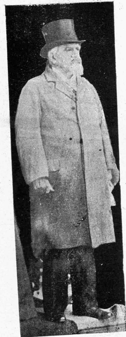
Ὁ Ρουμάνος πολιτικὸς κ. Μαγιορέσκου, ὅστις ἐπανελθὼν ἐκ Βιέννης ἀνεκοίνωσεν εἰς τὸν Βασιλέα Φερδινάνδον τὰς προτάσεις τῆς Αὐστρίας πρὸς τὴν Ρουμανίαν.

Ὅταν ἐπὶ τέλους ἐσυμβιβᾶσθη μὲ τὸν ἐαυτὸν τῆς καὶ ἔκρινε τὰς ἀποφάσεις ποῦ εἶχε λάβει, ἀπεφάσισε νὰ γράψῃ εἰς τὸν Στέφου, ἀκριβῶς διότι εἰξευρεν ὅτι καὶ αὐτὸς θὰ τὴν ἐπεδοκίμαζε. Ἡ ἡμέρα εἶχεν ἀρχίσει νὰ γλυκοχαράζῃ καὶ οἱ πετεινοὶ τῆς γειτονίας εἶχαν ἀρχίσει τὰς πρωϊνὰς συναυλίας των, κατὰ τακτικὰ διαλείμματα, εἰς τόνον ἄλλος χαμηλότερον καὶ ἄλλος ὑψηλότερον, πρᾶγμα τὸ ὅποιον