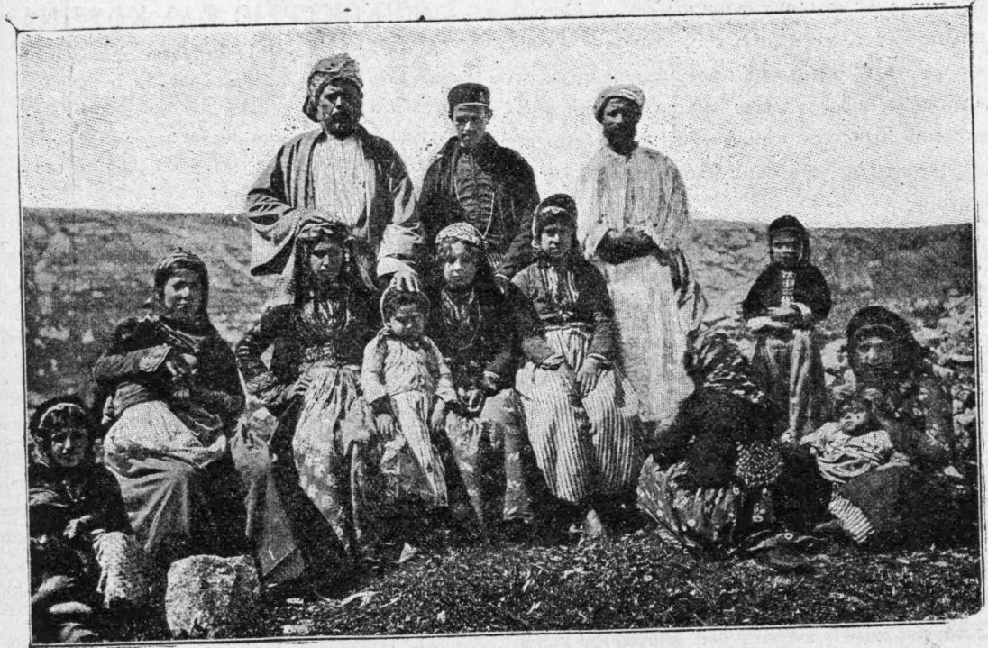
Σύγχρονοι Σαμαρείται ζῶντες εἰς Ναβλούς.