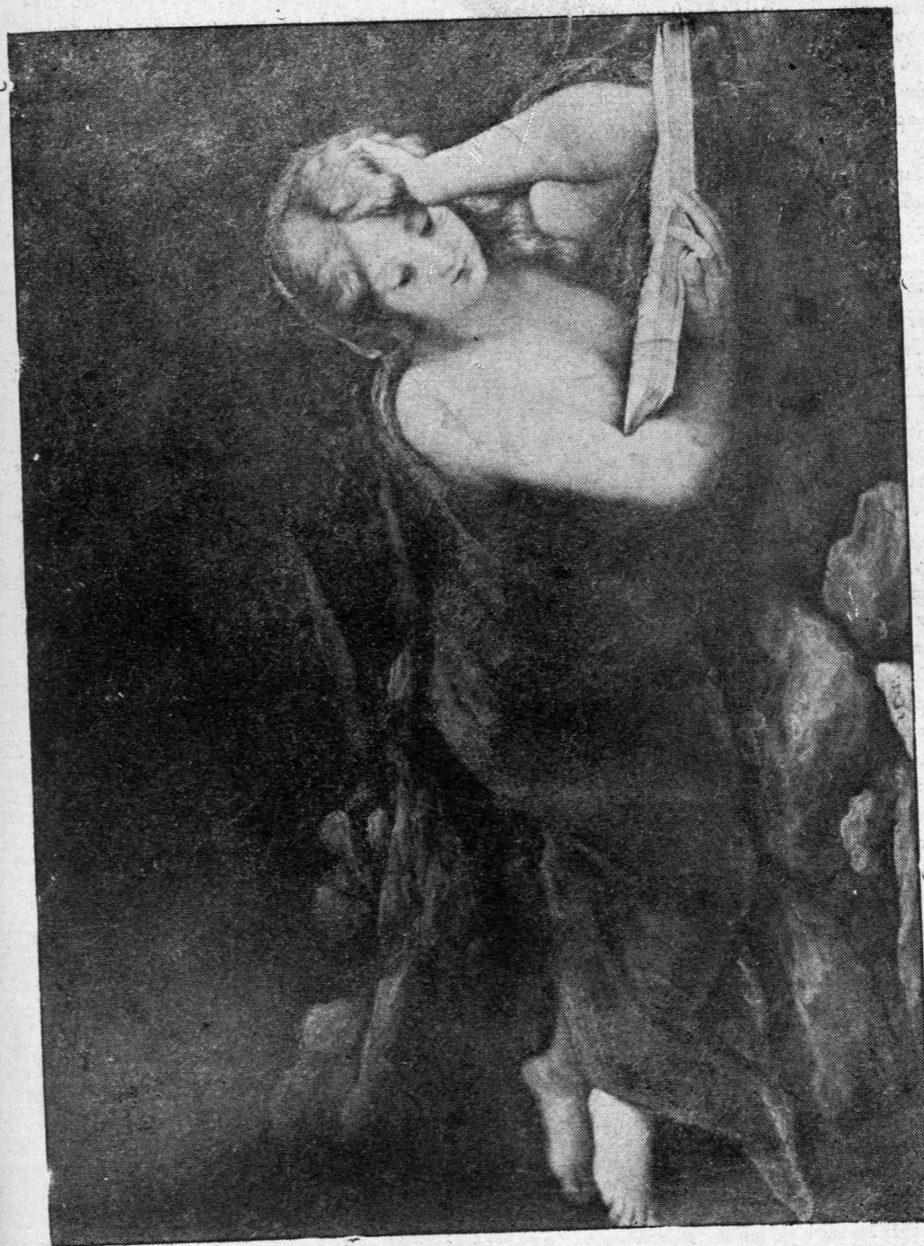
Ἐν ἀπὸ τὰ ἀριστουργήματα τοῦ Δογικοῦ Παλατιοῦ τῆς Βενετίας, τὸ ὁποῖον διὰ νὰ προφυλαχθῇ ἀπεσπασθῇ μὲ ὄλον τὸ τοῖχος.

Καὶ ἤθελε νὰ τῆς γράψῃ, νὰ τῆς εἰπῇ αὐτὰ τὰ αἰσθηματικά, αὐτὴ του τὴν μεγάλη λύπη. Καὶ ἄρχισε τὸ γράμμα του, σὰν στὴν παλιὰ ἐποχὴ ποῦ ζοῦσε μόνο μὲ τὴν ἀγάπην τῆς ξηνητεμένης μητέρας του. Ἡ ἀγάπη αὐτὴ μπορεῖ νὰ εἶχε ἀλλάξει, εἰς τὴν ἐξωτερικευσίαν της, τὴν αἰσθάνονταν ὅμως πάντα δυνατὴ, μοναδικὴν