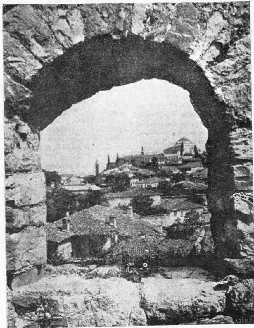
Αἱ Σέρραι πρὸ τῆς καταστροφῆς.

Ἄλλ' ὅ,τι πρὸ παντὸς ἀποτελεῖ τὴν ἀξίαν τῶν «Διηγημάτων» εἶναι οἱ ἄνθρωποι οἱ παριστάμενοι καὶ δρώντες ἐντὸς αὐτῶν. Εἶναι ὁ Μήτρος, εἶναι ἡ Σμάλτω τῆς «Φλογέρας», ἡ ψυχολογικὴ ἀνάλυσις τῶν αἰσθημάτων τῆς ὁποίας, ἐνφ' ἀναδεικνύει τὴν λεπτότητα τοῦ συγγραφέως, ἐξασθενίζει κάπως τὴν ἐνέργειαν χωριατοπούλας ὡς αὐτὴ· εἶναι ὁ Γιάννης καὶ ἡ Μάρω ἡ Κυρὰ Ρήνη καὶ ἡ Κυρὰ Καλή, ἡρωες φοβεροὶ καὶ μαρτυρικοὶ μύθου θαυμασίου, ἀνυψούμενοι μέχρι συμβολικῶν παραστάσεων τῶν σημαντικωτάτων ἐνοιῶν· εἶναι ἡ Μαλάμω καὶ ὁ Ζάχος τοῦ «Σπαθόγιαννου», ραψωδίας μᾶλλον ἢ διηγήματος· εἶναι ἡ δραματικὴ καὶ συγκινητικωτάτη ἱστορία τοῦ «Ἀφωρισμένου», ἀριστουργήματος εὐρέσεως καὶ οἰκονομίας· εἶναι οἱ ἔξοχοι «Νέοι θεοί», ὑπὸ μορφήν συντόμου διηγήματος εὐρεία καὶ μετὰ ἐπικὸν μεγαλείου συνάντησις καὶ συγκρουσίς ὄχι δύο χαρακτήρων, τοῦ ἐνωμοτάρχου Παπαθεοδωρακοπούλου καὶ τοῦ γέροντος ἀμαρτωλοῦ Χειμάρρα, μετὰ τέχνην ζηλευτὴν ἐκτυλισσομένων, ἀλλὰ δύο ἐποχῶν, δύο κόσμων· εἶναι αἱ «Ἡμέραι τῆς Γρηῆς», τόσο πνευματώδες παραμῦθι καὶ τόσο θλιβερὸν διήγημα· εἶναι τὰ καριοφύλλια τοῦ Σπαθόγιαννου καὶ τοῦ Χειμάρρα, ὁ πύργος τοῦ βουνοῦ, οἱ κλέφτες μέσα εἰς τὸ Μεσολόγγι, ἡ καταδίωξις τοῦ Γιάννου καὶ τῆς Μάρως ἀπὸ τὴν Μάγισσαν, τὸ δωμάτιον τῆς κυρὰ Ρήνης, ἡ μεταμόρφωσις τῆς ἐν ἀντι-