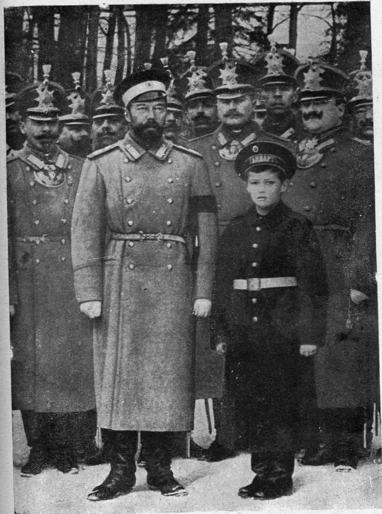
Ὁ Τσάρος ὁ Β'. φωτογραφηθεὶς μετὰ τοῦ Τσάρεβιτς, πρὸ τῆς ἀναχωρήσεως εἰς τὸ στρατόπεδον.

Δὲν ξέρω, ἂν ὑπάρχουν ἄνθρωποι ἐλεύθεροι ἑαυτὸν τὸν κόσμον, εἶπε, ἴσως νὰ μιλῶσε μὲ τὸν ἑαυτὸν τῆς. Ξέρω μόνον ὅτι κἄθε ἄνθρωπος πρέπει νὰ εὗρισκῃ ἕνα σκοπὸν στὴ ζωὴν του καὶ νὰ δουλεύῃ ἐλεύθερα γιὰ τὸ σκοπὸν αὐτό, ἔστω