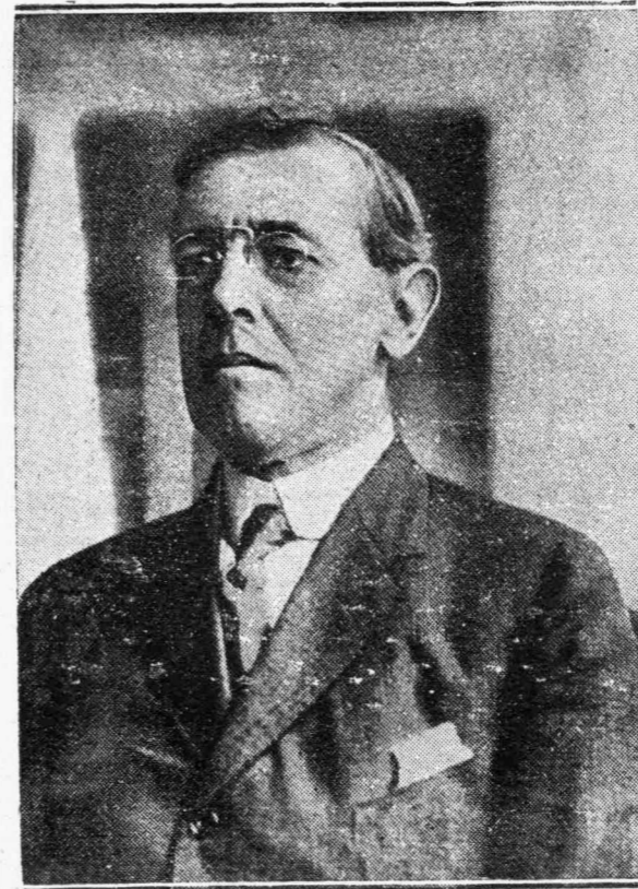
Ὁ Πρόεδρος τῶν Ἠνωμένων Πολιτειῶν, καὶ ἄγγελος τῆς εἰρήνης κ. Οὐίλσον.

Ἀλλὰ εἰς τί θὰ χρησιμεύσῃ ἡ ὑποτιθεμένη αὐτῇ εὐτυχία, ἐὰν δὲν θὰ μείνουν πλέον παρὰ οἱ ἀπόκληροι καὶ οἱ ἀνίκανοι τῆς ζωῆς διὰ νὰ τὴν ἀπολαύσουν; Εἰς τί θὰ χρησιμεύσῃ ἡ ἐπέκτασις τῶν ὀρίων αὐτῶν ἢ ἐκείνων, ὅταν οἱ πληθυσμοὶ θὰ ἀραιοθῶν τὸσον ὥστε μέσα εἰς τὰ Κράτη ποῦ θὰ ἐπεκταθῶν δὲν θὰ μείνουν παρὰ σκιά θανάτου, πλανώμεναι ἐντὸς ἐρείπιων; Εἰς τί θὰ χρησιμεύσουν αἱ νίκαι, ὅταν ἡ νεότης, ἡ δύναμις καὶ ἡ ἐλπίς τῶν λαῶν, θὰ δέχεται τὰ δάφνινα στεφάνια τῶν ἀγῶνων τῆς ἐπάνω εἰς τὰ ψυχρὰ μάρμαρα τῶν τάφων;