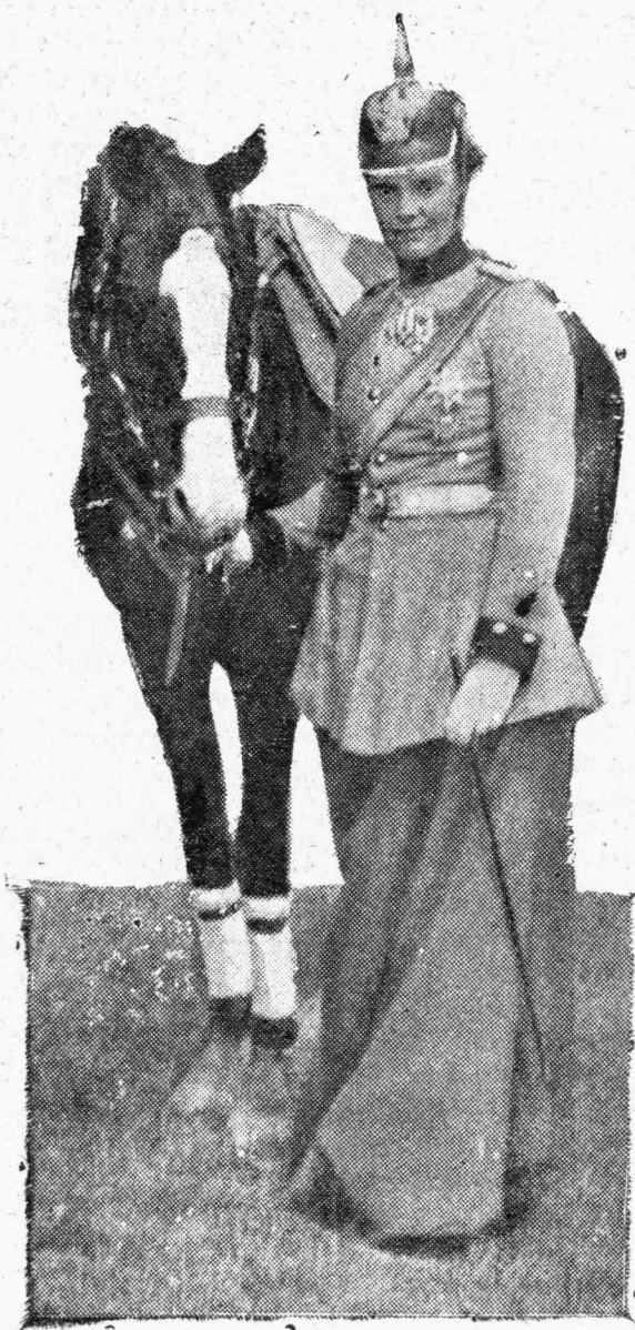
Γερμανίς Πριγκήπισσα Συνταγματάρχης τοῦ Ἴππικοῦ.