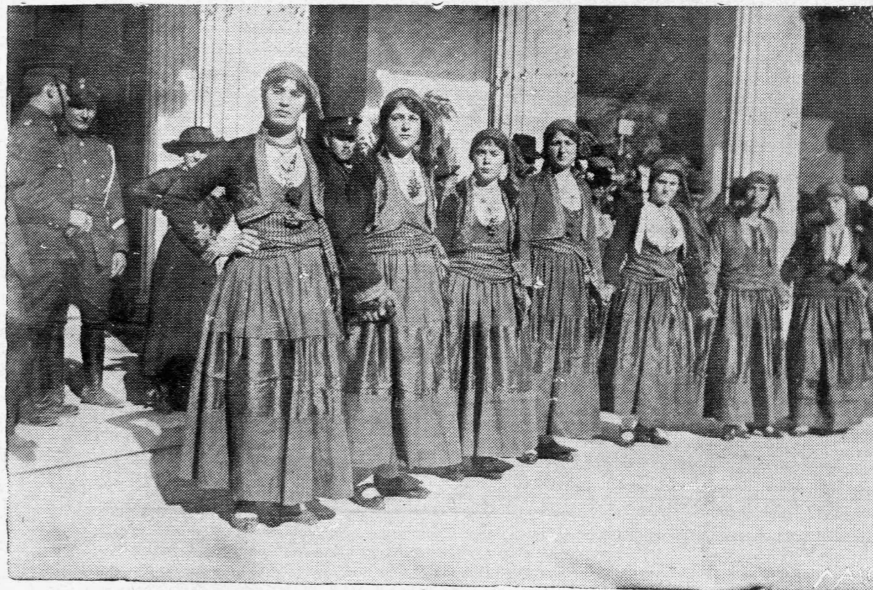
Ἅμαs χορευτριῶν μὲ Μανιάτικα. Ἀπὸ τὴν τελευταίαν ἐορτὴν τοῦ Δυκεῖου.