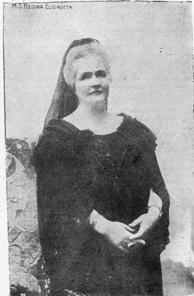
Ἡ ΑΠΘΑΝΟΥΣΑ ΒΑΣΙΛΙΣΣΑ ΤΗΣ ΡΟΥΜΑΝΙΑΣ ΕΛΙΣΑΒΕΤ