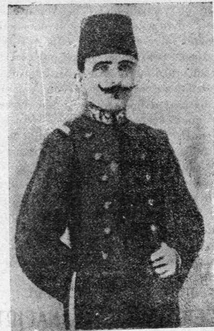
Ο άρχηγός των Νεοτούρκων ΕΜΒΕΡ ΠΑΣΣΑΣ ο όποιος διεδόθη ότι έδολοφονήθη.

Ποῖος ἄραγε θά εἰμποροῦσε να εἴπῃ την συγκίνησιν που προξενοῦν δύο ὡραία μεγάλα μάτια μαύρα ή γαλανά, ὅταν υγραίνωνται ὡς ρυάκια ήσυχα και ἀφίνουν να πίπτουν στα-