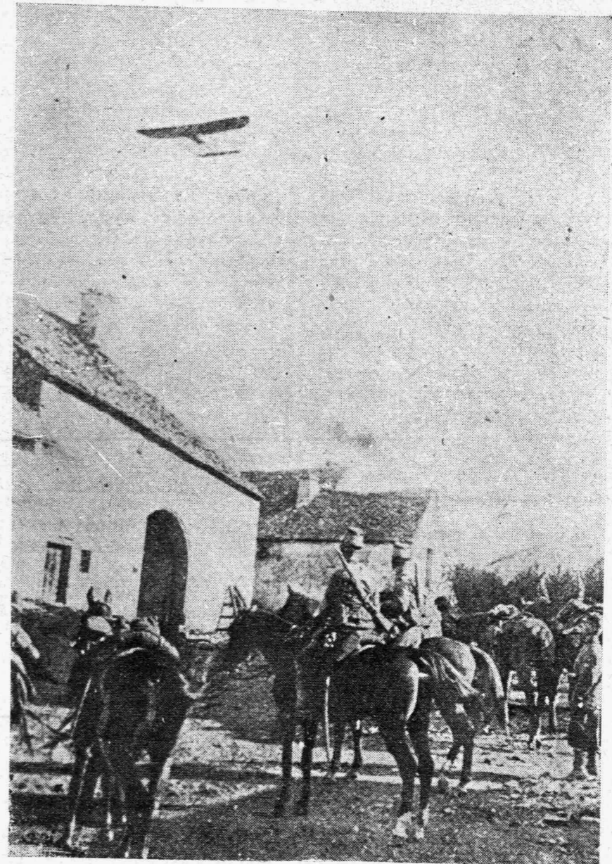
ΤΟ ΚΑΤΑΠΕΣΟΝ ΕΙΣ ΤΟ ΓΙΔΑ ΓΕΡΜΑΝΙΚΟΝ ΑΕΡΟΠΛΑΝΟΝ ΔΙΕΡΧΟΜΕΝΟΝ ΑΝΩΘΕΝ ΣΥΜΜΑΧΙΚΟΥ ΚΑΤΑΥΛΙΣΜΟΥ

Ἐγὼ δὲν φοβόμουν καθόλου οὔτε ἐκεῖ εἶπε ὁ μικρὸς. Ἦθελα μάλιστα νὰ βλέπω περὶ πολὺ τὸν μεθυσμένο. Ξέρεις ἐγὼ δὲν φοβοῦμαι τοὺς μεθυσμένους. Καὶ ἐμιλοῦσε δυνατὰ, γιὰ νὰ δίδῃ θάρρος εἰς τὸν ἐαυτὸν του. Θέλεις νὰ γυρίσωμε πίσω;