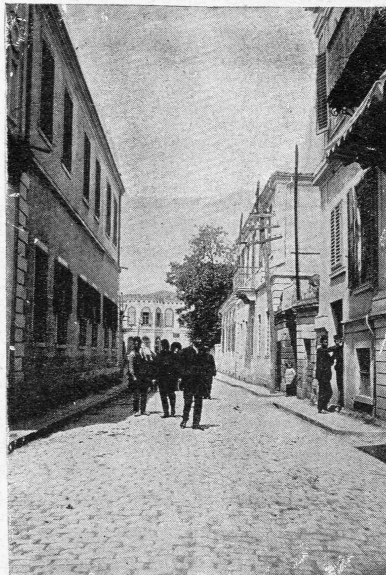
ΤΟ ΤΟΠ-ΧΑΝΕ.—Ὁπου ἔπεσαν βόμβαι τινὲς ἐκ τῶν Γερμανικῶν ἀεροπλάνων κατὰ τὸν βομβαρδισμόν τῆς Θεσσαλονίκης.

Ἦθελε νὰ διαιωνίσῃ ἐπὶ τοῦ μαρμάρου ἓνα τύπον ἰδεώδη καὶ ἄφθαρτον, ἓν ὑπόδειγμα κάλλους. Ναί, ἤθελε νὰ δημιουργήσῃ χίλια ἀγάλματα ὅχι ἓν! Ἡ ἰδέα ἐπαρουσιάζετο πάντοτε διάφορος ὡς τὸ νέφος, τὸ ὁποῖον μεταβάλλεται ἀπὸ στιγμῆς εἰς στιγμὴν ἀοράτως. Ἐκάστη κίνησις τῶν δακτύλων τῆς κατέστρεφε μίαν ἀρμονίαν καὶ ἐδημιούργει ἄλλην ὠραιότεραν, τελειότεραν. Διὰ μέσου τῶν λεπτῶν δακτύλων τῆς, ὑπὸ τοὺς διαφανεῖς ροδίνους ὄνυχας διήρχετο χεῖμαρρος σκοτεινῶν δυνάμεων ὡς αἱ σκέψεις διὰ τῶν ὀφθαλμῶν. Τὸ βλέμμα, ἡ ζωὴ τῶν ὀφθαλμῶν τῆς εἶχε τὸ ἀνέκφραστον, ἐκφραστικώτερον παντὸς λόγου, παντὸς ἤχου, ἀπείρως βαθὺ καὶ ὁμως ἀκαριαῖον ὡς κεραυνός, ταχύτερον ἔτι κεραυνοῦ. Καὶ ἐνόμιζέ τις, ὅτι οἱ δημιουργοὶ δάκτυλοι διέχον ἐπὶ τοῦ ἐκ μαρμάρου ἀριστοτεχνήματος τὴν ζωὴν τοῦ βλέμματός. Ἡ καλλονὴ δι' αὐτὴν ἔξῃ εἰς ὅλα τὰ μέρη. Εἷς ἕκαστος τῶν λευκῶν, τῶν ἀμόρφων κύβων ἐνέκλειε μίαν μορφήν τελειότητος: ἀπὸ καιροῦ εἰς καιρὸν ἐργαζομένη ἐκλίνει πρὸς τὸν λιθίνον ὄγκον, παρετήρει προσεκτικῶς τὴν ὑφήν, ἐφαίνετο ἐρευνῶσα τὰς ἐσωτερικὰς ἰνας του, ἐδίσταζεν, ἐμειδία, ἐσκέπτετο. Εἶδος θείας ἐλξεως ὑφίστατο μεταξὺ τοῦ πνεύματός τῆς, μεταξὺ τῶν δακτύλων τῆς καὶ τοῦ μαρμάρου, τὸ ὁποῖον κλίνουσα ἔψαυεν, ἐθώπευε διὰ τῆς πνοῆς τῆς. Θεία πνοὴ ἐφαίνετο ἀνερχομένη, ὑψουμένη πρὸς αὐτὴν ἐκ τῆς ἀδρανούς ἐκείνης λευκότητος. Ὁ ἄνεμος, ὁ ἥλιος, τὸ μεγαλεῖον τῶν ὀρέων, ἡ