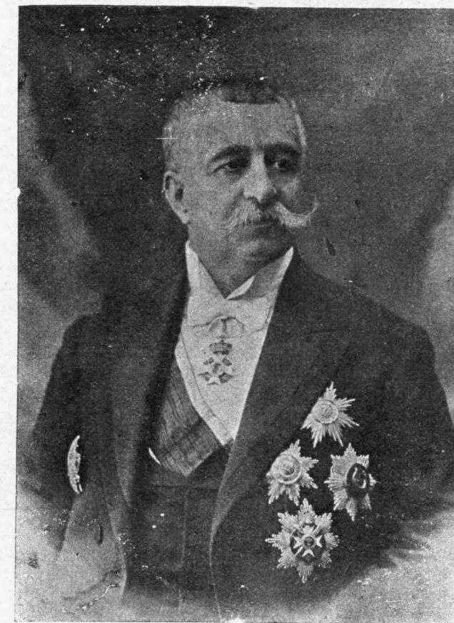
Ο άποθανών πρώην Πρωθυπουργός Κ. ΜΑΥΡΟΜΙΧΑΛΗΣ

Έάν λοιπόν μετά τά λεχθέντα παραλληλίσω- μεν τό βάρος του σώματος της γυναικός προς τό του άνδρός, έν σχέσει προς τον έγκέφαλον αυτών, τότε ή δέν ύπάρχει ούδεμία διαφορά ή αυτή είνε έλαχίστη. Και τό πρώτον όμως εάν παραδεχθώμεν, ως προς τας λειτουργίας των δύο έγκεφάλων οί μετωπιαίοι λοβοί, ένθα έδράζεται