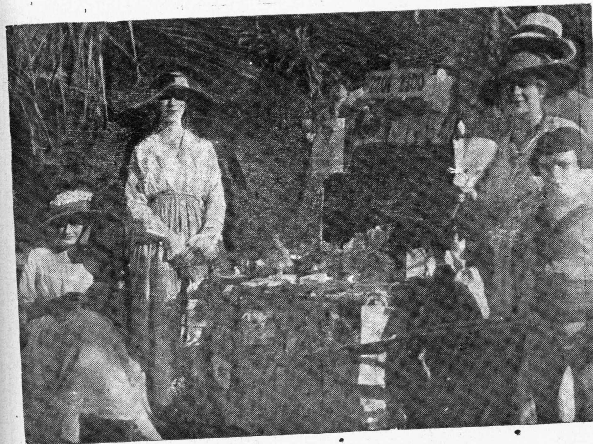
Ἀπὸ τὴν ἑορτὴν τῆς Κηφισσιᾶς ὑπὲρ τῶν προσφύγων.

Ἡ μικρὴ καστανὴ δὲν γελοῦσε πιά. Ἄκουγε τὰ φλογερὰ λόγια κρατώντας τὴν ἀναπνοή της κ' ὅταν ἡ φίλην της ἐσώπασε, αὐτὴ ἔσκυψε τὸ κεφάλι συλλογισμένη.