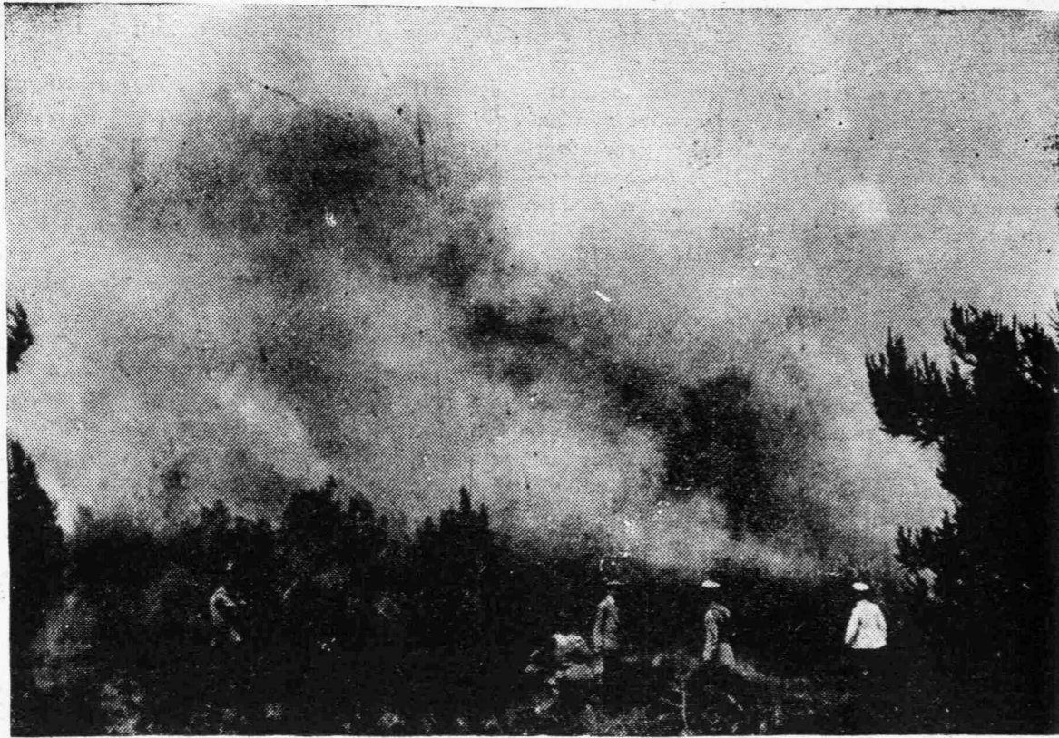
Ἀπὸ τὴν Πυρκαϊὰ τοῦ Τατοῦ.

τοῦ κληριδίου χωρισμοῦ. Δὲν ἐγκριέτισε κἀν τὴν Κουίν, ἀλλ' οὔτε ἔστρεψε πειὰ τὰ μάτια πρὸς τὸ μέρος τῆς. Μὲ τὸ κεφάλι κἀτω ἐβγήκε ἀπὸ τὸ μικρὸ σαλονάκι, τρικλιζοντας. Μία κκαμυριέρα τὸν ἐπερίμενε, γελαστή καὶ τὸν ὠδήγησε ἀνάμεσα ἀπὸ διακδρόμους εἰς μίαν μικρὴ πορτίτσα, ποῦ ἔδιδε εἰς ἄλλο δρόμο, ἐκεῖ τοῦ μισοάνοιζε μουρμουρίζοντας. Ὁ κύριος θὰ δώσῃ κἀτι γιὰ τὴν εὐκολία ποῦ τοῦ γίνεται, νὰ φύγῃ χωρὶς νὰ τὸν ἰδῇ κανεὶς, χωρὶς νὰ ὑποπτευθοῦν τίποτε. Μηχανικὰ ἔβαλε τὸ χέρι στὴν τσέπη του καὶ ἔδωκε ἀσυνοείδητα τρία φράγκα εἰς τὴν κκαμυριέρα. Εἰς τὸν δρόμο ἀνέπνευσε. Εἶχε τὸ κἀσθημα σὰν νὰ ἐξυπνοῦσε ἀπὸ ἓνα τρομερὸ ἐπιάλτη, ποῦ τοῦ ἐβάρυνε ἀκόμη τὸ στῆθος. Ἐπεριπάτησεν ἐμπρὸς του, χωρὶς νὰ ξέρῃ οὔτε ποῦ εὐρίσκετο, οὔτε ποῦ ἐπήγγινε. Τοῦ ἐφάνετο ὅταν ἓνα μεγάλο κενὸ νὰ ἐγίνετο γύρω του, ὅταν νὰ μὴν εὐρίσκετο πλέον στὴν ζωὴ, σὰν νὰ μὴν ἐγνώριζε κανένα, ἀλλ' οὔτε νὰ εἶχε πειὰ τὸν ἐλάχιστο δεσμό μ' ἀνθρώπους. Κάτι χλωδὲς καὶ στὸ κεφάλι καὶ στὴ καρδιά. Ἐνεκεν θά-