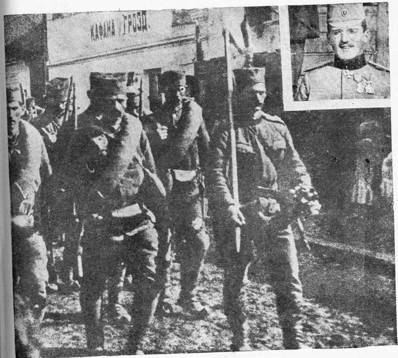
Ὁ Σερβικὸς στρατὸς μετὰ τοῦ ἀρχιστρατήγου του Διαδόχου Ἀλεξάνδρου.

Μιὰ φορὰ ὅταν ἦταν ἀκόμη ἐσωτερικὴ στὸ σχολεῖο, μιὰ συμμαθήτριά της, τῆς ἔφερε κρυφὰ κάποιον μυθιστόρημα. Ἐκεῖ μέσα ἔγραφε πράγματα, ποὺ μόνον οἱ μεγάλοι ξεύρουν. Καὶ τί παράξενο! Ὁ ἦρωας τοῦ βιβλίου ἔμοιαζε ἀπαράλλακτα ὅσων τὸν ὄμορφο ἐξάδελφο. Ἀπὸ τότε αὐτὸν μονάχα εἶχε στὸν νοῦ της ἢ ὀλόξανθη παιδοῦλα, καὶ τὸ βράδυ τὸν ὄνειρευέτο ξαπλωμένη μέσα στὸ στενὸ σιδερένιο κρεβάτι της.