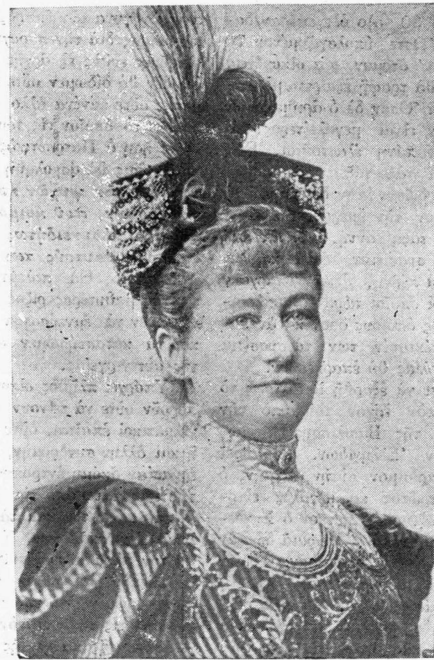
Η Αυτοκράτειρα Αυγούστα της Γερμανίας.

Διότι διά τον λαόν τον ιδικόν μας το ψωμί είναι ή ζωή. Εύθις δέ ως το ψωμί όλιγοστεύει αισθάνεται να όλιγοστεύη ή ζωή του, και όταν θά του λείψη έντελώς πιστεύει ότι θα άποθάνη. Πρέπει λοιπόν να μάθωμεν, να πείσωμεν τον λαόν ότι ήμπορεί να ζήση και χωρίς ψωμί. Πρέπει να έλθωμεν εις τοιαύτην συνάφειαν και επαφήν μαζί του, ώστε να τον διδάξωμεν, να του εξηγήσωμεν, να του μάθωμεν ότι ένα αυγό, 50 δράμια γάλα και μία σουπα από λαχανικά, κρομμύδια και όσπρια άνοσπληροϋν με πολύ υγιεινότερα αποτελέσματα της τεράστιες φέτες το ψωμί που μετεχειρίσθη ως τώρα για να ζήση. Αι κυρίαί του Λυκείου των Έλληνίδων άπε-