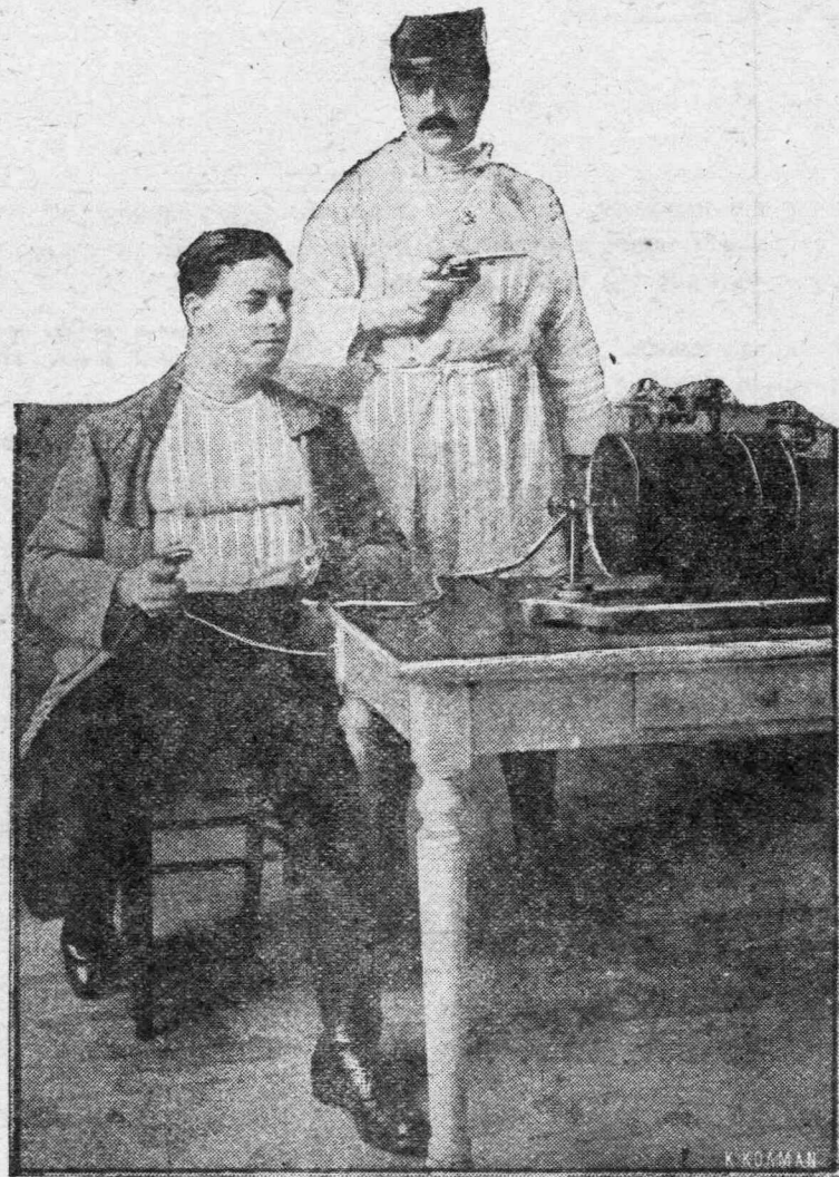
Ἡλεκτροθεραπεία τῶν τραυματιῶν τῶν ὁποίων τὰ χέρια ἔπαθαν παραλυσίαν