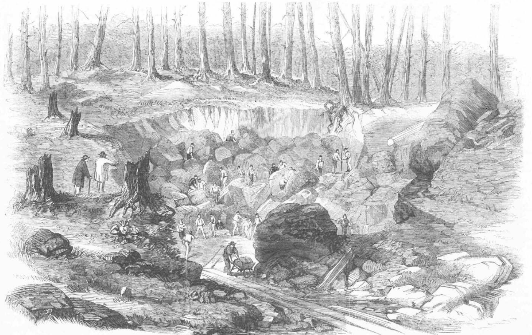
ΧΑΛΚΟΥΡΥΣΙΟΝ ἢ ΛΑΤΟΜΕΙΟΝ ΕἰΣ ΚΑΝΑΔΑΝ ΠΑΡΑ ΤΗ ΠΟΛΕΙ ΜΟΝΤΡΙΑΛ. (166 σελ. 362.)

μεγάλης εἰκόνης ἀντικειμένων καὶ τῆς τεχνικῆς ἐπιδειξιότητος, δι' ἧς εἶναι ἐξαιρετικῶς ἐπισημασμένον τὸ ὄλον. Πρὸς δεξιὰν τοῦ ἐπεισοδίου τούτου παρίστανται πληρωμένοι τινὲς καὶ μεταξὺ αὐτῶν στρατιώτης Ἀγγλος, καὶ κάμυλος ἐπίσης τετραυματισμένη· εἰσὶ δὲ εἰκόνησιν αὐτῶν κατὰ τὴν μαρτυρίαν τῶν ἰδόντων τοὺς Ἰνδοὺς στρατιώτας καὶ ἠρωρίζοντων τὰ ἦθη των φυσικώτατα.