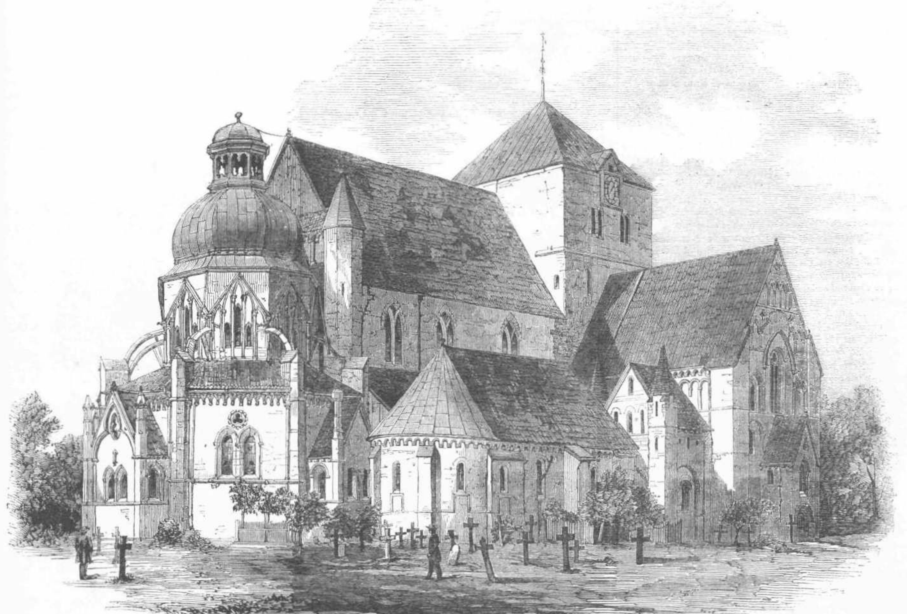
Η ΜΗΤΡΟΠΟΛΙΤΙΚΗ ΕΚΚΛΗΣΙΑ ΤΗΣ ΔΡΟΝΘΕΙΜ, ΕΝ ΗΙ ΣΤΕΦΟΝΤΑΙ ΟΙ ΒΑΣΙΛΕΙΣ ΤΗΣ ΝΟΡΒΗΓΙΑΣ.