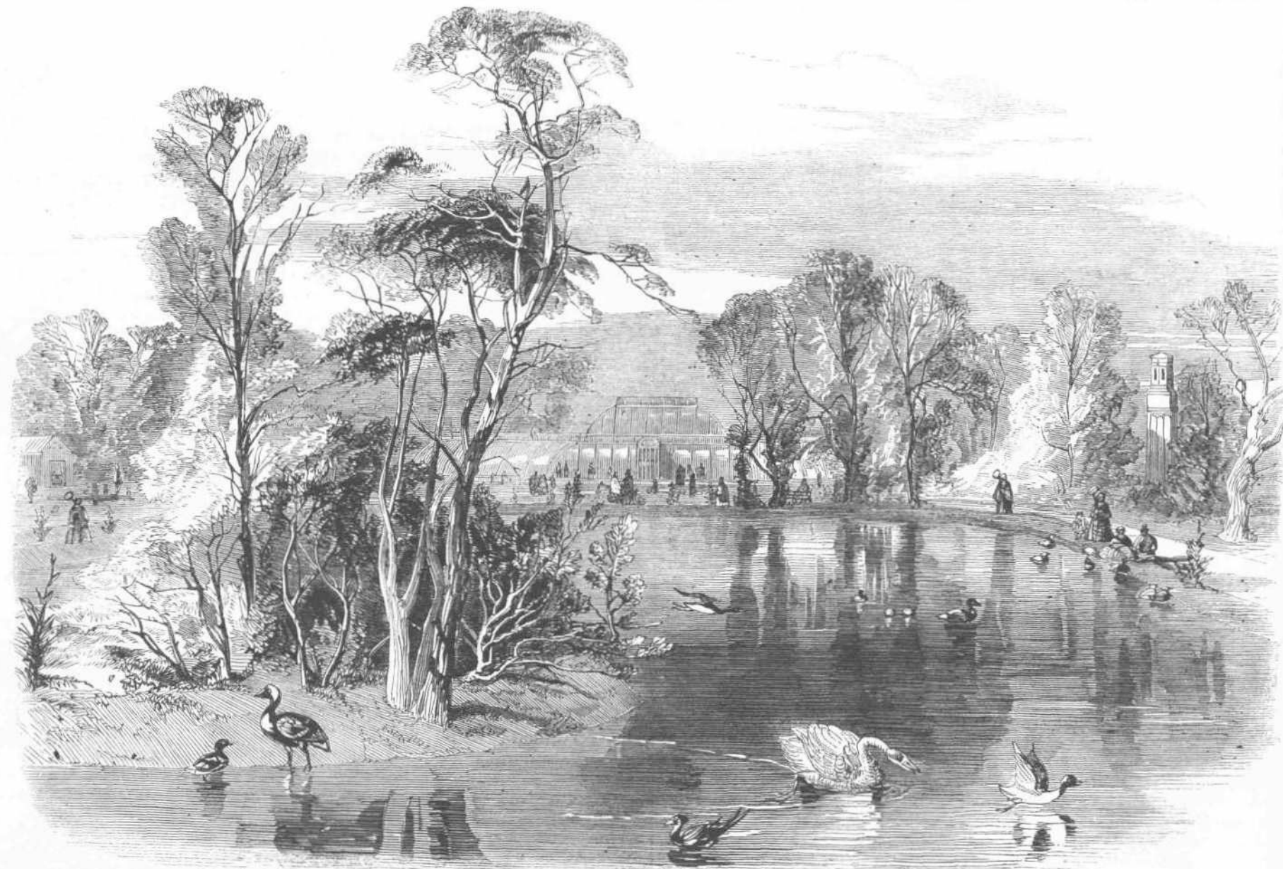
Η ΕΝ ΤΩ ΒΟΤΑΝΙΚΩ ΚΗΠΩ ΚΗΟΥ ΝΕΑ ΛΙΜΝΗ.

άνδρες άπηγόρευτο προς περιαγωγήν αυτής περί τον ναόν κατ' έθος αρχαίων. Όταν βασιλεύς τις έμελλε να αναλάβη τας ήρας του κράτους, ή λάρναξ μετεκομίζετο εις την προκυμαίαν του ποταμού, και εκεί ώρκίζετο ο βασιλεύς, θέτων την χείρα επί της λάρνακος' έτι δε και τα λείψανα του αρχιεπισκόπου Εύσσειν έφαιλάσσοντο εις άργυράν πολύτιμον λάρνακα. Παρεκτός δε τούτων είχαν ή εκκλησία και πλήθος μεγάλων άργυρών σταυρών, ποτηρίων κτλ. εκ των οποίων όλων την υπεργύμνωσαν επί της μεταρρύθμισσεως. Τα αποφέροντα όμως τούς θησαυρούς τούτους πλοία συνελήφθησαν υπό πειρατών ή έβυθίσθησαν εις την θάλασσαν. Το εντικόν μέρος της εκκλησίας ταύτης από του μεγάλου κεντρικού πύργου και κάτω καταστράφη υπό του πυρός το 1718, και έκτοτε έμεινεν έρειπωμένη, ως φαίνεται την σήμερον.