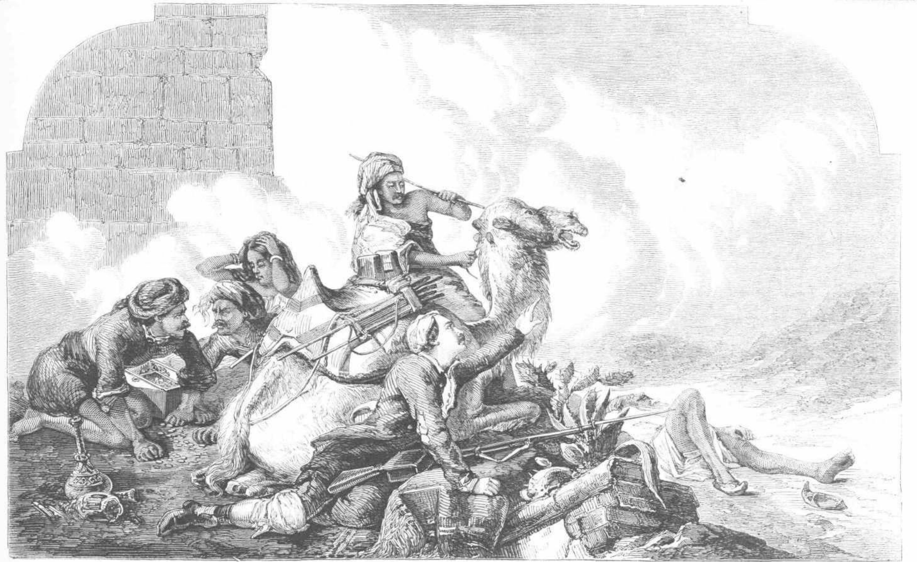
ΒΡ. ΤΕΧ.—Η ΑΝΑΚΟΥΦΙΣΙΣ ΚΑΙ ΠΑΡΑΜΥΘΙΑ ΤΩΝ ΚΑΤΟΙΚΩΝ ΤΗΣ ΠΟΛΕΩΣ ΛΟΥΚΝΗΒΗΣ.

Ἐν τῇ τοῦ Λουκνίου στοῦ τῆς ἐκθίσσεως τῶν ὁραίων τεχνῶν ἀνάκειται μεγάλη τις εἰκὼν, ἐπιγραφομένη ἢ «Ἀνακούφισις καὶ παραμυθία τῶν κατοίκων τῆς πόλεως Λουκνίβης εἰς τὰς Ἰνδίας». Τὸ περιεργον τοῦτο ἱστορικὸν ἔργον τοῦ ζωγράφου Βάκερ ἐπισύρει ἔτι καὶ νῦν πλῆθος θεατῶν φιλομούσων, θαυμάζοντων τὴν ζωρὰν σχεδίασιν τοῦ μεγάλου ἐκείνου συμβάντος, καθ' ὃ εἶχον συνελθεῖν ὑπὸ τὰ τείχη τῆς πόλεως Λουκ-