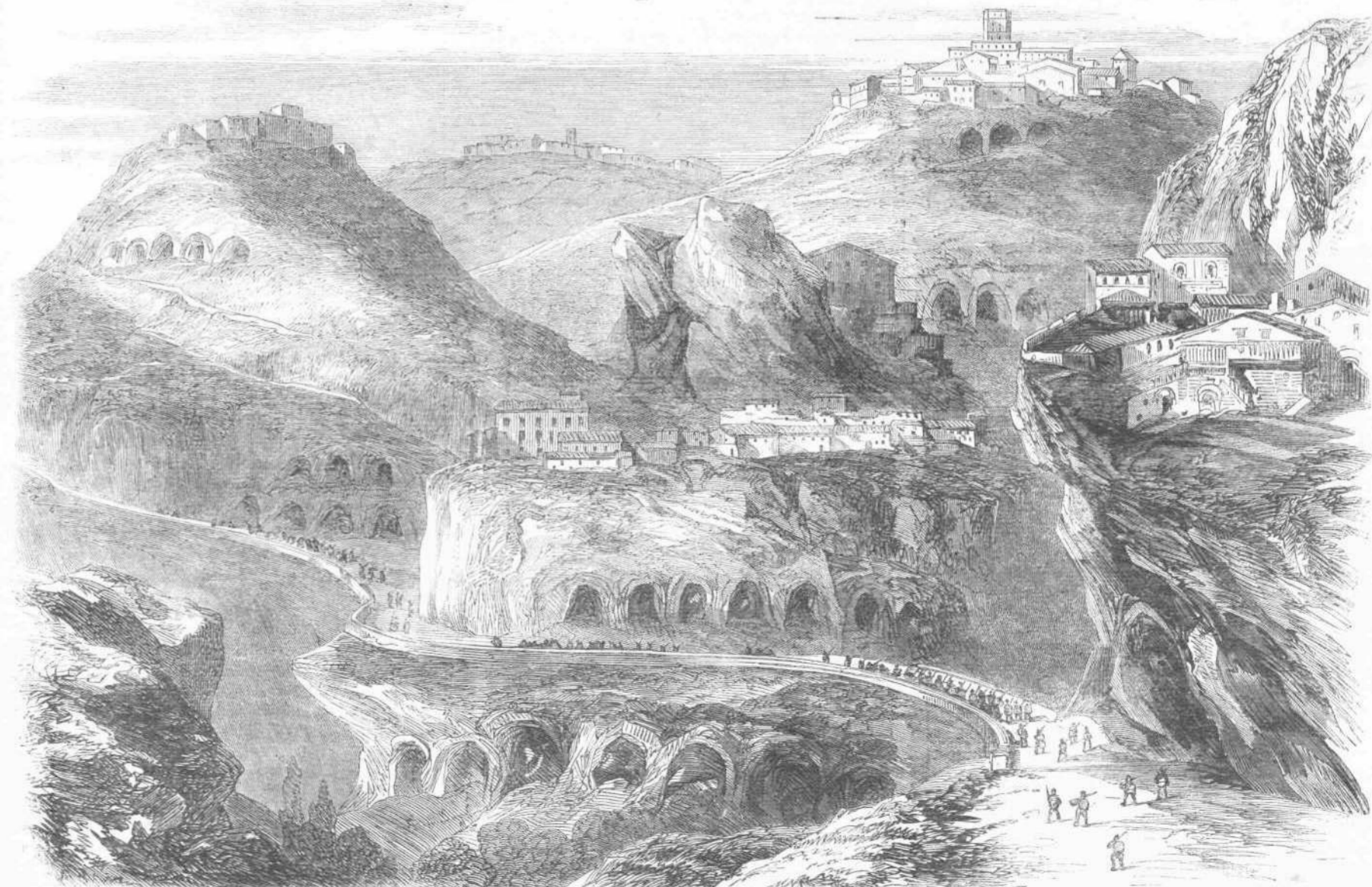
ΘΕΑ ΤΗΣ ΚΑΣΠΡΟΥΒΑΝΝΗΣ. (17η σελ. 272.)