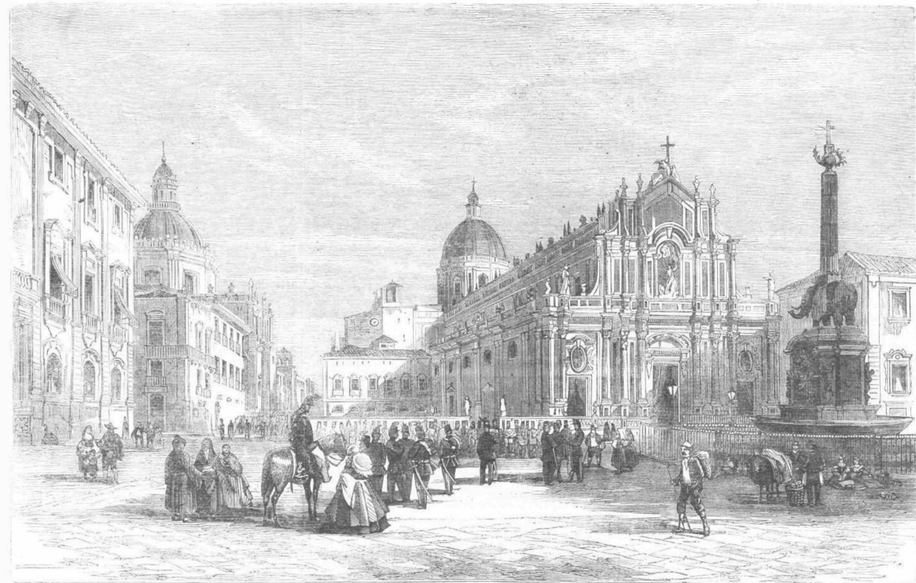
Η ΕΝ ΚΑΤΑΝΙΑ ΜΗΤΡΟΠΟΛΙΤΙΚΗ ἘΚΚΛΗΣΙΑ ΚΑΙ Η ΠΑΛΤΕΙΑ ΤΟΥ ΕΛΕΦΑΝΤΟΣ. (17η σελ. 272.)