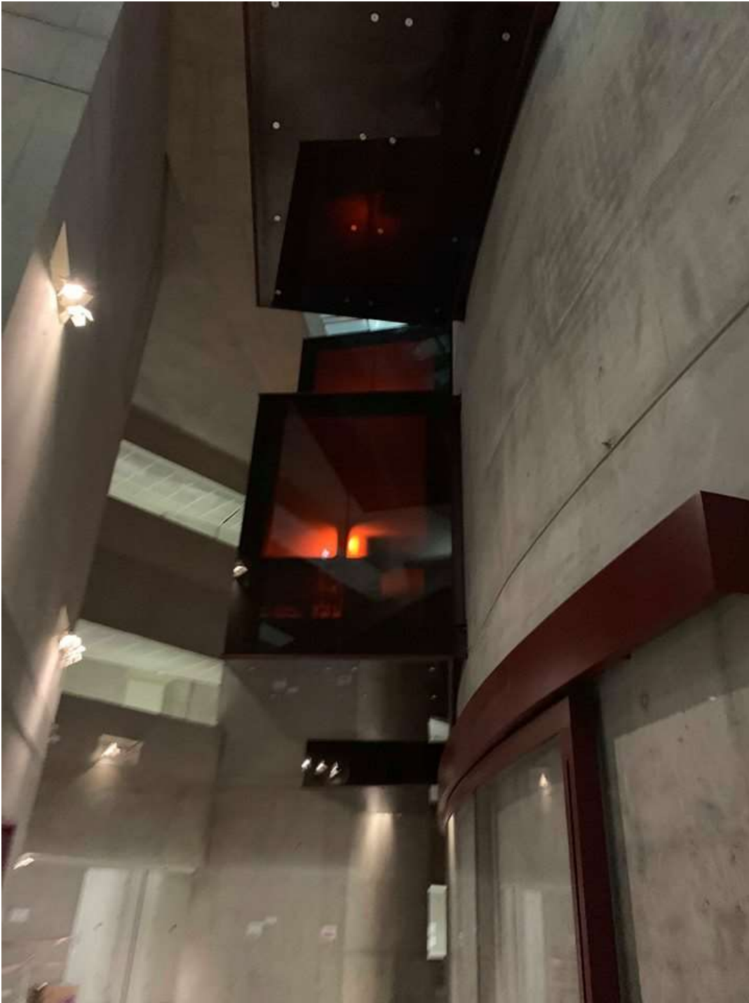
Ανοιχτό σε φοιτητές, ακαδημαϊκούς και ευρύ κοινό από χθες το Κέντρο Πληροφόρησης - Βιβλιοθήκη «Στέλιος Ιωάννου».