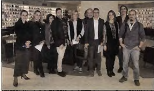
Οι δημοσιογράφοι και οι ξεναγοί τους στην εντυπωσιακή είσοδο, στο ισόγειο του Κέντρου-Βιβλιοθήκης, που είναι διαμορφωμένο σε πέντε επίπεδα.