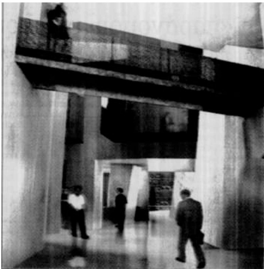
Αριστερά: Το κτίριο διασφαλίζει την ενοποίηση και αξιοποίηση των σύγχρονων ηλεκτρονικών και άλλων μέσων, ιδιαίτερα σχετικών με την πληροφορική.