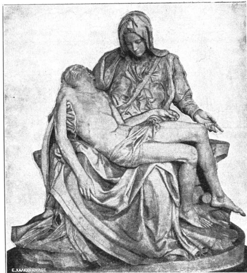
ΕΙΚ. 1. ΠΙΕΤΑ

Θὰ ἐξετάσουμε τώρα τὰ ἔργα τοῦ πρώτου μισοῦ τῆς ζωῆς του (ὡς τὸ 1520), ποὺ ἀποτελοῦνε ξεχωριστὴν ομάδα: