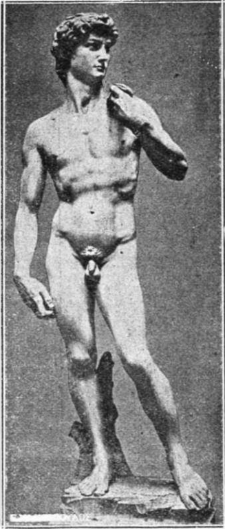
Εἰκ. 3. Δαυὶδ.

Σύμφωνα μὲ τὴν παράστασι αὐτὴ ὁ Donatello τὸν εἶχε παραστήσει ρωμαλέο νέο, ὁ Verrocchio σὰ λιγερό καὶ λεπτὸ ἔφηβο. Ὑστερ' ἀπ' αὐτοῦ, τί μᾶς δίνει