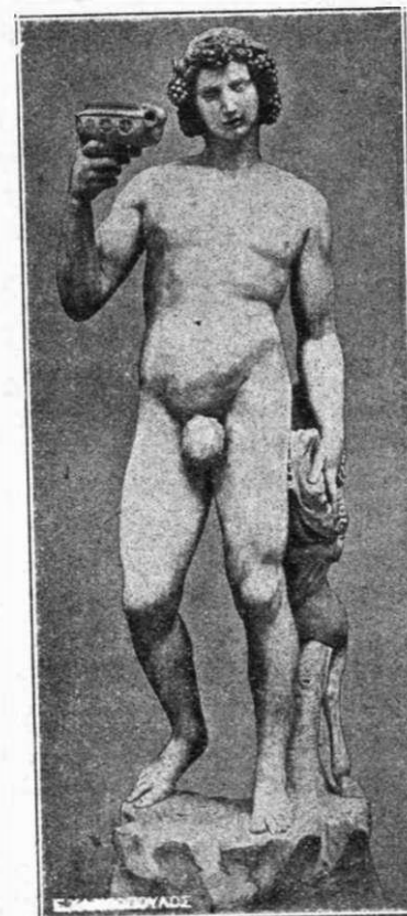
Εἰκ. 2. Ὁ Βάγκος.