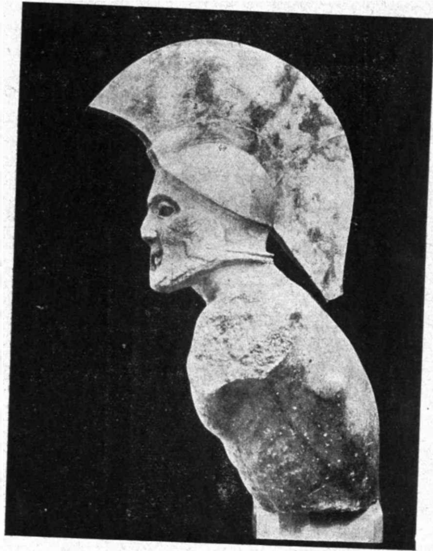
Εἰκ. 3. Τὸ ἄγαλμα τοῦ «Λεωνίδα»

Στὸ πρόσωπο συνδυάζεται ἡ μεταβατικὴ τεχνοτροπία ἀπὸ τὴν ἀρχαϊκὴ στὴν κλασικὴ. Ἀρχαϊκὰ εἶναι τὰ παχειὰ χεῖλια, τὰ φουσκωμένα μάγουλα, ἡ μυτερὴ γενειάδα, τὸ στόμα σὲ σχῆμα καμπύλης ἀνοιχτῆς πρὸς ἄπάνω. Ὅμως ἡ πρόχω-