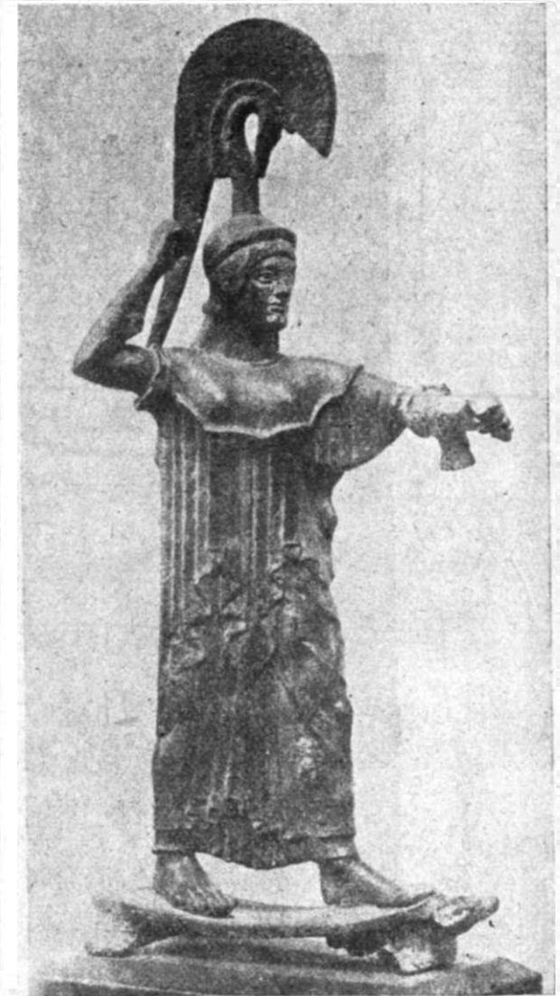
Εἰκ. 2. Χάλκινὸ ἀγαλματάκι τῆς Ἀθηνᾶς (ἀρχαιολ. Μουσεῖο)

Ἡ δυνατὴ ἐντύπωση πὺν παίρνομε ἀπὸ τὸ ἔργο χρωσιέται τὸ πῶς πολὺ σὲ δυὸ στοιχεῖα: στὴ ζωντάνια καὶ τὴ δύναμη τῆς κίνησης, καὶ ἀπὸ τὸ ἄλλο μέρος στὸ ρωμαλέο πρόσωπο μετὰ τὴ λιονταρίσια ὁρμὴ.