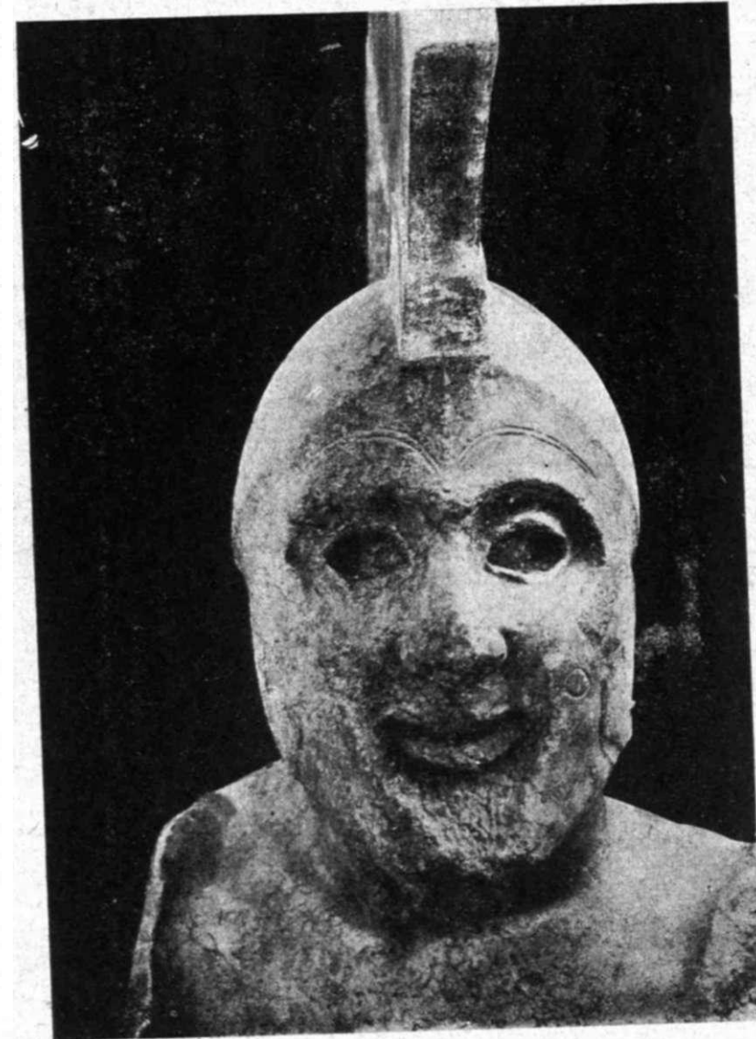
Εἰκ. 4. Τὸ πρόσωπο τοῦ «Λεωνίδα»

Ἐντύπωση κάνει ἡ ἔλλειψη μουστακιοῦ πὸν δὲ συμβιβάζεται γιὰ τὴ σημερινὴ ἀντίληψη μὲ τὴν ὑπαρξὴ τῆς γενειάδας. Ἄμα ὅμως ἔξερε κανεὶς τὴ διαταγὴ πὸν ἔβγαζαν οἱ ἔφοροι τῆς Σπάρτης, μόλις ἔπαιρναν τὴν ἐξουσία, «κείρεσθαι τὸν