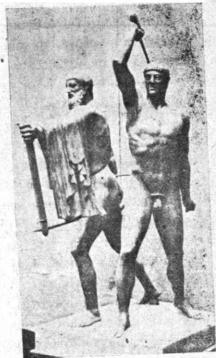
Εἰκ. 5. Οἱ ἀντριάτες τῶν Τυρανοχτόνων. (Μουσεῖο τῆς Νεάπολης)

Εἶναι γνωστὸ πὼς στὸ 514 π. Χ. δυὸ Ἀθηναῖοι, πού εἶχαν ζωντανὸ τὸ αἶσθημα τῆς ἐλευτερίας, ὁ Ἀριστογείτονας κι ἕνας πῶς νέος, ὁ Ἀρμόδιος, ἀποφάσισαν νὰ σκοτώσουν, τὴν ἡμέρα τῆς γιορτῆς τῶν Παναθηναίων, τοὺς γιούς τοῦ Πεισιστρατοῦ πού συνέχιζαν τὴν τυρανικὴ ἐξουσία τὴν κληρονομημένη ἀπὸ τὸν πατέρα τους. Μιὰ σύχιση ἔφερε τὸ ἀποτέλεσμα νὰ σκοτωθεῖ ὁ ἕνας ἀπὸ τοὺς Πεισιστρατίδες, ὁ Ἴππαρχος. Ἀμέσως ὅμως ἔπεσαν, καὶ οἱ δυὸ τυρανοχτόνοι ἀπὸ τίς λόγχες τῶν δορυφόρων. Ὑστερὸ ἀπὸ τὸ θάνατο τους, οἱ συμπατριῶτες τους παράγγειλαν στὸν Ἀθηναῖο γλύπτη Ἀντήνορα νὰ κάνει ἕνα χάλκινο σύμπλεγμα γιὰ νὰ τὸ στήσουν πρὸς τιμὴ τους στήν ἀγορὰ. Τὸ σύμπλεγμα τοῦτο τὸ πῆρε τὸ 480 ὁ Ξέρξης, μπαίνοντας στήν Ἀθῆνα, καὶ τὸ πῆρε μαζί του στὰ Σούσα. Ἐκεῖ, ὕστερὸ ἀπὸ 200 χρόνια, τὸ βρῆκε ἕνας μεγάλος Μακεδόνας, μὲ Ἀθηναῖος στὴ μόρφωση, ὁ Ἀλέξανδρος καὶ τὸ χάρισε στοὺς Ἀθηναῖους. Στὸ μεταξὺ ὅμως, ἀμέσως ὕστερὸ ἀπὸ τὴ μάχη τῆς Σαλαμίνας, κατὰ τὸ 479—8 οἱ Ἀθηναῖοι εἶχαν ἀναθέσει σὲ δυὸ γλύπτες, τὸν Κρίτιο καὶ τὸ Νησιώτη νὰ κάνουν ἄλλο σύμπλεγμα γιὰ νὰ τὸ βάλουν στὴ θέσῃ τοῦ ἀρπαγμένου. Τώρα πού εἶχαν μάθει ὅσο ποτὲ νὰ ἐχτιμοῦν τὴν ἐλευτερία, θέλησαν νὰ μὴν ἀφήσουν ἀτίμητους ἐκείνους πού στὰ παλιὰ τὰ χρόνια εἶχαν θυσιαστεῖ γιὰ νὰ τὴν προετοιμάσουν. Τοῦ δευτέρου αὐτοῦ ἔργου τοῦ Κρίτιου καὶ Νησιώτη ἀντίγραφο φαίνεται νὰ εἶναι τὸ «σύμπλεγμα» τοῦ μουσεῖου τῆς Νεάπολης 1 .