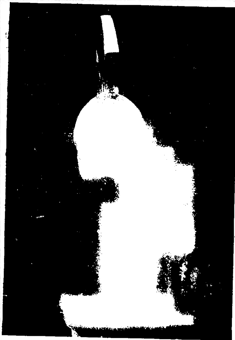
Εἰκ. 1. Τὸ ἀγαλμα τοῦ «Λεωνίδα»

Τέτιος εἶναι ὁ χρησμός πὺν ἔδωσε ἡ Πυθία στοὺς Σπαρτιάτες, ὅταν νευρι-