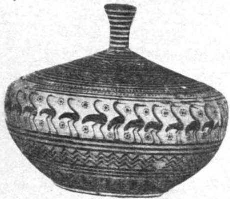
Εἰκ. Ἀρ. 6

«ὕστερορωμαϊκὴ βιοτεχνία» (Spä römische Kunstindustrie) ἀπόδειξε, πὼς ἡ τέχνη τῶν τελευταίων χρόνων τοῦ Ρωμαϊκοῦ κράτους δὲν πρέπει νὰ θεωρηθῆ τέχνη τῆς κατάπτωσης, γιὰτὶ ὀφείλεται στὴν ὀμαλὴν ἐξέλιξη ἀπὸ τὴν ἀρχαία πρὸς τὴ μεσαιωνικὴ καὶ ὄχι στὴν ἐπίδραση τῆς εἰσβολῆς τῶν «βάρβαρων φυλῶν τοῦ Βορῶ», ἄρχισαν καὶ οἱ ἀρχαιολόγοι νὰ κοιτάζουν μὲ ἄλλο μάτι τὴ Γεωμετρικὴ.