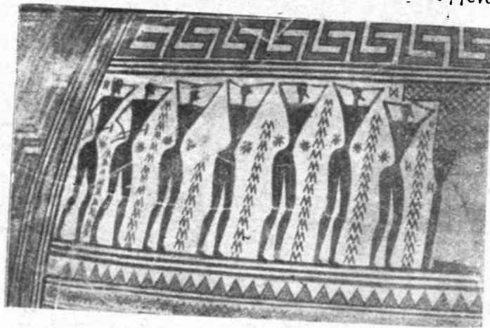
Εικ. Αρ. 4

Στο μεγάλο αγγείο της Γεωμετρικής εποχής ( Εικ. 3 και 4 ), που βρέθηκε στον Κεραμεικό, έχουμε την ανώτερη μορφή της αφαίρεσης. Όλο το σώμα του είναι γιομάτο δοιζόντια γραμικά κοσμήματα, μαίανδρους, τρίγωνα. Τα κυκλικά κοσμήματα, οί καμπύλες, αποφεύγονται συστηματικά, οί κύκλοι τετραγωνίζονται. Η παράσταση συγκεντρώνεται σ' ένα μικρό χώρο ανάμεσα στις λαβές του αγγείου και είναι σχετική με τη χρήση του. Επειδή τα αγγεία αυτά ήταν βαλμένα πάνω στον τάφο σάν «σήμα», σχεδιάστηκε μια πρόθεση νεκρού, ή έκθεση του στο σπίτι και το κλάψιμο του από τις μοιρολογήτρες και τους συγγενείς. Έτσι που