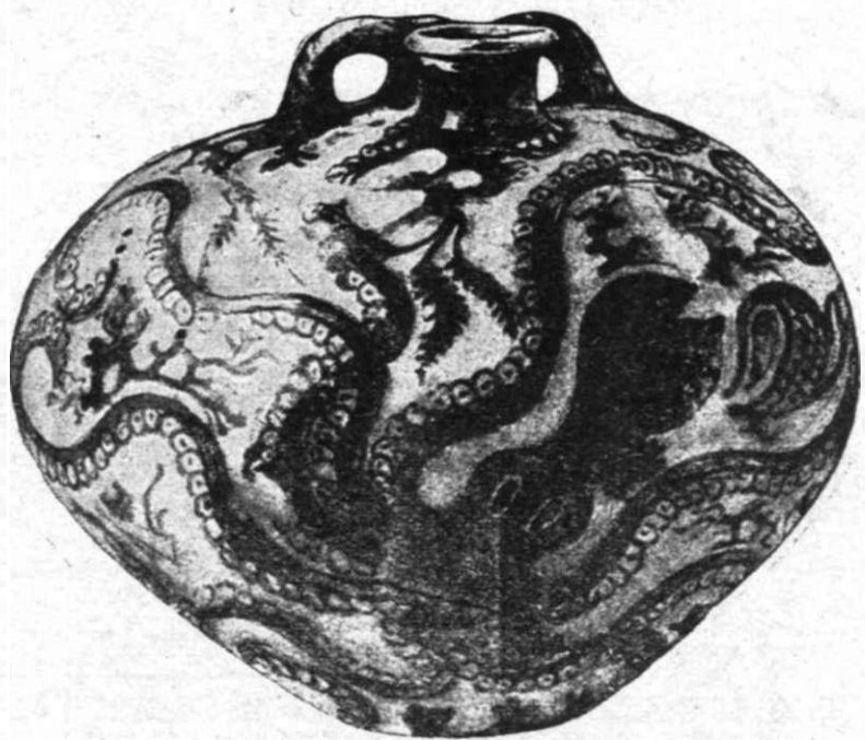
Εἰκ. Ἀρ. 1

Στὸ τέλος ὅμως τῆς Μυκηναϊκῆς ἐποχῆς ὁ καλλιτέχνης δὲν ἔχει γιὰ τὸν ἐξωτερικὸν κόσμον τὴν ἴδιαν αἴσθησιν καὶ γι' αὐτὸ οὐτε τὸ ἴδιο στυλ. Τὸ ἴδιο πράμα, τὸ χυπόδι, πάβει πιά νὰ εἶναι γι' αὐτὸν τὸ ζωντανὸ πλάσμα, πὺν ἦταν γιὰ τὸν παλιό-