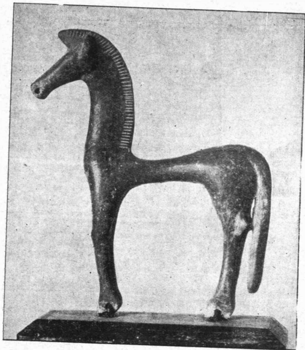
Εἰκ. Ἄρ. 7

Ἔχουμε ὅμως ἀρκετὰ μικρὰ ἀγαλματάκια, ἀφιερῶματα σὲ θεοὺς ἢ νεκρούς.