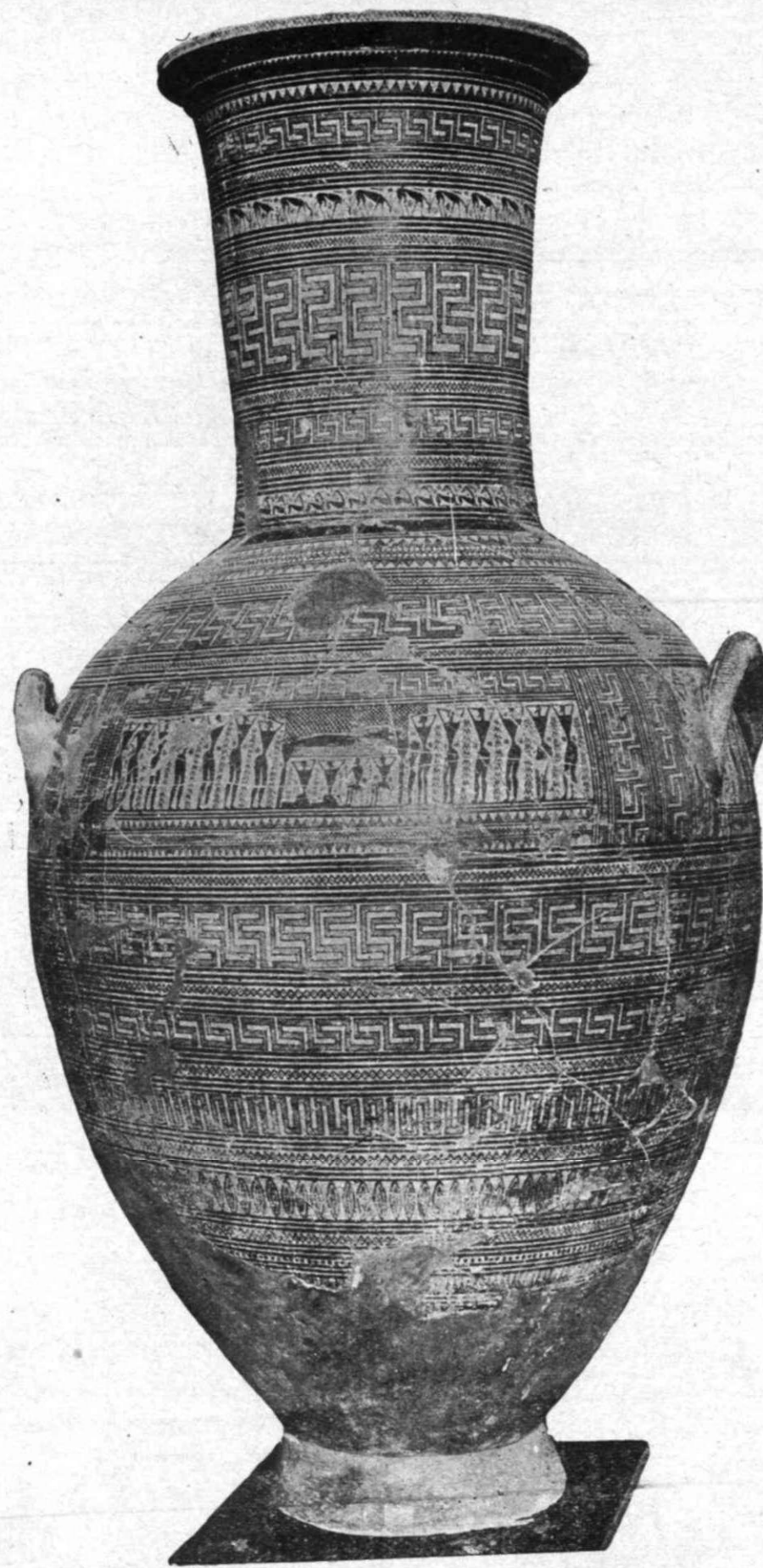
Εἰκ. Ἀρ. 3