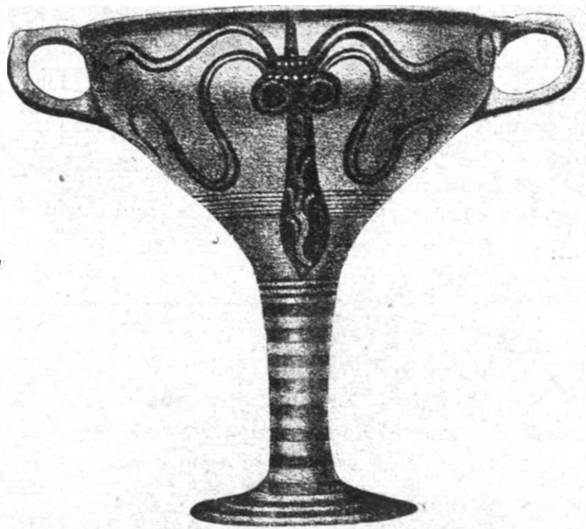
Εἰκ. Ἀρ. 2

τερο καλλιτέχνη, καὶ γίνεται γραμῆ, σχῆμα (εἰκ. 2). Μιλᾶμε τότε γιὰ σχηματοποίηση (stylisation) τῆς τέχνης, πὺν «βροῖσκει τὴν ὁμορφιὰ στὸ ἀνόργανο» πὺν