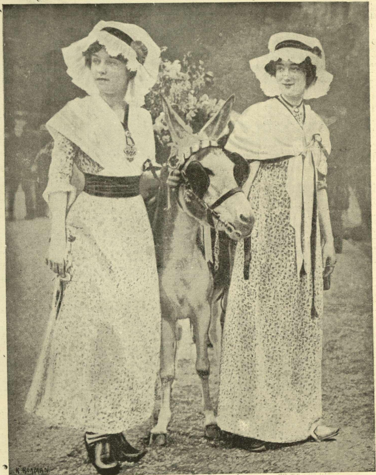
ΠΡΟΣ ΤΗΝ ΕΒΟΧΗΝ