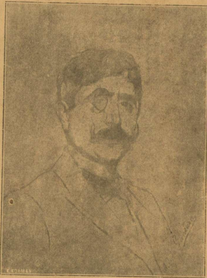
† JEAN MOREAS