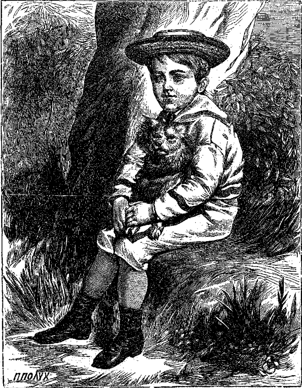
Τὸ παιδίον καὶ ὁ σκύλος Πιστός.