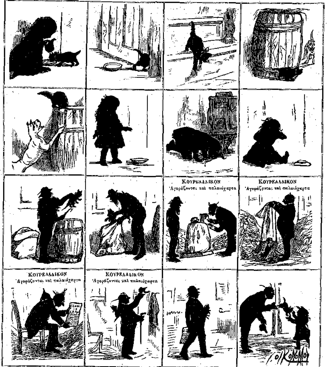
ΚΟΥΡΕΛΛΑΔΙΚΟΝ Ἀγοράζονται καὶ πωλεῖσθαι

Ὁ διαγωνισμὸς αὐτός, μικρῆς καὶ εὐκαταστάτου, εἶνε ποικιλοτέροσ τῶν προηγουμένων. Καὶ ἔτι εἶνε εὐκατάστατος· διότι θὰ ἐπιχειρήσῃτε νὰ συνθέσῃτε ἐν διήγημα ἐπὶ τῇ βῆσει τῶν 16-μικρῶν εἰκόνων τὰς ὁποῖας βλέπετε κατωτέρω, καὶ αἱ ὁποῖαι, ἐν τῶς παρατηρήσει προσηκόντως τὴν μίαν κατόπιν τῆς ἄλλης, θὰ εἴχησιν ἕνα λόγον φανερά - φανερά ἐν διήγημα. Ἀλλ' εἶνα ἴσα - ἴσα θὰ φανούσιν αἱ πρόδοί σας· ἐν φροντιστείτε αὐτοὺς τὸ ὅποιον αἱ εἰκόνες τῶν ἀδελφῶν λέγουσιν νὰ εἰ διασκευαστέσιν ἐπὶ τοῦ γάρτου μὴ ἀρῶνται καὶ μὴ χῆρουν. Οἱ ἔροι καὶ τοῦ διαγωνισμοῦ τούτου εἶνε οἱ αὐτοὶ μὲ τοὺς τῶν προηγουμένων: Πρῶτος: α') τὸ διήγημά σας νὰ μὴ περιεχῇ κλεισίαν τῶν 400 λέξεων· β') Νὰ εἴχησιν εἰς τὸ Γραφεῖόν μας πρὸ τῆς 20 τοῦ προσηκούστος Ἰαννουαρίου γ') Νὰ πῆρῃ τέλος: Ἀκάντησιν εἰς τὸν δ'. Διαγωνισμὸς δ' α) ἢ εἰς τὴν 20 τοῦ προσηκούστος Ἰαννουαρίου καὶ τὸ ὄνομα ἢ τὸ ψευδώνυμον τοῦ διαγωνιστοῦ ὡς καὶ τὴν ἡλικίαν του, διότι δ' εἶναι μόνον οἱ μὴ ὑπερβαίνουσιν τὸ 15 ἔτος τῆς ἡλικίας τῶν δυνάτων· νὰ συμπληρώσῃτε τὸν διαγωνισμὸν. Ἐν τῇ φυλλοδίνῃ τοῦ προσηκούστος Φεβρουαρίου θὰ δημοσιουῖται τὸ βραβευθῆσομενον διήγημα καὶ ἡ εἰκὼν τοῦ γράψαντος αὐτό, ἐν μὲν ἀποστείλῃ τὴν φωτογραφίαν του. Τὰ δύο βραβευθῆσομενα διήγηματα θὰ ἐπιανεθῶσιν, θὰ τῶμας δ' ἀφῆρου μνείας ἔσῃ θὰ κερδίσουν ἄλλα αὐτῆς.