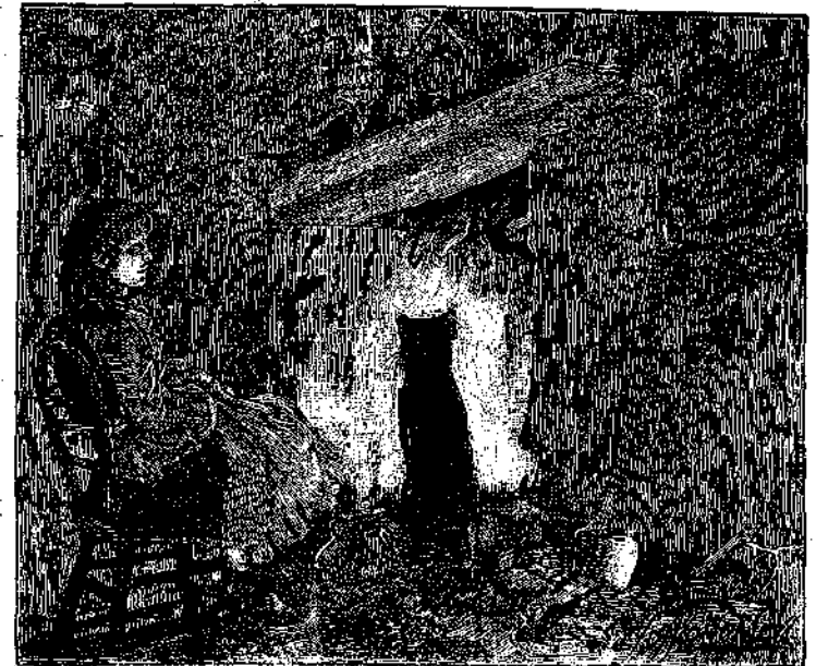
« Διήρχετο τὸ πλεῖστον τῆς ἡμέρας

— Δὲν γνωρίζω, μοι εἶπεν, ἀλλ' ὑποθέτω ὅτι καὶ ἐκείνη θὰ εἶχεν, ὡς ἐγὼ, καμμίαν μάμμην σοφὴν.