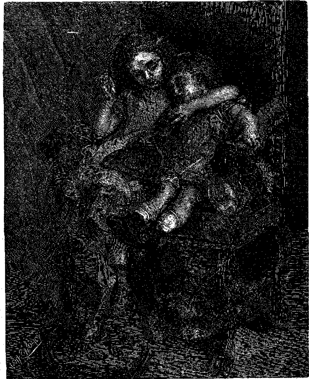
« ΤΙ ΘΡΑΪΑ ΛΑΕΛΑΦΑΚΙΑ! ΤΙ ΑΓΑΠΗΜΕΝΟ ΤΑΪΡΙ! »