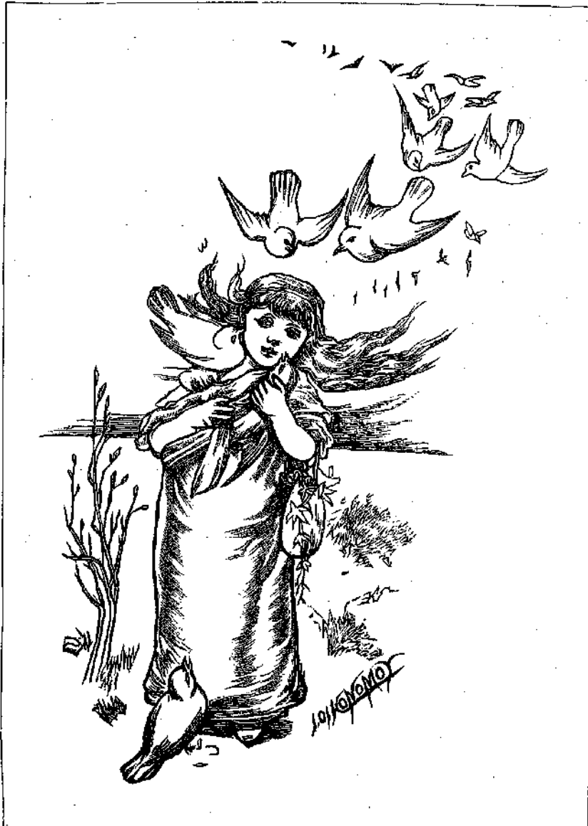
Ἡ ΦΑΝΗ ΚΑΙ ΤΑ ΠΕΡΙΣΤΕΡΑΚΙΑ