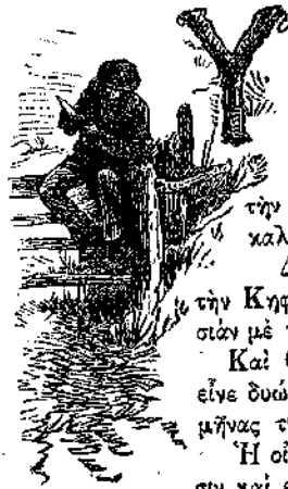
ΕΥΧΑΡΙΣΤΕΙΤΟ ΝΑ ΔΙΑΒΑΖΗ.

Υ ΠΑΤΙΑ καί Ἀλκιβιάδης ἐλέγοντο δύο ἡγαπημένα ἀδελφία, καὶ ὅποια τὸν Σεπτεμβρίον ἦλθαν εἰς τὰς Ἀθήνας μετὰ τὸν πατέρα των καί τὴν μητέρα των ἀπὸ τὴν ἐξοχὴν ὅπου ἐπέρασαν τὸ καλοκαίρι.