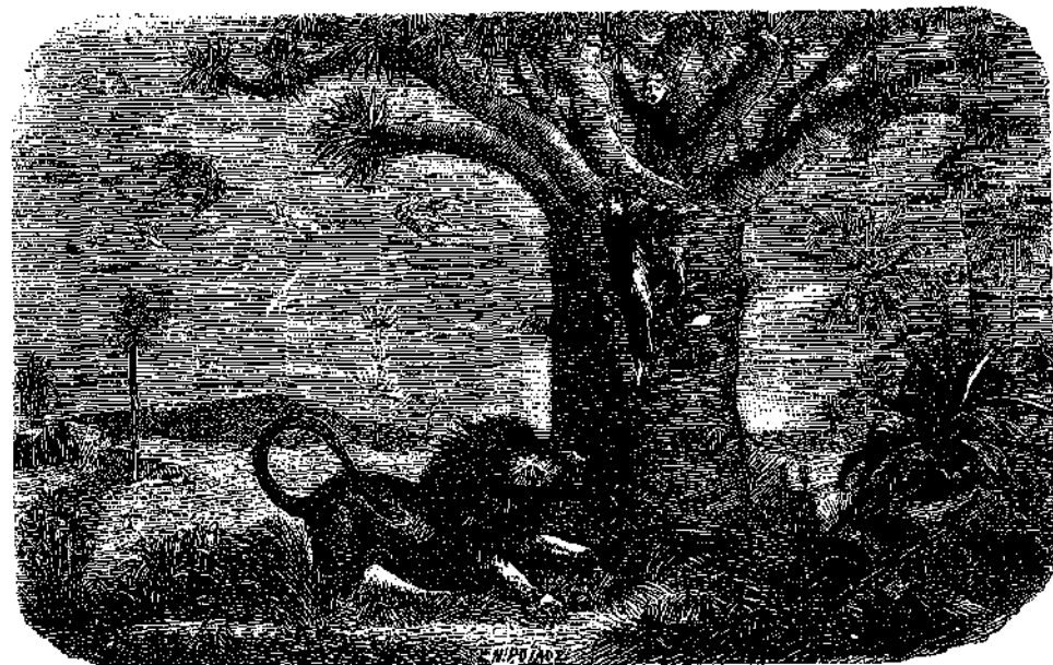
Ο ΛΕΩΝ ΕΠΕΤΕΘΗ ΚΑΤΑ ΤΟΥ ΓΟΥΒΑ ΚΑΙ ΤΟΥ ΜΠΕΝ-ΜΠΡΑΙΕ. [Εἶναι ἐκ τοῦ παιδικοῦ μυθιστορήματος « Εἰς τὴν θάλασσαν! »]

Ἡ δὲ Τσάτσα Γελαστῆ εἶνε, λέγει, πολὺ περιέργη καὶ ἀνυπόμονη νὰ μάθῃ πῶς εἰμπόρεται νὰ ξεφορᾷ ὁ