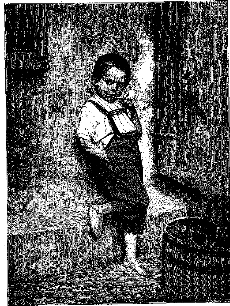
Ο ΜΙΚΡΟΣ ΚΑΠΝΙΣΤΗΣ