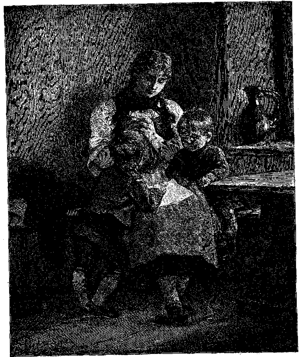
* ΚΥΤΤΑ ΤΟ ΟΝΟΜΑ ΜΟΥ ΤΥΠΩΜΕΝΟΝ *

Ἴδου διατί. Εἶνε τὰρα πέντε ἡμέραι, ὁ διδάσκαλός των τοῖς ὠμίλησε διὰ τὴν μεγάλην πλημμύραν ὅπου ἔγεινεν εἰς τὴν Θεσσαλίαν· κατέβασεν ὁ Πηγεῖος καὶ ἐκρήμνισε σπήτια, ἐπῆρεν ἐπιπλά, ἐχάλασε χωράφια· τὸ νερὸν ἐμῆλκε μέσα εἰς τοὺς δρόμους ὡς ἄγριον θηρίον, καὶ ἤθελε νὰ σκεπάσῃ τὰ σπήτια, νὰ πνίξῃ ὄσους ἦσαν μέσα· φαντασθῆτε τοὺς καυμένους ἦσαν κλεισμένοι μέσα τὸ νερὸν ἐβόλκεν ἀπ' ἔξω ἐνόμιζες ὅτι ἦτο θάλασσα· ἔμβαينεν ἀπὸ τὴν θύραν ἐγέμιζε τὸ κάτω πάτωμα· οἱ ἄνδρες, αἱ γυναῖκες, τὰ παιδιὰ ἀνέβαιναν εἰς τὸ παραπάνω πάτωμα, ἀνέ-